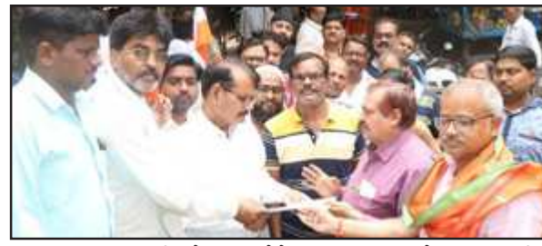
अपर जिलाधिकारी को ज्ञापन देते व्यापार मण्डल के पदाधिकारी।

प्रधानमंत्री को संबोधित ज्ञापन अपर जिलाधिकारी को सौंपा