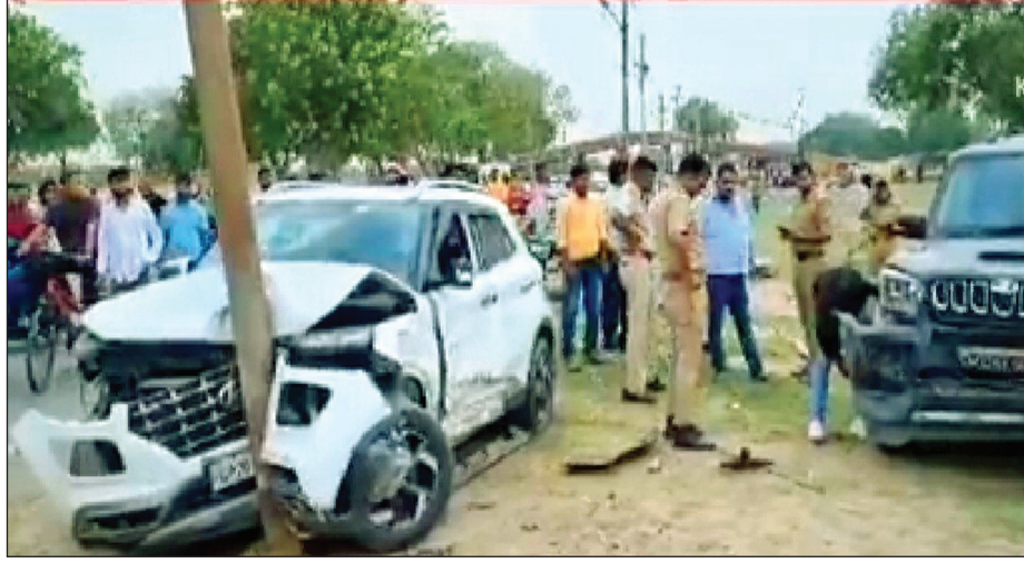
जैन ने बताया की लालगंज वाटेड दो अभियुक्त को रायबरेली से ट्रक लूट में रायबरेली की एसओजी टीम

प्रयागराज। दारागंज परेड मैदान में उस समय हड़कंप मच गया रायबरेली की एसओजी टीम ने दारागंज के परेड मैदान से ट्रक लूट में वांछित दो बदमाशों को दौड़ाकर दबोच लिया। पुलिस से बचने के लिए बदमाश कार लेकर तेजी से भागे तो बिजली के पोल से टकरा गया। तब उन्हें घेरकर पकड़ा गया। बदमाशों की कार पर भाजपा का झंडा भी लगे होने की जानकारी सामने आ रही है। कहा जा रहा है की अभियुक्तों ने फार्यरिंग की, लेकिन दारागंज पुलिस इससे इन्कार कर रही है। एसीपी चिराग