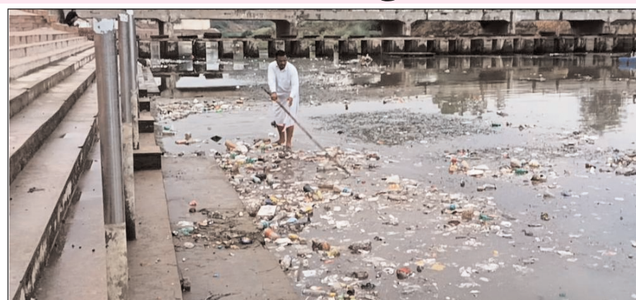
बूड़े हनुमान मंदिर के नीचे नया रपटा बनाया जाये। इस नए रपटे के बनने