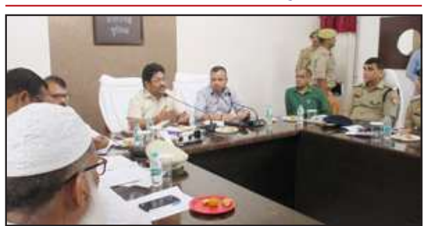
उद्योग बन्धु की बैठक में बोलते जिलाधिकारी प्रकाश चंद्र श्रीवास्तव।

डीएम की अध्यक्षता में जिला उद्योग बन्धु की बैठक सम्पन्न