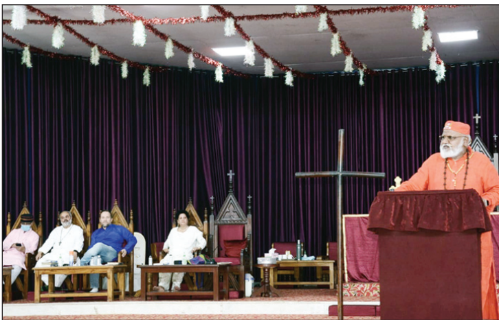
गुड फ्राइडे विशेष प्रार्थना में बोलते कुलपति

यीशु मसीह द्वारा क्रूस पर बोले गये सात वचनों को जीवंत किया गया