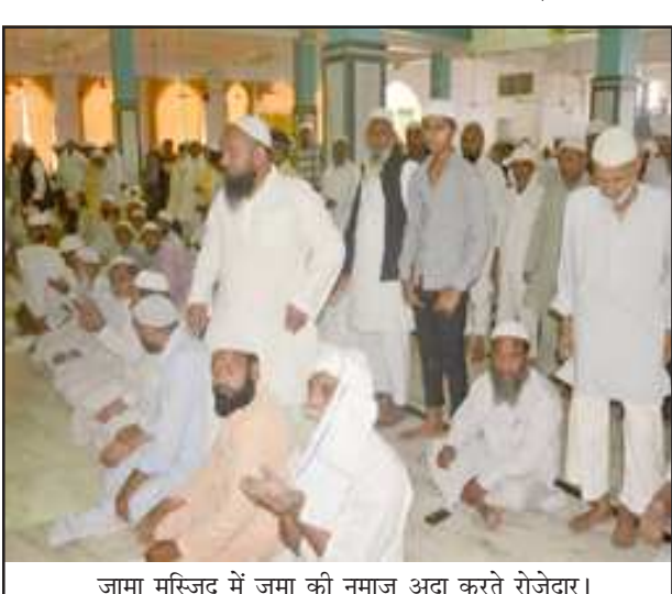
जामा मस्जिद में जुमा की नमाज अदा करते रोजेदार।

प्रतापगढ़। रमजान के दूसरे जुमे को जिले की हर मस्जिदों में रोजेदारों की भीड़ रही। जुमे की नमाज के बाद रोजेदारों ने गरीबों और मिस्कीनों को सदाकत और जकात दिया। इस दौरान पेशादाम द्वारा मुल्क में अमन व चैन की सलामती के लिये दुआएं की गईं। रोजेदारों ने रो-रोकर अपनी-अपनी दुआएं मांगी। बता दें कि रमजान में रोजे की बहुत ही ज्यादा फजीलत इस्लामी किताबों में आई है। दीनी किताबों के अनुसार रमजान में कोई भी दुआएं रह नहीं होती हैं। जुमा के बाद लोगों ने रोजा इफ्तारी के लिये खरीदारी भी की।