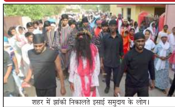
शहर में झांकी निकालते इसाई समुदाय के लोग।

क्रिश्चियन कालोनी से होते हुए संत फासिस स्कूल, अम्बेडकर चौराहा, संत अंथोनी स्कूल, संत जोसेफ