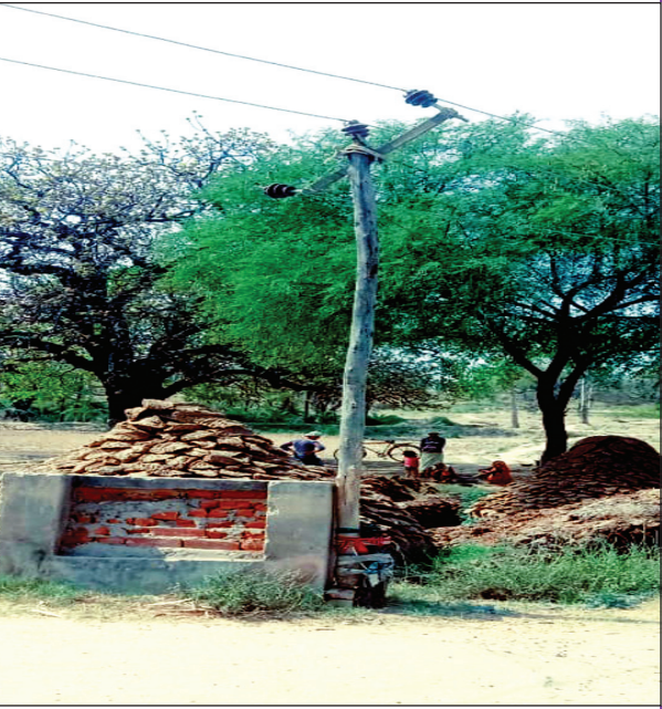
बल्ली के सहारे झूलती विद्युत तार

पश्चिम शरीरा कौशाम्बी। पश्चिम शरीरा विद्युत उपकेंद्र के अंतर्गत देवरी गांव की आवादी होकर नलकूप को जाने वाली 11000 हाई वोल्टेज की तार बल्ली के सहारे लटक रही है हाई वोल्टेज तार में विद्युत खंभे का प्रयोग नहीं किया गया है छोटी बल्ली के सहारे हाई वोल्टेज तार नलकूप को पहुंचाई गई है हाई वोल्टेज तार से कई बार ग्रामीण विद्युत के करंट की चपेट में आते आते चब गए हैं आज फिर ट्रैक्टर में भूसा ले कर जा रहा एक बूटिक विद्युत तार की चपेट में आने से बच गया है वरना बड़ा हादसा हो जाता मामले की कई बार शिकायत ग्रामीणों ने विद्युत पावर हाउस के अधिकारियों से की लेकिन झूलते विद्युत तार ठीक नहीं हो सकी है जिससे ग्रामीणों में आक्रोश व्याप्त है ग्रामीणों का कहना है कि विद्युत विभाग क्या किसी बड़ी अनहोनी घटना का इंतजार कर रहा है ग्रामीणों