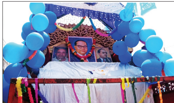
अंबेडकर जयंती पढ़ सजाया गया पांडाल

संविधान की मूलभूत संरचना के साथ अपने हर फैसले में खिलवाड़ किया है। उन्होंने कहा कि समता मूलक समाज के लिए बाबा साहेब की विचारधारा को आगे बढ़ाने का काम किया जाएगा। बाबा साहेब ने ऐसे समाज का सपना देखा था जिसमें गैर बराबरी और भेदभाव का स्थान न हो आज के हालातों से डरने वालों को बाबा साहेब का संघर्ष याद करना चाहिए, इससे जरूर रास्ता मिलेगा और परिवर्तन होगा।