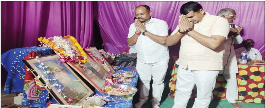
अंबेडकर जयंती मनाते नेता