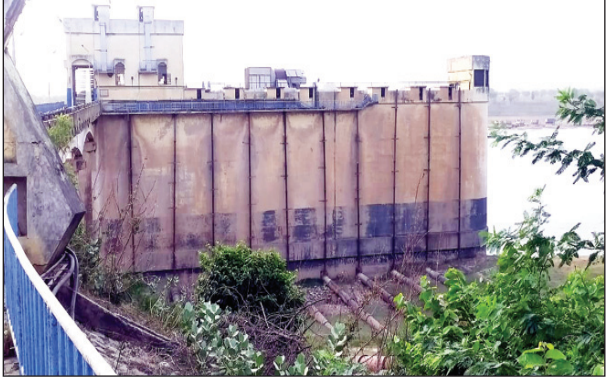
बारा में कमला पंप कैनाल

बारा। कमला पंप कैनाल बारा क्षेत्र के सैकड़ों गांवों की खेती की सिंचाई का एक मात्र साधन है इस नहर से तरहार क्षेत्र के अलावा बारा क्षेत्र के धरा बवनधर कोरारी टिकरी बारा उमापुर चामू बैजला असरवाई पिपरगव गौज पहाड़ी इलाकों में धान की बीज डालने का आ गया है लेकिन नहर बंद होने से किसान परेशान हैं धान की और सब्जी की खेती यहां के किसानों की आय का मुख्य जरिया है अगर समय रहते नहर में पानी नहीं छोड़ा गया तो तपते मौसम के कारण तालाब नाले का पानी सूख गया है बीज डालने