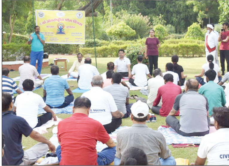
योगाभ्यास करते लोग