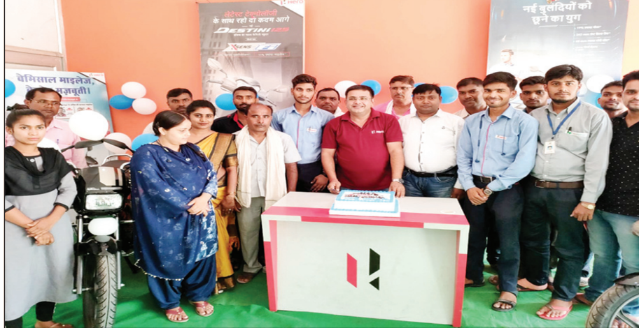
बाइक की लॉचिंग करते एजेंसी मालिक

कौशांबी। पुलिस अधीक्षक के कुशल निर्देशन में चलाये जा रहे अभियान में साधारण नारपीट व शांति भंग करने के आरोप में थाना करारी से दो थाना चरवा से एक थाना पिपरी से दो थाना सेनी से दो थाना मोहबतपुर पंडसा से दो कुल नौ अभियुक्तों को गिरफ्तार कर चालान न्यायालय कर दिया है।