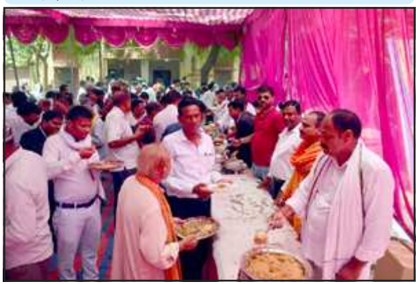
महाप्रसाद वितरण में प्रसाद ग्रहण करते लोग।

डीएम, एसपी व विधायक को किया गया सम्मानित