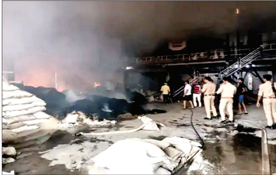
राइस मिल में आग के बाद मौके पर मौजूद पुलिस