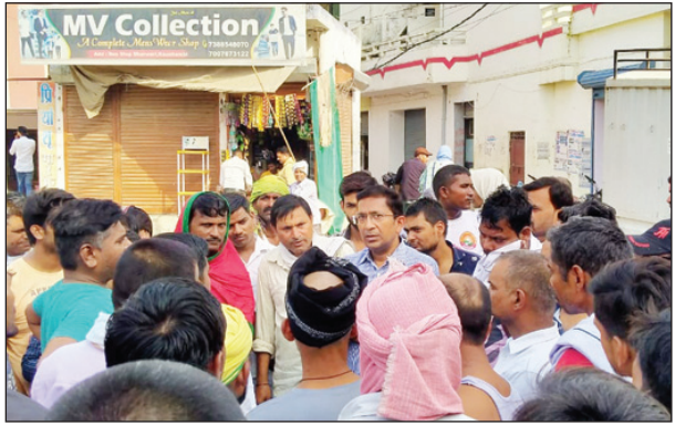
नगर पालिका भरवारी क्षेत्र का निरीक्षण करते प्रशासक

भरवारी कौशांबी। नगर पालिका परिषद भरवारी में नियुक्त प्रधासक ने आज कार्यालय का किया निरीक्षण निरीक्षण के दौरान उन्होंने पाया कि आरओ प्लांट में तादाद से ज्यादा कर्मचारी पोस्ट किए गए हैं जिस पर उन्होंने कहा कि छवौस कर्मचारियों में से कुछ को हटाकर सफाई व्यवस्था में लगाये जायेंगे। इसके बाद बस स्टॉप में आकर चाय पान के दुकानदारों का निरीक्षण किया जिसमें अधिशाषी अधिकारी को आदेश दिया कि इन दुकानों को हटाकर यहा पर नगर पालिका की तरफ से पक्की दुकान बनाकर वही दुकानदारों को पुनः आबंटित कर दी