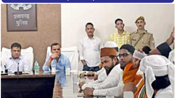
डीएम-एसपी से वार्ता करते जिले के उलेमागण।