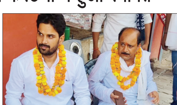
राष्ट्रीय सचिव का करछना में स्वागत करते कांग्रेस के लोग