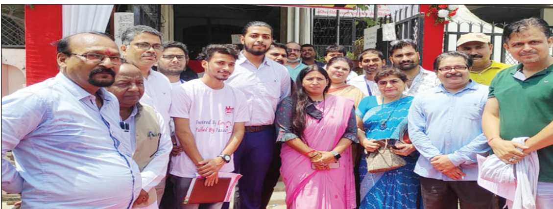
विश्व रक्तदाता दिवस के उपलक्ष्य में यूफोरियल यूथ सोसाइटी द्वारा रक्तदान शिविर में मेयर के साथ