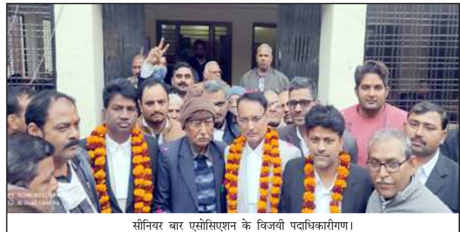
सीनियर बार एसोसिएशन के विजयी पदाधिकारीगण।