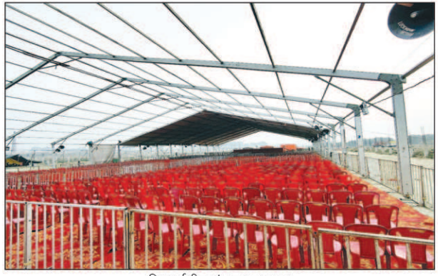
निर्माणधीन पंडाल का दृश्य