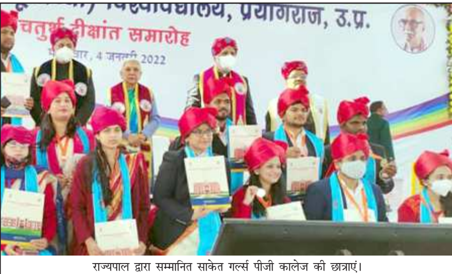
राज्यपाल द्वारा सम्मानित साकेत गर्ल्स पीजी कालेज की छात्राएं।