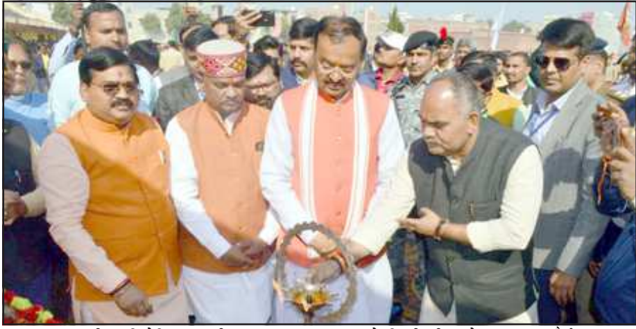
जनपदीय प्रतियोगिता का दीप जलाकर शुभारंभ करते डिप्टी सीएम केशव प्रसाद मोर्य।

उन्होंने कहा कि अब तो खिलाड़ियों को नौकरी भी दी जाने लगी है। चार घंटे विलम्ब से हेलीकाप्टर से पुलिस लाइन में उतरे डिप्टी सीएम सीधे जिला स्टेडियम आकर मंत्रोच्चारण के बीच दीप प्रज्वलन कर जनपदीय प्रतियोगिता का शुभारंभ किया। इस अवसर पर उन्होंने कहा कि युवाओं को प्रधानमंत्री नरेन्द्र मोदी समय समय पर प्रोत्साहित करते रहते हैं। अब तो महिलाएँ भी पीछे नहीं रही हैं। डिप्टी सीएम ने