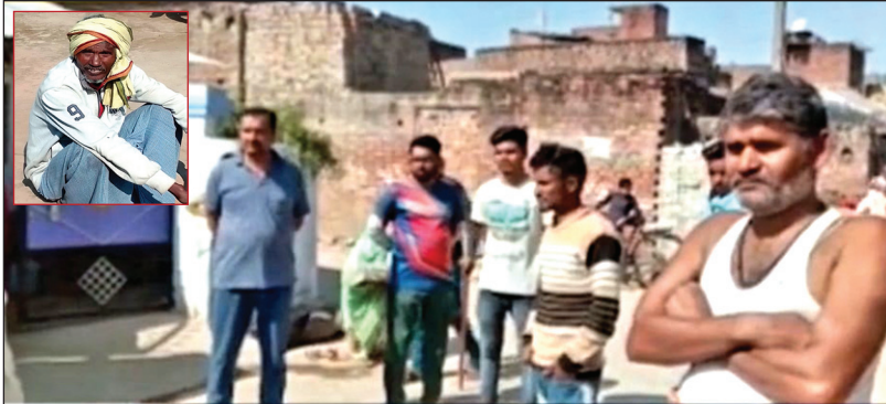
मौत की जानकारी मिलने के बाद घर के बाहर लगी ग्रामीणों की भीड़ तथा इन्सेट में मृतक की फाइल फोटो