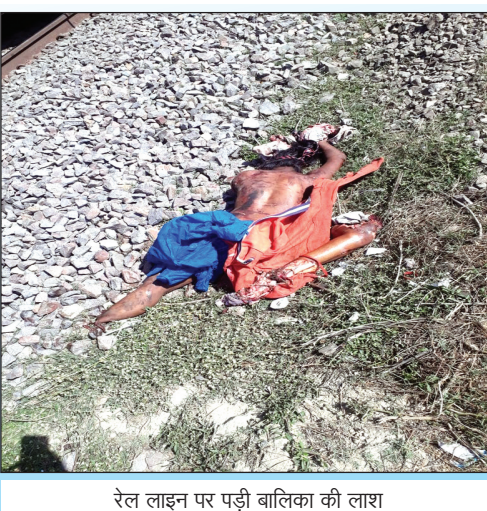
रेल लाइन पर पड़ी बालिका की लाश

जिससे ट्रेन हादसे की बात करना पूरी तरह से निराधार होगा बालिका के शरीर के कपड़े फटे नहीं थे घटनास्थल देखकर प्रतीत होता है कि मौत के पूर्व शरीर के कपड़े उतार कर मौत के बाद शव के पास रखे गए हैं सलवार और कुर्ता जो भी कपड़े मौके पर मौजूद हैं उसमें खून नहीं लगे हैं बिना खून लगे कपड़ों के बाद भी पुलिस