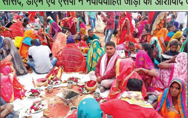
सामूहिक विवाह आयोजन

सांसद, डीएम एवं एसपी ने नवविवाहित जोड़ों को आशीर्वाद देकर ईश्वर से की सफल एवं सुखमय दाम्पत्य जीवन की कामना