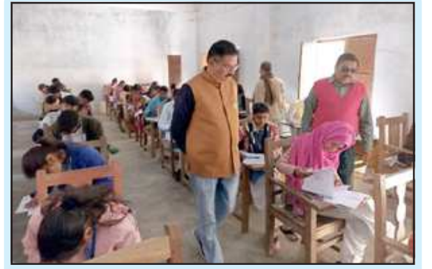
परीक्षा केन्द्र का निरीक्षण करते प्राचार्य।