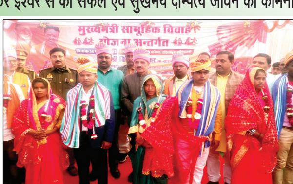
सामूहिक विवाह में नव दंपतियों को आशीर्वाद देते डीएम एसपी सांसद व अन्य