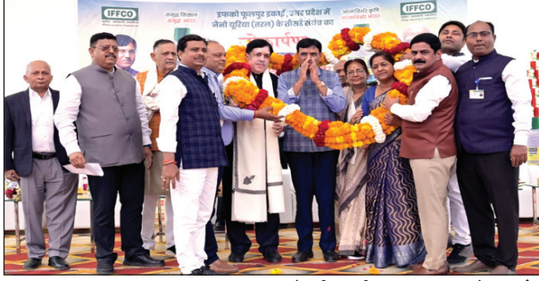
केन्द्रीय मंत्री का स्वागत करते इफको के अधिकारी व मौके पर उपस्थित किसान

फूलपुर। इफको नैनो यूरिया तरल किसानों के भविष्य बदलने की योजना बनेगी। यह वैकल्पिक खाद है, जो मिट्टी की उर्वरा शक्ति को जीवंत रखती है। किसान की आय व समृद्धि के लिए नैनो यूरिया तरल बरदान साबित हो रही है। अब किसानों को नैनो यूरिया तरल के साथ-साथ आने वाले दिनों में नैनो डीएपी भी उपलब्ध होगा। नैनो यूरिया से किसानों की समृद्धि के साथ-साथ भारत का भी भविष्य बनेगा। उक्त बातें मंगलवार को इफको फूलपुर इकाई में नैनो यूरिया तरल के नवीन संयंत्र का लोकार्पण के बाद समारोह को संबोधित करते हुए केंद्रीय स्वास्थ्य एवं परिवार कल्याण, रसायन एवं उर्वरक मंत्री भारत सरकार डां मनसुख मांडविया ने कहा। उन्होंने कहा कि किसानों को समय व आवश्यकता पर खाद मिले यह सरकार की प्राथमिकता में है। किसान देश के अन्नदाता हैं, इसलिए एक किसान दूसरे