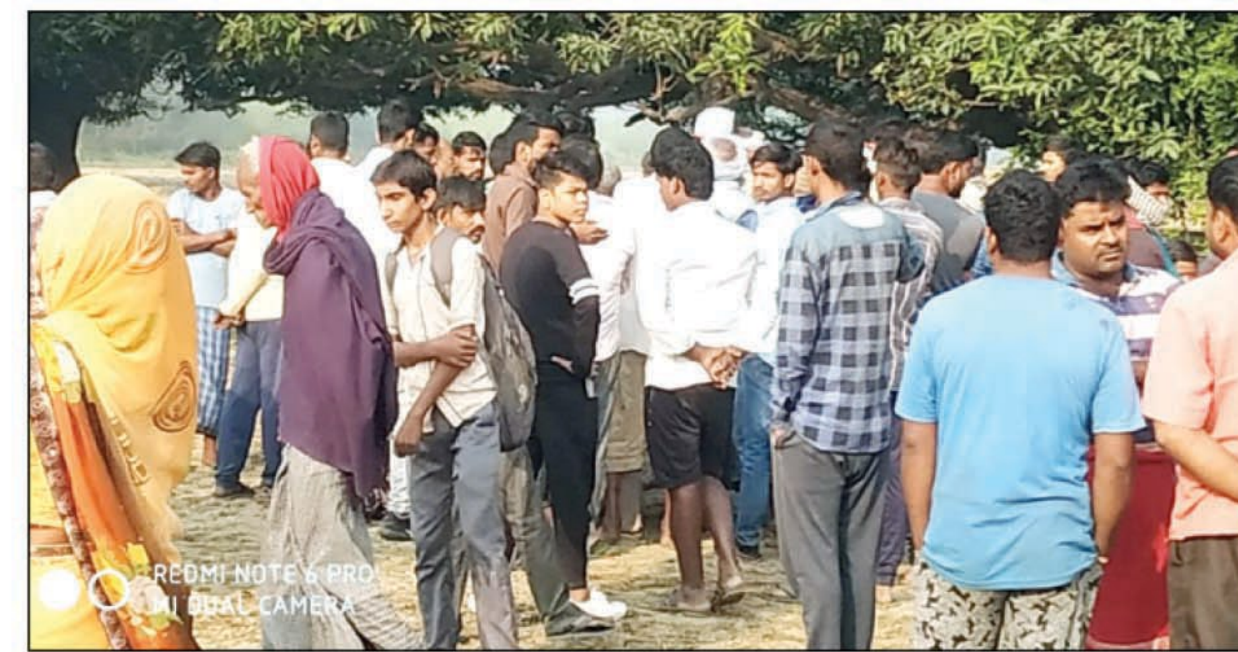
अधेड़ की मौत के बाद जुटी लोगों की भीड़

हनुमानगंज। सरायइनायत थाना क्षेत्र के सुदनीपुर कला गांव के निकट गुरुवार कि सुबह 7 बजे रेलवे ट्रैक पर एक अधेड़ की छतविछत शव लोगों ने देखा तो इसकी सूचना पुलिस को दी जबतक पुलिस पहुंच पाती परिजन भी मौके पर पहुंच चुके थे। परिजनों के आग्रह पर पुलिस ने शव का पंचनामा करके परिजनों को सौंप दिया।