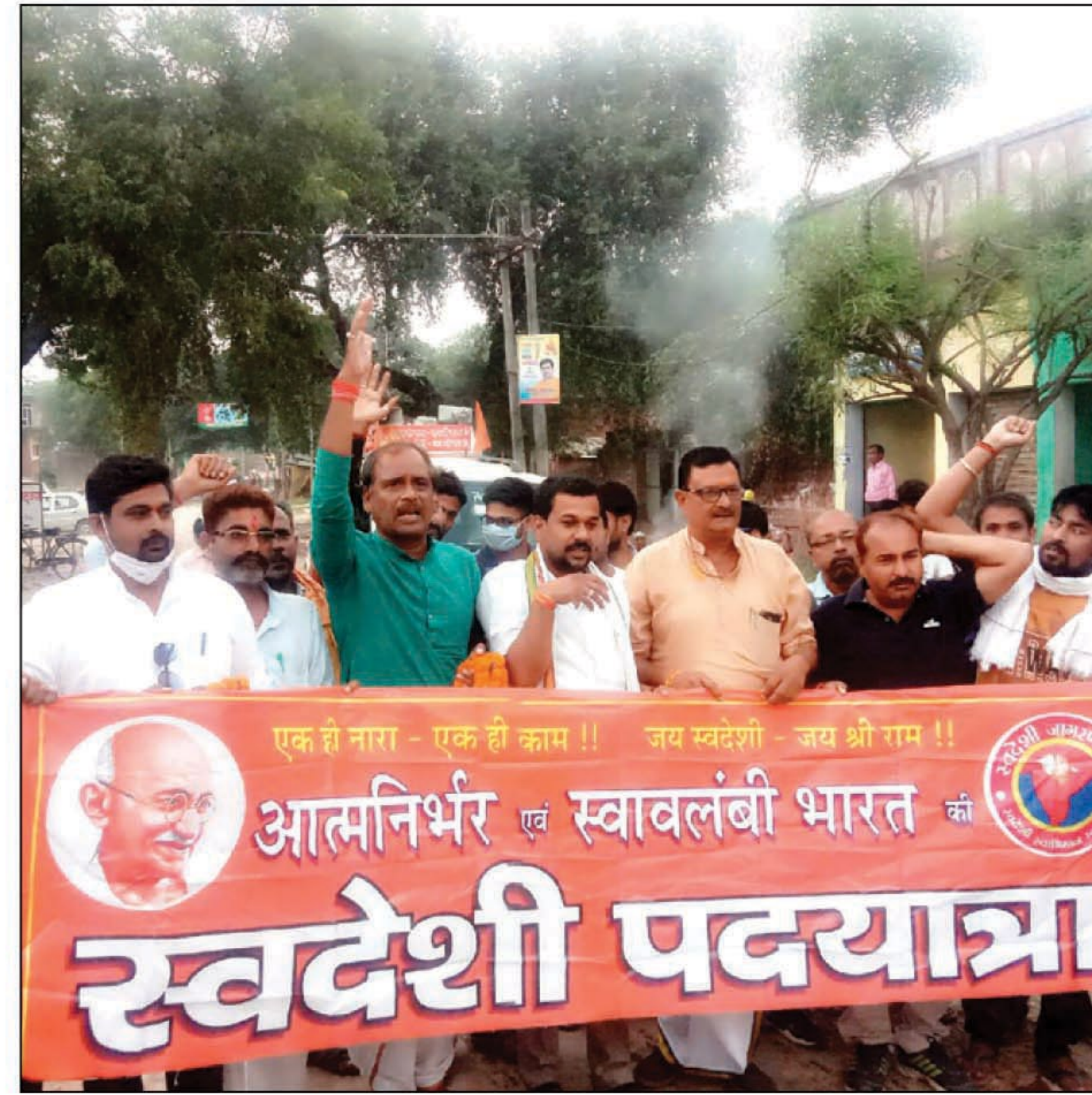
स्वदेशी पदयात्रा के दौरान चीनी वस्तुओं का का किया दहन