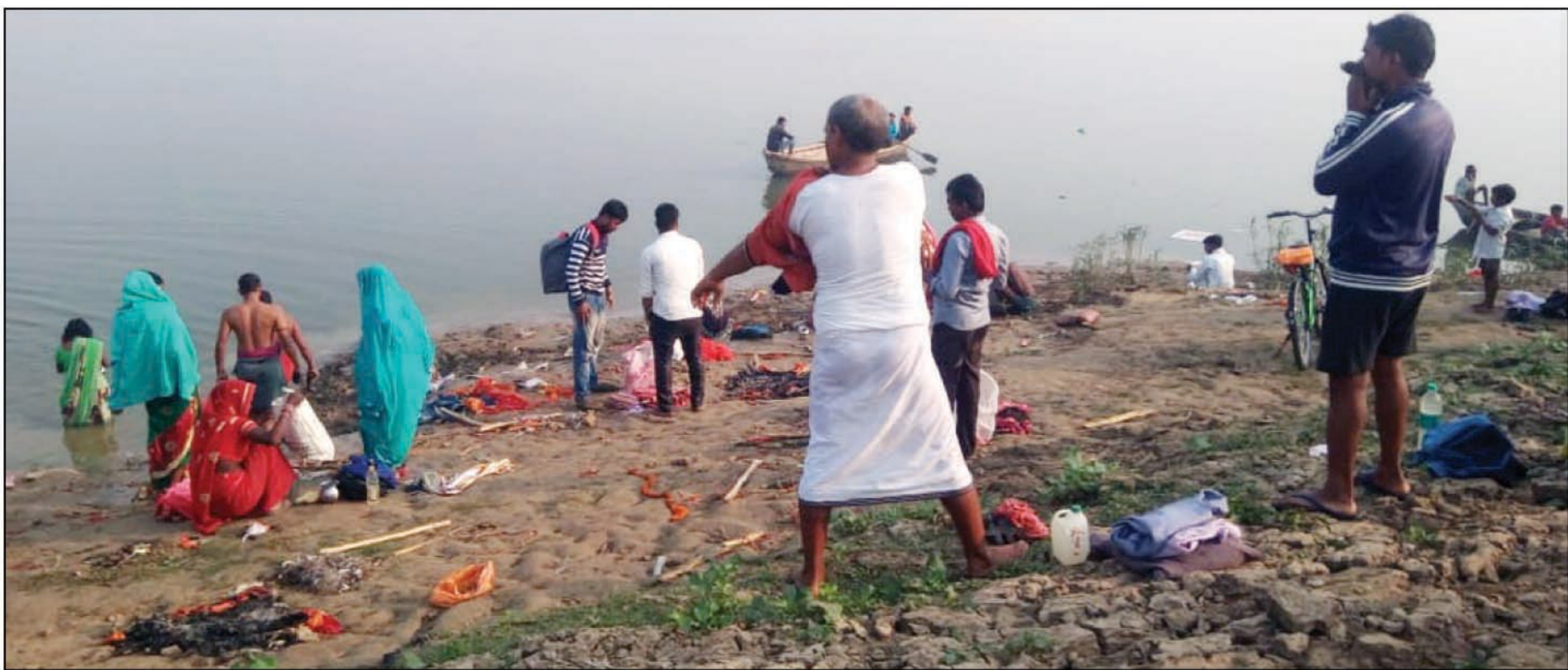
कीचड़ के बीच से होकर यमुना तट पर स्नान करते श्रद्धालु

घूरपुर। सुजावन देव यमुना तट पर पूरे कार्तिक मास भर क्षेत्रीय सहित दूर दराज के हजारों श्रद्धालु यमुना स्नान कर पूजा अर्चना दान आदि करते हैं। यमुना के बाढ़ के बाद जलस्तर घटने से घाटों और रास्तों और घाटों पर क्रीचड़ जमा हो जाता है। इस वर्ष भी इसी वजह से सुजावन देव यमुना तट के रास्ते और यमुना तट पर कहीं कीचड़ तो कहीं गंदगी का अंबार लगा हुआ है। 11नवंबर से कार्तिक मास शुरू हो रहा है। चंद्र दिनों ही बाकी है लेकिन स्थानीय प्रशासन अभी तक साफ सफाई की शुरुवात ही नहीं कराई है। जिससे यमुना स्नानार्थियों को भारी दिक्कतों