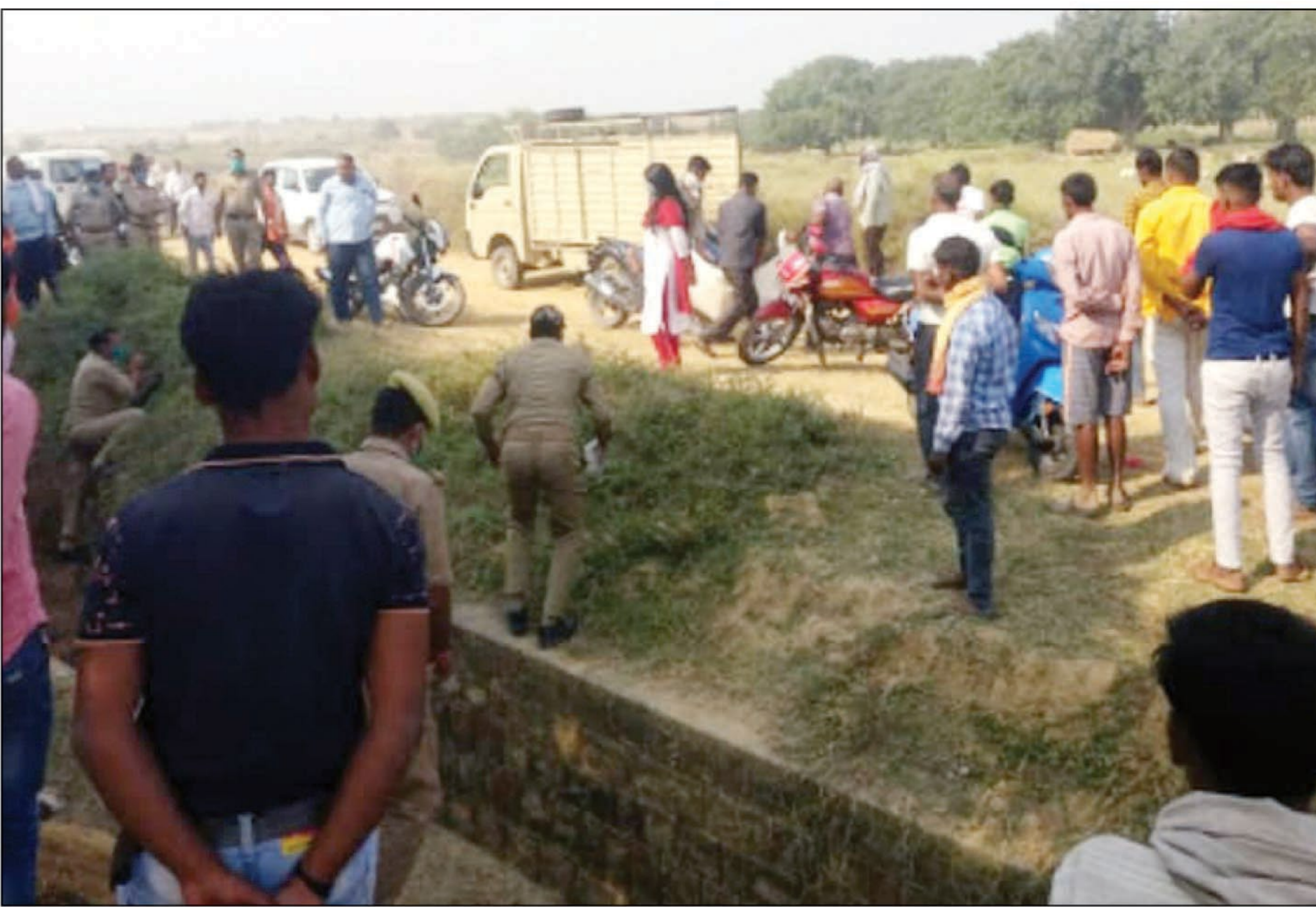
शव मिलने के बाद मौके पर जुटी भीड़