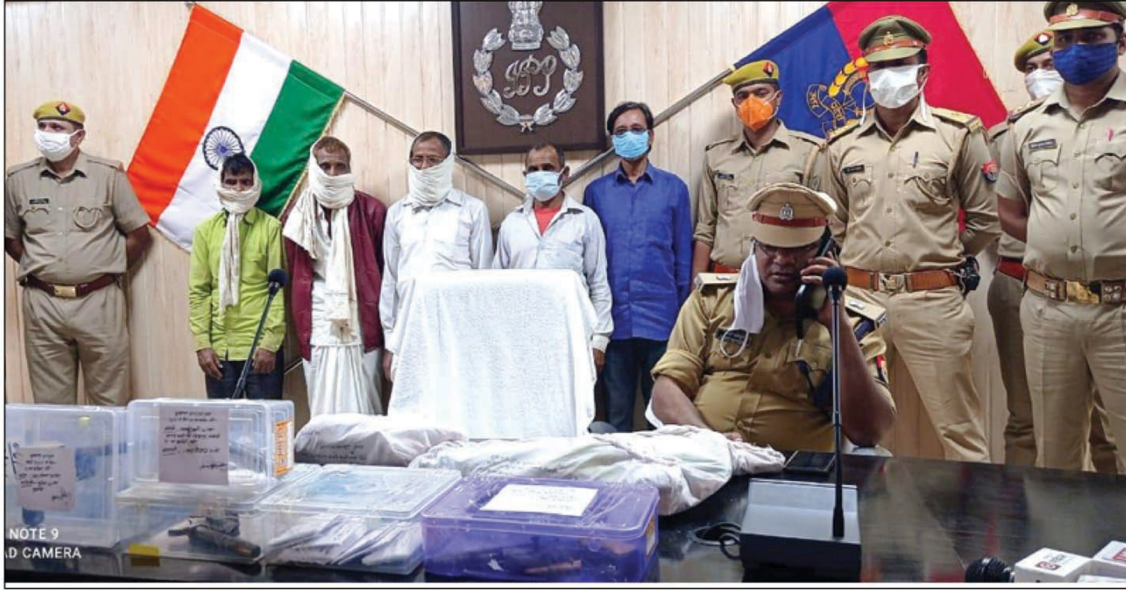
अवैध तमंचा फैक्ट्री के खुलासे की जानकारी देते अपर पुलिस अधीक्षक पीछे खड़े थाना पुलिस और अभियुक्त गण