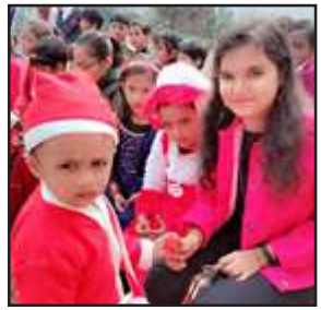
बच्चों को उपहार बांटता ढाई साल का पीजी छात्र।