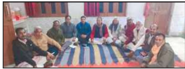
श्रीराम मंदिर प्राण प्रतिष्ठान अभियान समिति की बैठक में मौजूद अतिथिगण