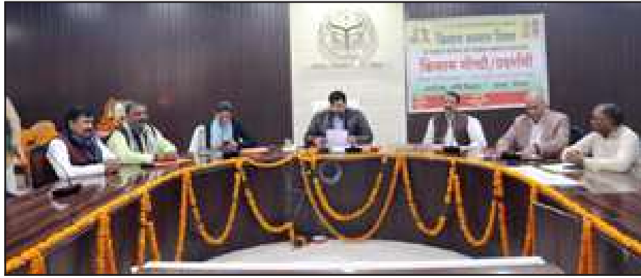
चौधरी चरण सिंह की जयंती मनाते अधिकारी।