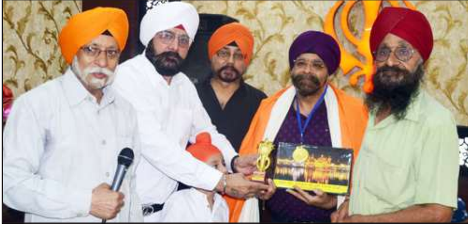
मुख्य अतिथि को सम्मानित करते कमेटी के लोग।

उन्होंने बताया कि आज से 325वर्ष पूर्व 16999 को श्री गुरु गोविंद सिंह ने श्री आनंदपुर साहिब में एक विशाल मीटिंग दौरान हाथ में नंगी तलवार लिए एक सीस की मांग की जो गुरु के भेट करे, इसी तरह बारी बारी पांच सिर लिए और जो बाद में पांच प्यारों के रूप में प्रकट किये और पांच प्यारों को अमृत और कहा खालसा मेरो रूप है खास खास में हऊ करो निवास। साढ़े दस बजे अरदास हुई। इसी के साथ आओ बनिए गुरसिख प्यार