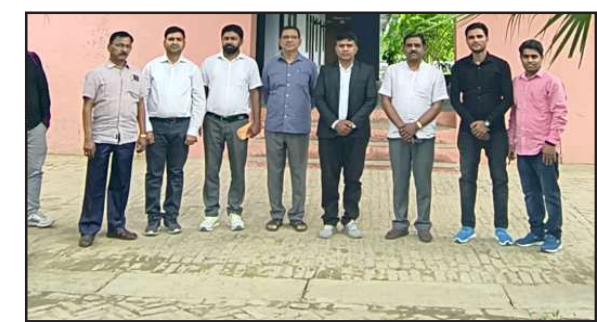
मुख्य अतिथि के साथ मौजूद प्राचार्य।