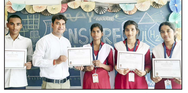
प्रमाण पत्र के साथ सराय आना देव के चार बाल वैज्ञानिक।