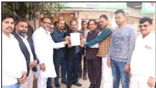
उप जिलाधिकारी को ज्ञापन देते कांग्रेसीगण।