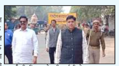
रैली निकालते सीआईसी के छात्र।

चित्रकूट। भारत निर्वाचन आयोग के निर्देश पर विशेष साक्षित पुनरीक्षण अभियान के तहत कर्वी विधानसभा में नये मतदाताओं को अधिक से अधिक