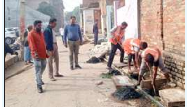
नालियों की सफाई कराते ईओ-वाई मेम्बर।