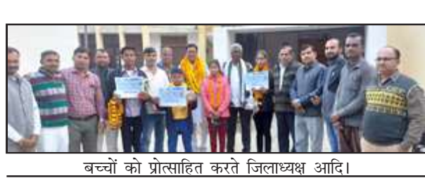
बच्चों को प्रोत्साहित करते जिलाध्यक्ष आदि।