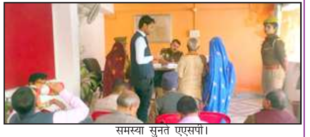
समस्या सुनते एएसपी।