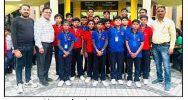
शैक्षिक दूर में शामिल छात्र व स्टाफगण।

इस दौरान लखनऊ के चिड़ियाघर पहुंच गये जहाँ बच्चों ने विभिन्न प्रकार के पशु पक्षी देखे