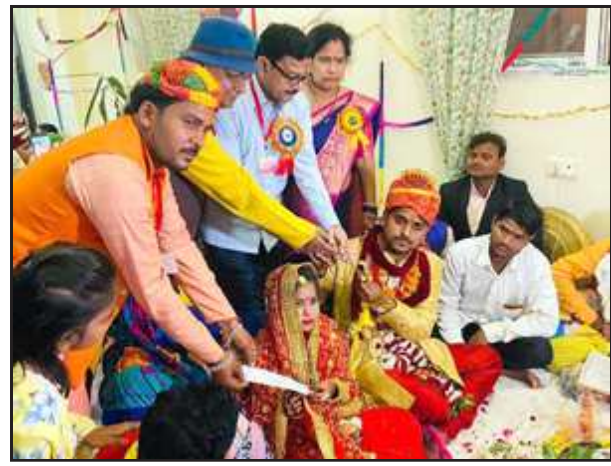
दुल्हा-दुल्हा को विदाई देते क्लब के पदाधिकारी।

प्रतापगढ़। जिला उमरवैश्य समाज सभा द्वारा आयोजित 15वाँ सामूहिक विवाह देर रात संपन्न हुआ। विवाह के पश्चात दुल्हनियों को गृहस्थी बसाने के लिए पूरा सामान दिया गया। सभी वर कन्याओं को बेड, सिंगर दान, रजाई, गद्दा सेट, पायल, सोने का मंगलसूत्र, बिछिया, घड़ी जेन्स, घड़ी लैंडिज, अलमारी, सिलाई मशीन, एल्यूमीनियम टीवी, ट्रीली बैग, पंखा, चूड़ी केश, मेकअप बॉक्स, 5 सेट बर्तन, परात लोटा, गागरा, कुकर, प्रेस, लेमन सेट, स्टील टंकी, कंबल, नमक तेल का