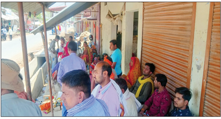
सांड के हमले से कटीले लोहे से निर्माण हो रही नाली पर गिरा व्यक्ति की मौत का दृश्य

सुबह चाय पीने के बाद सड़क पर टहलने निकला था वृद्ध, आवारा मवेशियों पर नहीं लग पा रहा अंकुश, आए दिन हो रही घटनाएं व दुर्घटनाएं