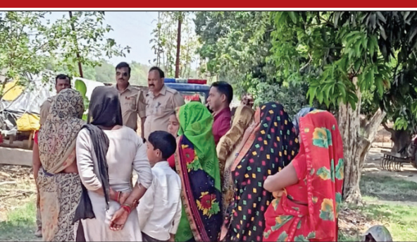
युवक की लाश मिलने के बाद मौके पर मौजूद ग्रामीण

चला गया था और ससुराल में रहकर कोइलाहा स्थित ईंट भट्टे पर काम किया करता था। लोगों की माने तो वह नशे का आदी भी था इसी बात को लेकर बुधवार की रात मृतक और उसकी पत्नी के बीच कहासुनी हुई पत्नी