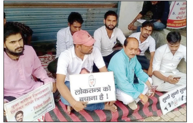
करछना में कांग्रेस का अनशन दूसरे दिन जारी