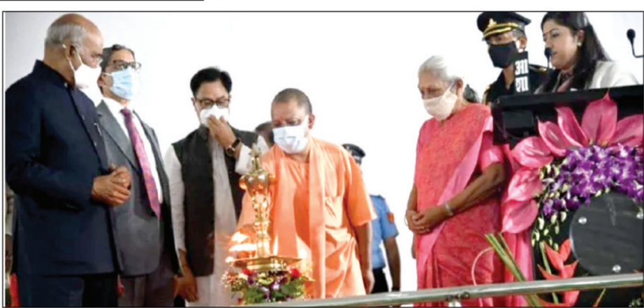
कार्यक्रम के दौरान दीप प्रज्वलित करते मुख्यमंत्री योगी आदित्यनाथ

के लोगों को न्याय प्रक्रिया में भी न्याय मिले, यह हम सबकी जिम्मेदारी है। वह सभी संभव होगा, जब न्याय व्यवस्था से जुड़े सभी स्टेट होल्डर्स अपनी सोच और कार्य संस्कृति में आवश्यक बदलाव लाएंगे और संवेदनशील भी