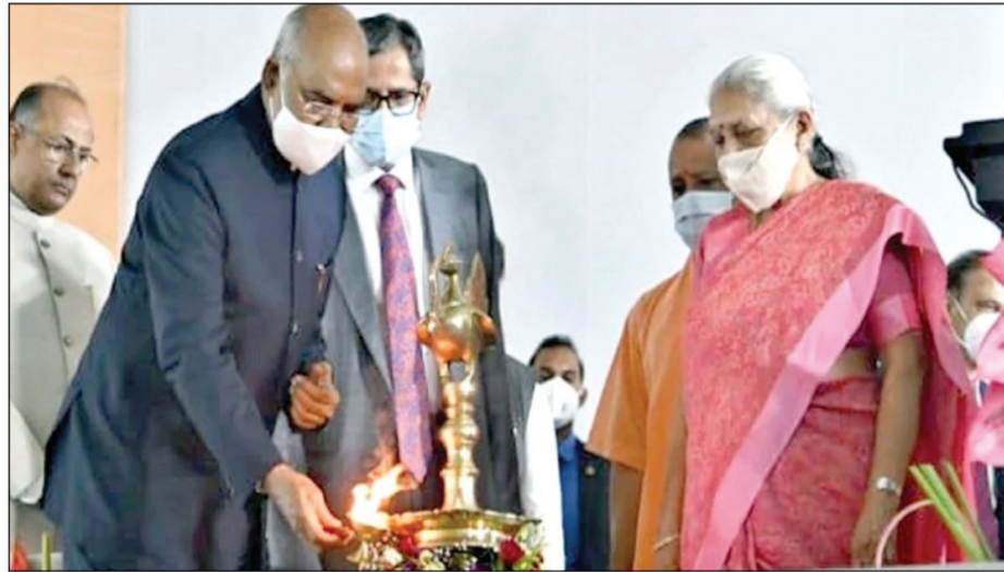
इलाहाबाद हाईकोर्ट में दीप प्रज्वलित कर कार्यक्रम का शुभारंभ करते राष्ट्रपति

दोपहर 12:22 बजे हाईकोर्ट परिसर पहुंचे राष्ट्रपति ने राष्ट्रीय विधि विश्वविद्यालय समेत 640 करोड़ रुपये की परियोजनाओं की रिमोट दबाकर आधारशिला रखी। इस मौके पर उन्होंने न्याय प्रणाली को और मजबूत बनाने के लिए न्यायपालिका में महिला न्यायाधीशों की भागीदारी बढ़ाने पर जोर देते हुए आधी आबादी को बल दिया। उन्होंने कहा कि सामान्यतया महिलाओं में न्याय की प्रवृत्ति का अंश अधिकतम होता है। भले ही इसके कुछ अपवाद भी होते