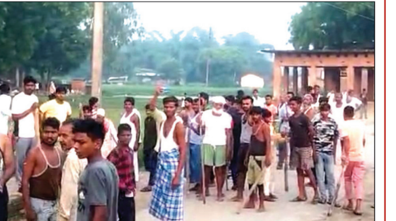
दरोगा का कालर धक्का मुक्की करते दहशतगर्द व लाठी डंडे से लैश आरोपित पक्ष