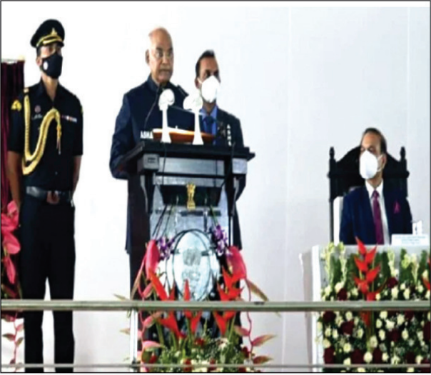
कार्यक्रम के दौरान उद्घोषण देते महामहिम

न्यायपालिका के प्रति लोगों के विश्वास को और बढ़ाने के अधिक लिए इस स्थिति को बदलना जरूरी है। सभी को समय से न्याय मिले, न्याय व्यवस्था कम खचीली हो, समान्य आदमी को समझ में आने वाली भाषा में निर्णय लेने की व्यवस्था हो और खासकर महिलाओं और कमजोर वर्ग