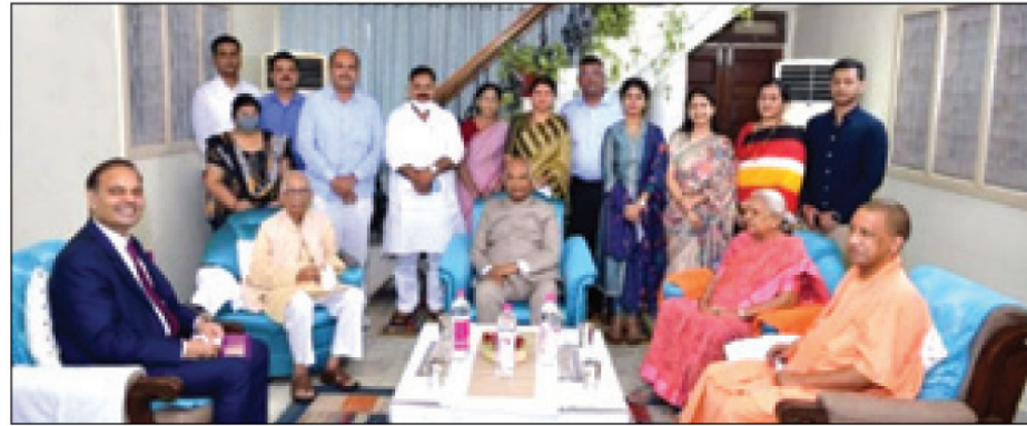
राष्ट्रपति शनिवार शाम पैं बंगाल के पूर्व राज्यपाल केशरी नाथ त्रिपाठी के घर उनसे मिलते।