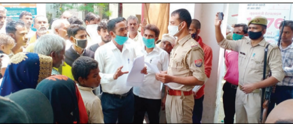
प्रधान के खिलाफ थाने का घेराव करते गांव के लोग