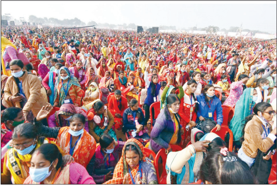
परेड ग्राउंड में मातृशक्ति के महाकुंभ में पहुंची महिलाएं