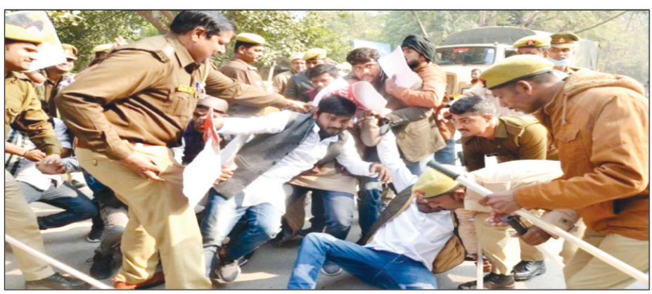
प्रधानमंत्री से मिलने जा रहे छात्रों को रोकती पुलिस