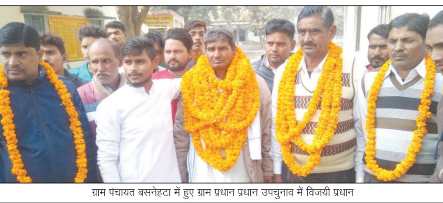
ग्राम पंचायत बसनेहटा में हुए ग्राम प्रधान प्रधान उपचुनाव में विजयी प्रधान