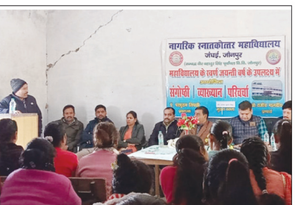
नागरिक पीजी कालेज में अमृत महोत्सव के उपलक्ष्य में संपेटी कार्यक्रम