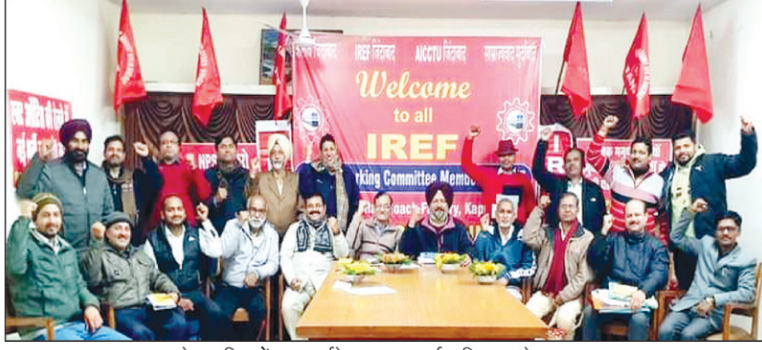
ट्रेड यूनियनों का आइरेफ का समर्थन किए जाने का दृश्य