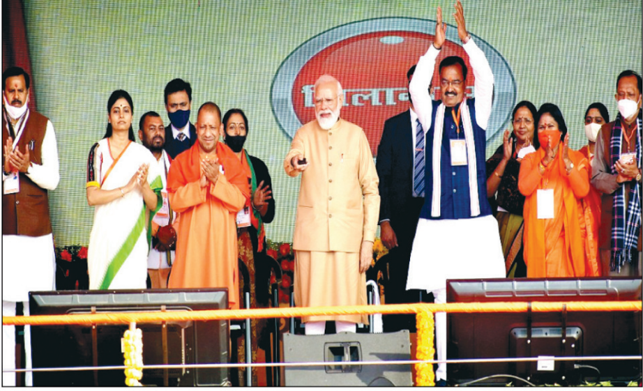
परेड मैदान में रिमोट दबाकर योजनाओं का शुभारंभ करते प्रधानमंत्री