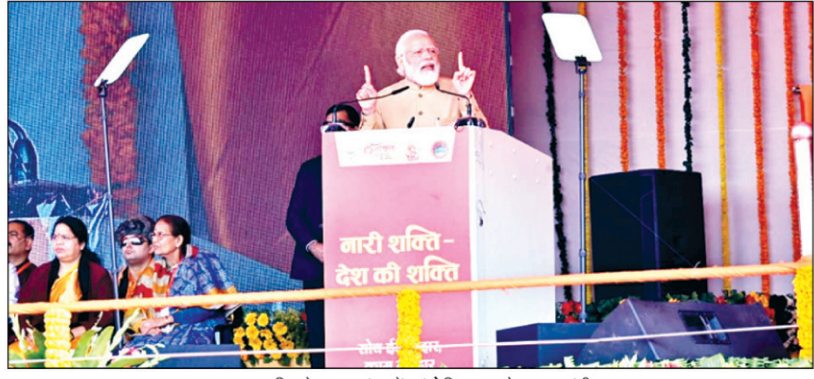
मातृशक्ति के महाकुंभ में संबोधित करते प्रधानमंत्री

प्रयागराज। प्रधानमंत्री नरेंद्र मोदी ने मंगलवार को प्रयागराज में मातृशक्ति के महाकुंभ कार्यक्रम में शिरकत की। तथा पीएम मोदी ने अपने भाषण की शुरुआत हमेशा की तरह लोगों के अभिवादन और स्थानीय भाषा में किया। वह बोले पिछले वर्ष कुंभ में हम ई पवित्र धरती पर आवा रहे, तब संगम में डुबकी लगाने के अलौकिक आनंद आवा रहा। पीएम ने कहा कि प्रयागराज से साहित्य की जो त्रिवेणी बही उसे आचार्य हजारी प्रसाद द्विवेदी संपादक भी रहे। हमारी मातृशक्ति की प्रतीक वह थीं नगरी मां गंगा यमुना और सरस्वती की संगम नगरी रही है। ये हमारा सौभाग्य है कि आप महिलाएं हमें आशीर्वाद दे आई हैं। वही पीएम मोदी ने मंच से बटन दबाकर 202 राजकीय पुष्पाहार प्लांट का उद्घाटन किया तथा लाखों महिलाओं के बैंक अकाउंट में भी पैसे ट्रांसफर किए। पीएम मोदी ने स्वयं सहायता समूह को 1000 करोड़ रुपये की राशि दी। पीएम मोदी ने कहा कि प्रयागराज हजारों सालों से हमारी मातृशक्ति की प्रतीक मां गंगा-यमुना-सरस्वती के संगम की धरती आज नारी-शक्ति के अद्भुत संगम को साक्षी बन रही है, महिलाओं के कल्याण के बिना समाज का कल्याण संभव नहीं है।