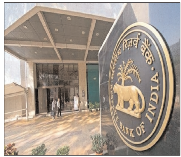
गवर्नर तीन दिवसीय मौद्रिक नीति समिति की समीक्षा बैठक के

मुंबई/नई दिल्ली। रिजर्व बैंक ऑफ इंडिया (आरबीआई) की मौद्रिक नीति समिति (एमपीसी) की वित्त वर्ष 2024-25 के लिए पहली समीक्षा बैठक बुधवार को शुरू हो गई। आरबीआई गवर्नर की अध्यक्षता में हो रही तीन दिवसीय एमपीसी बैठक के नतीजे पांच अप्रैल को आएंगे। हालांकि, अधिकांश अर्थशास्त्रियों का अनुमान है कि आरबीआई एक बार फिर रेपो रेट को यथावत रख सकता है। आरबीआई गवर्नर शक्तिकांत दास की अध्यक्षता में आज चालू वित्त वर्ष 2024-25 की पहली मौद्रिक नीति समिति की समीक्षा बैठक शुरू हुई। रिजर्व बैंक