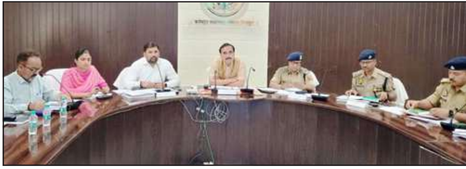
कमिश्नर-डीआईजी ने चुनाव बाबत डीएम-एसपी को दिये निर्देश

बुधवार को कलेक्ट्रेट ड्रट सभागार में हुई बैठक में आयुक्त ने कहा कि जो सेक्टर, जोनल मजिस्ट्रेट रिजर्व ईवीएम मशीन मतदान के दिन रखेंगे, अच्छी तरह से संभाल कर रखें। मतदान को पूर्व के रूप में मतदाता मनायें। स्वीप से प्रत्येक गांव में प्रचार-