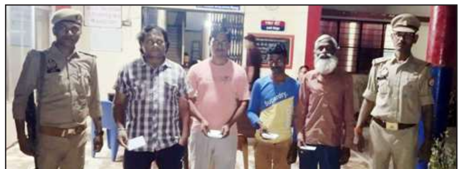
पुलिस गिरफ्त में जुआरी।