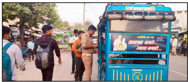
वाहनों को चेक करते टीएसआई।