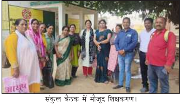
संकुल बैठक में मौजूद शिक्षकगण।

प्रतापगढ़। सदर विकास खंड के प्राथमिक विद्यालय चकवनतोड़ में आज संकुल बैठक आयोजित की गई। बैठक में निपुण भारत मिशन के अंतर्गत बुनियादी शिक्षा तथा सख्यात्मक ज्ञान की प्राप्ति हेतु टीएलएम के माध्यम से बच्चों को पढ़ाने एवं उनमें पढ़ाई के प्रति अभिरूचि पैदा करने की कला सिखाई गई। प्रभावी शिक्षण हेतु शिक्षकों ने कार्य योजना का निर्माण किया एवं अभ्यास हेतु आवश्यक पत्रक भी तैयार किया। जनपद स्तरीय कार्यशाला के उद्देश्यों के अनुरूप