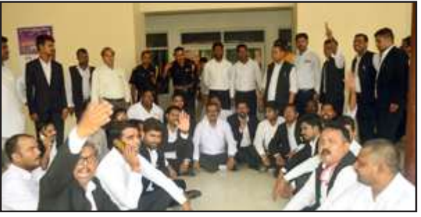
अस्पताल परिसर में धरना देते अधिवक्तागण।

प्रतापगढ़। राजकीय मेडिकल कालेज से सम्बद्ध प्रताप बहादुर अस्पताल में आज चिकित्सकों, उनके सहयोगियों व अधिवक्ताओं के बीच जमकर विवाद के बाद मारपीट होने से अस्पताल में अफरा-तफरी मच गई तथा अस्पताल का कामकाज ठप हो गया। अधिवक्ता के साथ मारपीट होने की खबर जिला कचहरी पहुंची, जहां अधिवक्ता पट्टी आउटलाइन कोर्ट को लेकर हड़ताल कर रहे थे, वहां से अधिवक्ता सीधे अस्पताल पहुंचे और धरने पर बैठ गये।