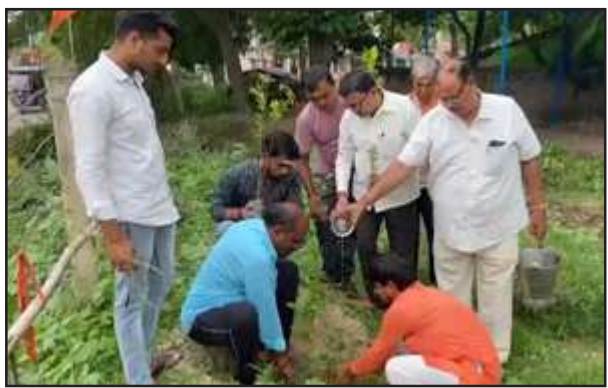
पौधरोपण करते एलायंस क्लब के पदाधिकारी।