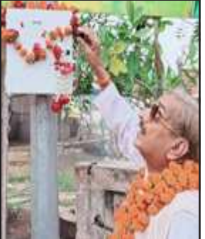
बाबा घुश्मेश्वरनाथ धाम में हाईमास्ट की सोगात सौंपते प्रमोद तिवारी।

लालगंज, प्रतापगढ़। राज्यसभा सांसद प्रमोद तिवारी ने कहा कि बाबा घुइसरनाथ धाम में पर्यटन विकास का हर पहलू सदैव जगमग दिखेगा। सांसद प्रमोद तिवारी ने सावन मास के दूसरे सोमवार की शाम घुइसरनाथ तिराहे पर हाईमास्ट लाइट की सोगात सौंपी तो मौजूद व्यापारियों व श्रद्धालुओं में खुशी चहक उठी। प्रमोद तिवारी ने कहा कि बाबा घुश्मेश्वरनाथ की प्रेरणा से ही रामपुर खास में विकास की गाथा लिखी जा रही है। इस मौके पर व्यापार मंडल अध्यक्ष