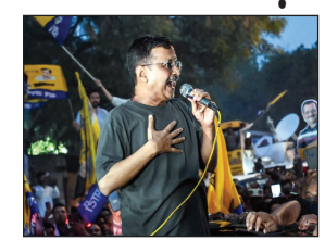
पेश किए जाने के बाद राउज एवेन्यू अदालत ने केजरीवाल को हिरासत बढ़ा दी। दिल्ली उत्पाद शुल्क नीति मामले में मनीष सिंसोदिया के बाद अब के कविता को भी जमानत मिल गई है। सुप्रीम कोर्ट ने दिल्ली उत्पाद शुल्क नीति मामले में बीआरएस एमएलसी के कविता को जमानत दे दी। अदालत ने मामले में की जा रही जांच की प्रकृति को लेकर सीबीआई और प्रवर्तन निदेशालय की खिंचाई की।

नई दिल्ली, आम आदमी पार्टी (आप) प्रमुख को पहले दी गई न्यायिक हिरासत की अवधि समाप्त होने पर एक वीडियो कॉन्फ्रेंस के माध्यम से अदालत में पेश किए जाने के बाद राउज एवेन्यू अदालत ने केजरीवाल को हिरासत बढ़ा दी। दिल्ली की एक अदालत ने कथित उत्पाद शुल्क नीति घोटाले के संबंध में सीबीआई द्वारा दर्ज मनी लॉन्ड्रिंग मामले में मंगलवार को मुख्यमंत्री अरविंद केजरीवाल को न्यायिक हिरासत 3 सितंबर तक बढ़ा दी। आम आदमी पार्टी (आप) प्रमुख को पहले दी गई न्यायिक हिरासत की अवधि समाप्त होने पर एक वीडियो कॉन्फ्रेंस के माध्यम से अदालत में