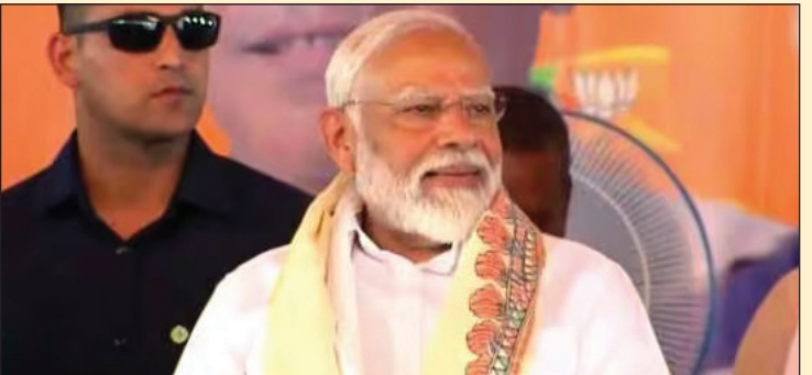
रिपोर्ट के अनुसार अब सत्ता के गलियारों में दो बड़े मुद्दों पर चर्चा हो रही है। ये मुद्दे अनिपथ योजना और जातिगत जनगणना है। विपक्ष इन मुद्दों को लेकर मोदी सरकार पर लगातार हमला कर रहा है। इसके अलावा एनडीए के सहयोगी दल भी इन मुद्दों पर मुखर हो रहे हैं। चिराग पासवान तो जातिगत जनगणना के पक्ष में खुल कर बोल रहे हैं। वहीं, रक्षा मंत्री राजनाथ सिंह भी कई मौकों पर यह कह चुके हैं सरकार

की रिपोर्ट के अनुसार सरकार से जुड़े लोगों का कहना है कि सरकार की तरफ से यह कदम जनता की प्रतिक्रिया के प्रति जागरूक होने के का प्रतीक है। साथ ही सरकार कांग्रेस की रणनीति को ध्वस्त करती जा रही है। बीजेपी में कई लोगों का मानना है कि यह लोकसभा चुनावों में जीत के बाद पॉलिटिकल नैरेटिव को फिर से अपने पक्ष में करने का हिस्सा है। इसके अलावा पीएम मोदी की तरफ से दिखाई गई राजनीतिक व्यावहारिकता का एक उदाहरण है। जाति का जिक्र किए बिना अपमान एक्ससी-एक्टो एक्ट के दायरे में नहीं, सुप्रीम कोर्ट ने बताया कब किस अपराध में लागू होगा कानून अनिपथ, जातिगत जनगणना पर बड़ा फैसला