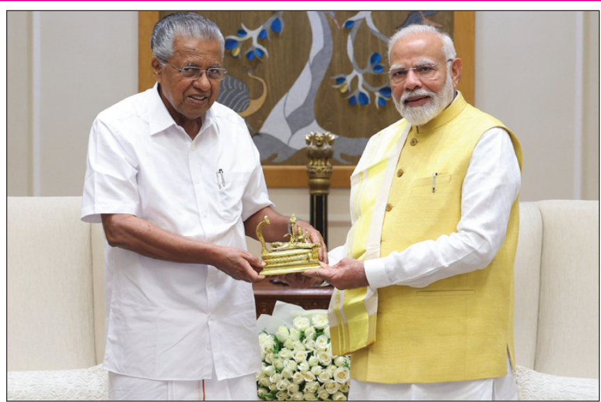
केरल के मुख्यमंत्री श्री पिनाराई विजयन ने आज प्रधानमंत्री श्री नरेन्द्र मोदी से मुलाकात करते हुए।

विश्व निर्माण एवं मानव विकास को द्रुतगति प्रदान करने हेतु क्रियायोग आश्रम एवं अनुसंधान आश्रम की अनुपम भेंट