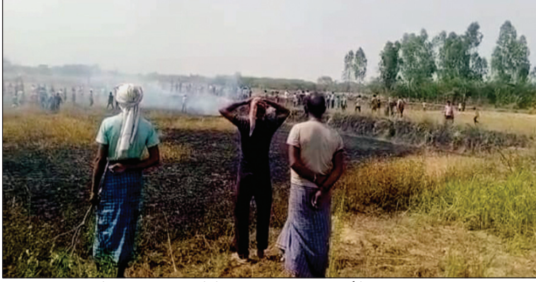
गेहूं की फसल जलने के बाद मायूस किसान व मौके पर जुटी भीड़