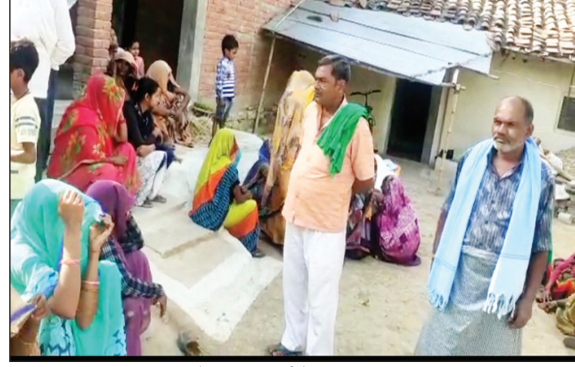
हत्या के बाद बुजुर्ग के घर छाया मातम