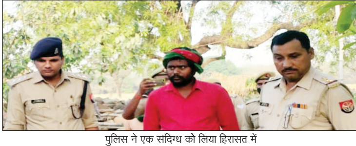
पुलिस ने एक संदिग्ध को लिया हिरासत में