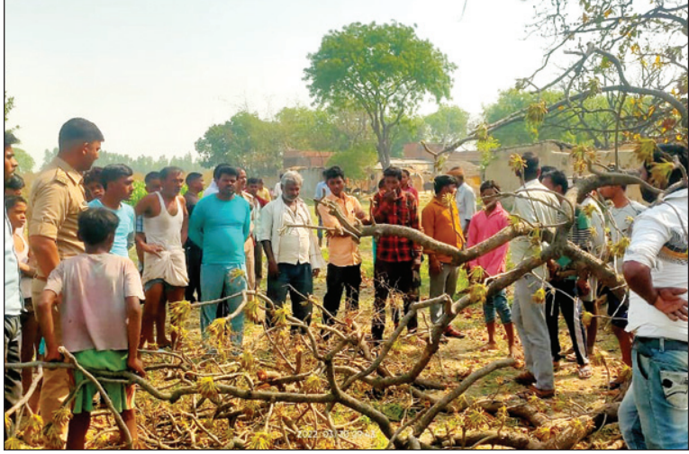
हादसे के बाद घटनास्थल पर एकत्रित ग्रामीणों की भीड़ और जांच करती पुलिस