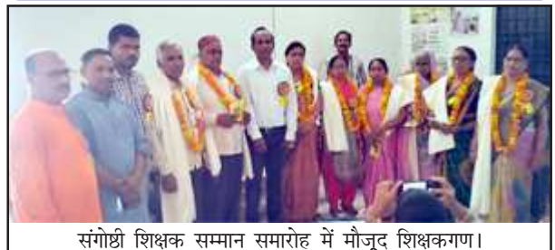
संघोष्ठी शिक्षक सम्मान समारोह में मौजूद शिक्षकगण।

मौके पर ब्लाक के विभिन्न स्कुलों से तीस मार्च को रिटायर हुए हेडमास्टर, सहायक अध्यापक और अनुचर समेत आठ कर्मचारियों का