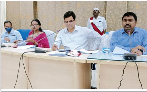
गो संरक्षण केन्द्र के संबंध में बैठक करते जिलाधिकारी

दिये उन्होंने कहा कि जिन गोशालाओं में मरम्मत के कार्य कराये जाने हैं उन गोशालाओं में मरम्मत के कार्य शीघ्र प्रारम्भ कर पूर्ण किया जाय। उन्होंने निर्माणधीन अस्थायी गोशालाओं की प्रगति की विस्तृत समीक्षा करते हुए निर्माण कार्य में प्रगति लाने के निर्देश देते हुए कहा कि जिन गोशालाओं के लिए भूमि चिन्हित नहीं हुई है, उन गोशालाओं के निर्माण हेतु भूमि