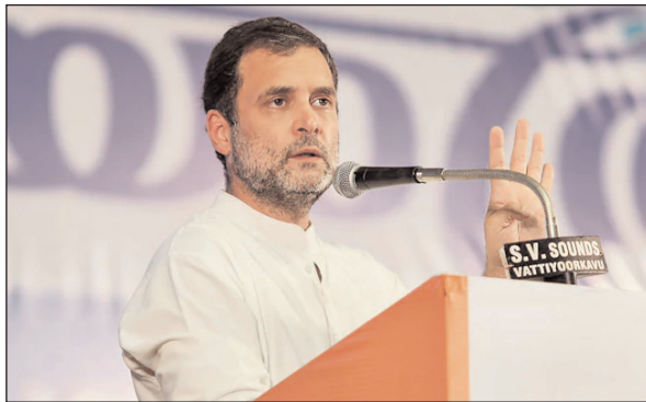
आती है इस सरकार का जनता के हितों से कोई वास्ता नहीं है। उल्लेखनीय है कि मंगलवार को यूपी कांग्रेस ने भी पेट्रोल, डीजल

नई दिल्ली: कांग्रेस के पूर्व राष्ट्रीय अध्यक्ष राहुल गांधी ने कहा कि केन्द्र की मोदी सरकार को किसानों, युवाओं और आम लोगों के हितों की परवाह नहीं है। कांग्रेस सांसद राहुल गांधी ने बुधवार को ट्वीट कर कहा कि आए दिन पेट्रोल, डीजल और रसोई गैस के दाम बढ़ रहे हैं। महंगाई चरम पर है। युवाओं को रोजगार नहीं मिल रहा है और किसानों को सिर्फ सपने दिखाए जा रहे हैं। राहुल ने कहा कि मोदी सरकार सिर्फ सरकारी कंपनियों को बेचने के बारे में ही चिंतित नजर