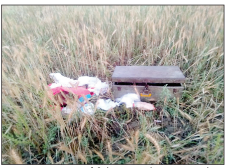
चोरी के बाद घर के बाहर व घर के अंदर अस्त-व्यस्त बिखरा पड़ा मिला सामान