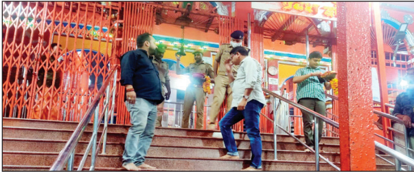
मंदिर का निरीक्षण कर वापस लौटते पुलिस अधीक्षक

का जमावड़ा लगता है जिससे भीड़ के साथ-साथ वाहनों का लंबा जाम लग जाता है भीड़ और वाहनों के लंबे जाम की व्यवस्था को लेकर पुलिस अधीक्षक ने अभी से अधीनस्थों को निर्देश दे दिए हैं। जानकारी की मुताबिक आगामी नवरात्रि पर्व के दृष्टिगत पुलिस अधीक्षक हेमराज मीणा द्वारा मां शीतला मंदिर कड़ाधाम का