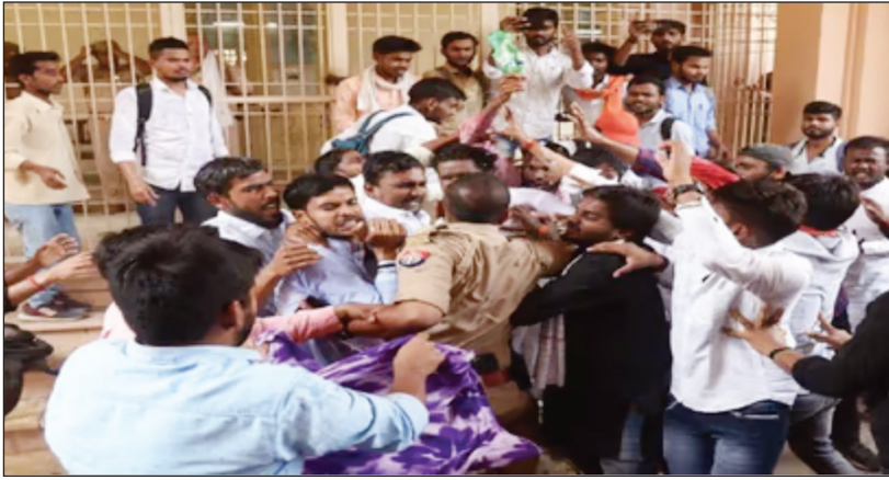
आत्मदाह का प्रयास करते विश्वविद्यालय के छात्र