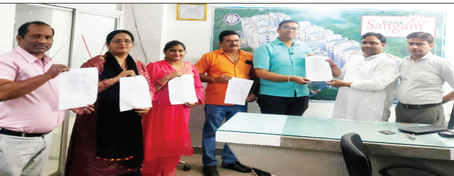
निर्वाचन अधिकारी द्वारा प्रणाम-पत्र प्राप्त करते हुए पदाधिकारी