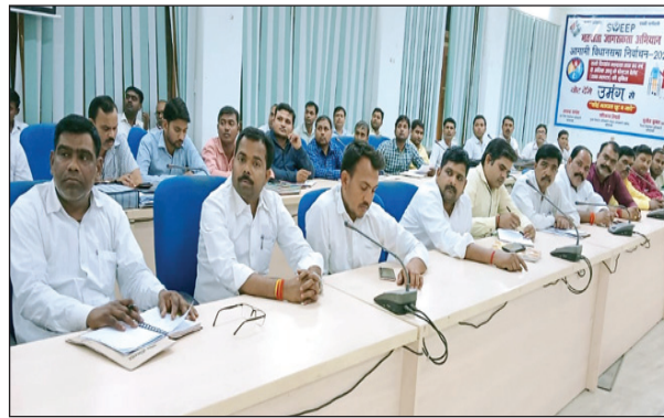
गो संरक्षण केन्द्र की बैठक में उपस्थित ब्लाक प्रमुख पंचायत सेक्रेटरी ग्राम प्रधान पशु चिकित्सा अधिकारी व अन्य

चिन्हान कर दिया जाय जिलाधिकारी ने गोशालाओं के निर्माण हेतु कार्यवाही न करने लापरवाही बरतने पर बीडीओ कौशाम्बी को प्रतिकूल प्रविष्टि देने के निर्देश दिये। उन्होंने अस्थायी गोशालाओं के निर्माण सहित आदि कार्यों में लापरवाही बरतने वाले सचिव, ग्राम पंचायत को प्रतिकूल प्रविष्टि, सम्बन्धित प्रधान को नोटिस तथा बीडीओ को चेतावनी