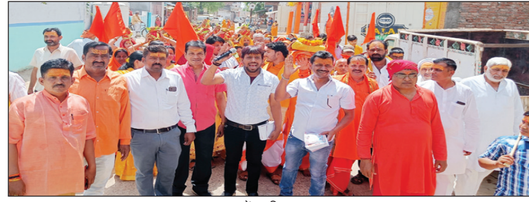
कलश यात्रा में शामिल पुरुष श्रद्धालु