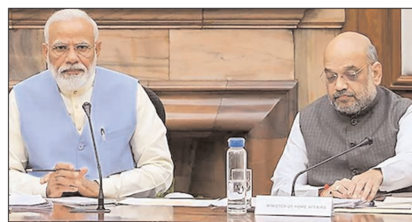
एमएसएमई से जुड़े कार्यक्रम के लिए 6,062 करोड़ की मंजूरी

नई दिल्ली: प्रधानमंत्री नरेंद्र मोदी के नेतृत्व में सुरक्षा मामलों की कैबिनेट समिति ने बुधवार को 15 हल्के लड़ाकू हेलीकाप्टरों की लिमिटेड सीरिज प्रोडक्शन के तहत खरीद को मंजूरी दी। इस पर 3,887 करोड़ रुपये की लागत आने का अनुमान है। इन हेलीकाप्टरों के रखरखाव के लिए इंफ्रास्ट्रक्चर डेवलपमेंट को लेकर 377 करोड़ रुपये मंजूर किए गए हैं। हाल ही में भारतीय सेना ने 3,387 टीआरजी-42 स्नाइपर राइफलों से अपने जवानों को लैस करना शुरू कर दिया है। फिनलैंड से आयातित यह राइफलों नियंत्रण रेखा पर तैनात सेना के जवानों को दी जा रही है। बताया जाता है कि साको स्नाइपर राइफल पाकिस्तानी सैनिकों द्वारा इस्तेमाल की जा रही स्नाइपर राइफल से हर मामले में आगे है। इस राइफल से लैस