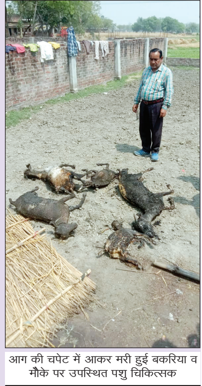
आग की चपेट में आकर मरी हुई बकरिया व मौके पर उपस्थित पशु चिकित्सक