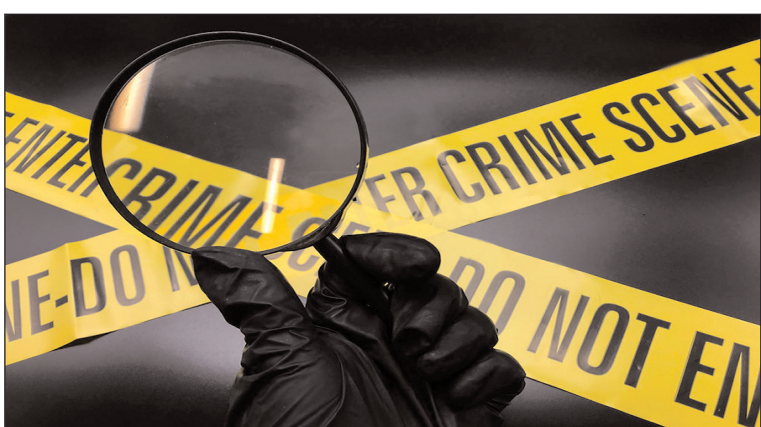
: इस बिल में गिरफ्तार किए गए किसी व्यक्ति के निजी बायोलाजिकल डाटा इकट्ठा करने की छूट देता है। इसमें पुलिस को अंगुलियों, पैरों, हथेलियों के निशान, रेटिना स्कैन, अपराधी में सजा मिली है।

नई दिल्ली: सरकार ने लोकसभा में दंड प्रक्रिया पहचान विधेयक, 2022 पेश कर दिया है। इस बिल के कानूनी रूप लेने के बाद पुलिस के पास गिरफ्तार व्यक्ति से संबंधित सभी तरह की सूचना से लेकर रेटिना, पैरों के प्रिंट जुटाने और ब्रेन मैपिंग तक करने का अधिकार होगा। विपक्ष इसे मौलिक अधिकारों का हनन बता रहा है। जब गृह राज्य मंत्री अजय मिश्र ने ये बिल लोकसभा में पेश किया तो विपक्ष ने इसके विरोध में जमकर हंगामा किया। आखिर बिल में कौन-कौन से प्रवधान हैं लागू होने पर ये कानून किन लोगों पर लागू होगा ये डेटा किस तरह से संग्रहित किया जाएगा विपक्ष इसका किस आधार पर विरोध कर रहा है