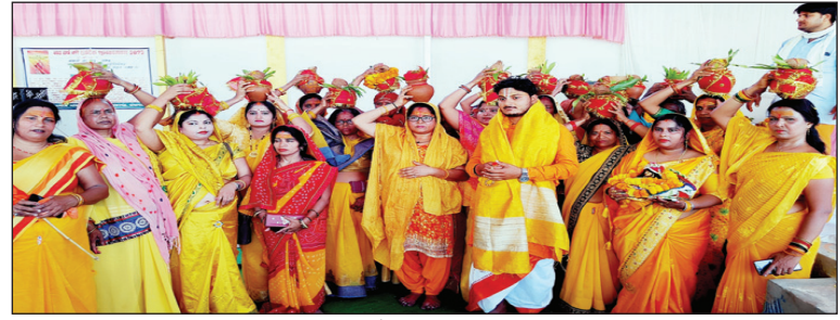
कलश यात्रा में शामिल महिला श्रद्धालु