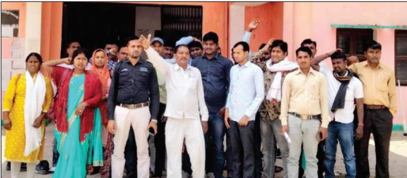
प्रदर्शन करते रोजगार सेवक

प्रयागराज। विकास खंड मऊआइमा में रोजगार सेवकों को मानदेय न मिलने से आक्रोशित होकर खंड विकास अधिकारी को ज्ञापन दिया गया जबकि विकास खंड मऊआइमा अधिकारी द्वारा ए पीओ को मानदेय देने को आदेशित किया गया था कि रोजगार सेवकों को मानदेय दे दिया जाए, लेकिन विकासखंड मऊआइमा में तैनात ए पी ओ की मनमानी के चलते से नहीं मिल पा रहा है रोजगार सेवकों का मानदेय जिसको लेकर रोजगार सेवकों द्वारा विकासखंड मऊआइमा परिसर में भूख हड़ताल तालाबंदी तथा हंगामा काटा गया, जिसमें बी डी ओ मऊआइमा से बात करने पर बी डी ओ मऊआइमा के द्वारा बताया गया आज रोजगार सेवकों को मानदेय दे दिया जाएगा, और ए पी ओ की लापरवाही बड़ी देखने को मिल रही है जहां ए पी ओ के द्वारा आवास की मजदूरी का