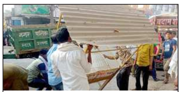
सड़क पर हुए अतिक्रमण को ट्रैक्टर पर लादते सफाई कर्मी।

फिर क्या था, जिन व्यापारियों ने अपनी दुकानें बचा ली थी, उन्हें हटाया गया तथा व्यापारियों को चेतावनी दी गई कि भविष्य में ऐसे व्यापारियों पर जुर्माना लगेगा। टेले