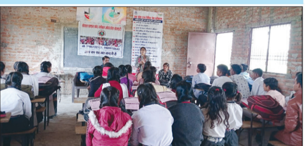
विधिक साक्षरता शिविर में उपस्थित लोग