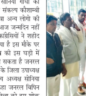
जनरल की मौत पर श्रद्धांजलि अर्पित करते कांग्रेसी