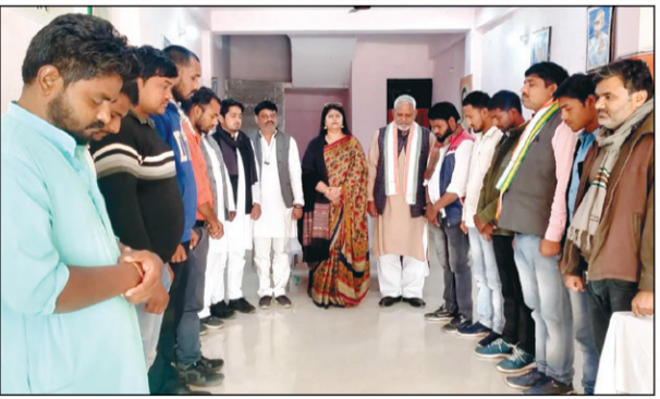
जनरल की मौत पर श्रद्धांजलि अर्पित करते कांग्रेसी नेता

कांग्रेस पार्टी कार्यालय में मौन रखकर शहीद सैनिकों को दी श्रद्धांजलि