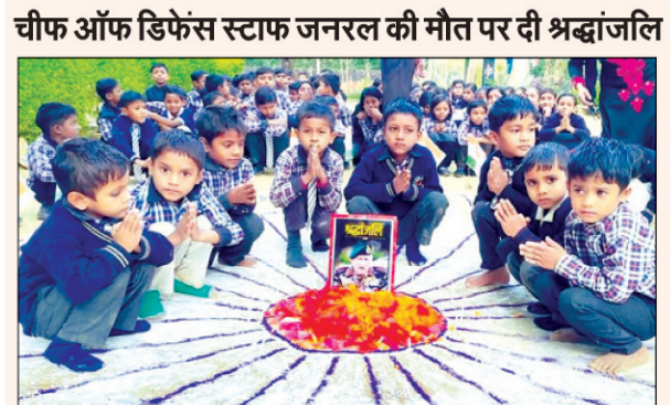
चीफ ऑफ डिफेंस स्टाफ जनरल की मौत पर दी श्रद्धांजलि