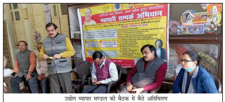
उद्योग व्यापार मण्डल की बैठक में बैठे अतिथिगण