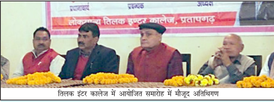
तिलक इंटर कालेज में आयोजित समारोह में मौजूद अतिथिगण