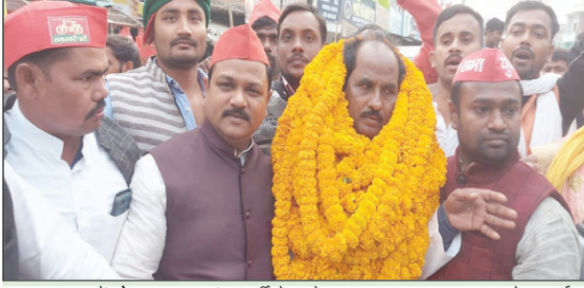
फूलपुर में गोड़वाना गणतंत्र पार्टी के प्रदेश अध्यक्ष का स्वागत करते सपाई