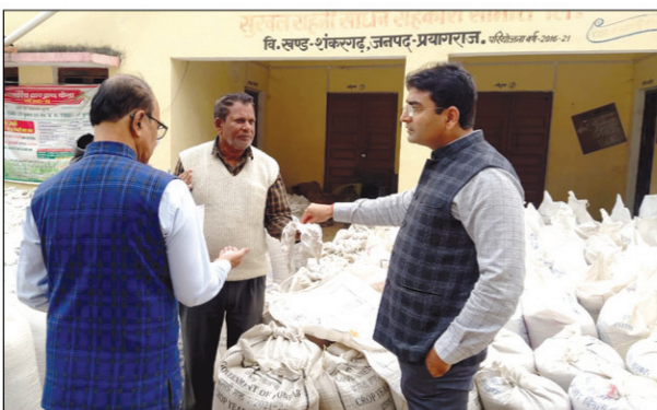
धान क्रय केंद्र पर जिलाधिकारी पूछताछ करते व जानकारी लेते