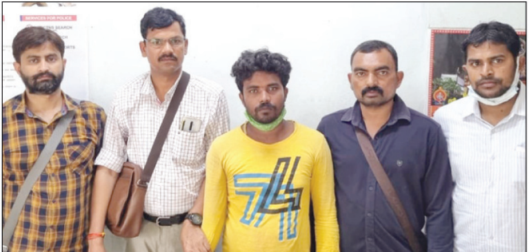
पुलिस के गिरफ्त में जाली नोट तस्कर जाली नोट तस्कर