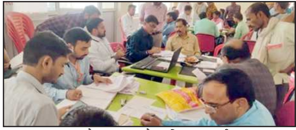
लोक अदालत में उपस्थित वादकारी।

कौशांबी। जनपद न्यायालय में उत्तर प्रदेश राज्य विधिक सेवा प्राधिकरण के निर्देश पर जिला विधिक सेवा प्राधिकरण के तत्वावधान एवम जिला विधिक सेवा प्राधिकरण अध्यक्ष/जनपद न्यायाधीश के निर्देशन में राष्ट्रीय लोक अदालत का आयोजन किया गया। राष्ट्रीय लोक अदालत में जनपद न्यायाधीश द्वारा 02 वादों का निस्तारण किया गया, मोटर दावा दुर्घटना से संबंधित 27 वादों का निस्तारण कर प्रतिरूप के रूप में 67,75,000 रुपए दिलाए गए। प्रधान न्यायाधीश परिवार न्यायालय द्वारा 52 पारिवारिक वादों का निस्तारण किया गया। अपर जनपद न्यायाधीश प्रथम द्वारा 07 वादों का निस्तारण कर 2500 रुपए अर्थदंड वसूला गया, अपर जनपद न्यायाधीश/विशेष