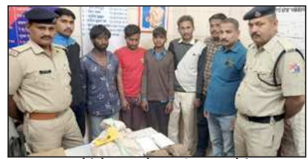
चोरी के सामान के साथ गिरफ्तार आरोपी।