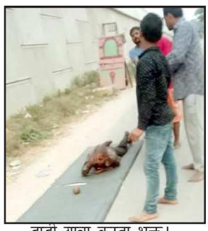
दांडी यात्रा करता भक्त।

कल्यानपुर कौशांबी। कड़े वासिनी मां शीतला की महिमा न्यारी है जिस भक्त ने सच्चे मन से माता से जो भी मांगा है उसकी इच्छा मा शीतला ने जरूर पूरी की है मां के दरबार में भक्तों की प्रतिदिन भीड़ लगी रहती है संतान सुख से वंचित एक दंपति ने मां शीतला के चरणों में नमन कर संतान सुख की मांग की थी जिस पर उनके घर के आंगन में किलकारी गूंजने लगी थाना कोखराज के मूरतगंज पक्का तालाब से मां शीतला धाम कड़ा