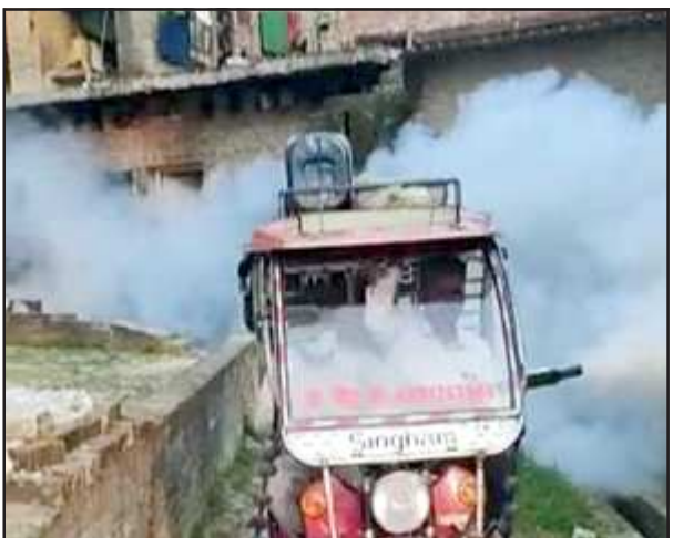
काशीपुर गाँव में फागिंग करते कर्मचारी।