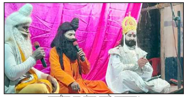
रामलीला का मंचन करते कलाकार।

कौशांबी। सराय अकिल के चित्तापुर गांव में स्थानीय आदर्श रामलीला समिति के तत्वाधान में वर्षों पुरानी रामलीला का मंचन राम जन्म नारद मोह व रावण तपस्या की लीला के साथ गांव में अनेक वर्षों से गणेश चतुर्थी के बाद ही रामलीला का आयोजन शुरू किया जाता है। जिसमें इसी तरह नारद मोह, राम जन्मोत्सव की लीला के साथ इस वर्ष की राम लीला प्रारंभ की गई। जिसमें स्थानीय आदर्श रामलीला में स्थानीय कलाकारों के शानदार जीवंत अभिनय ने दर्शकों का दिल जीत लिया। वहीं लीला में राम जन्म की खुशी में श्रद्धालु झूम उठे।