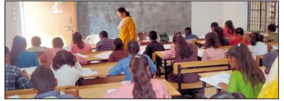
जीजीआईसी में परीक्षा देते परीक्षार्थीगण।

शहर के दो परीक्षा केन्द्रों पर हुई परीक्षा में 98 रहे अनुपस्थित