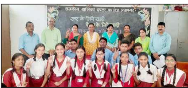
प्रतियोगिता के दौरान मौजूद शिक्षकगण व छात्राएं।