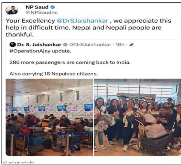
जानकारी दी थी। नेपाल के विदेश मंत्री ने एक्स पर लिखा

नेपाल के विदेश मंत्री एनपी साउद ने भारतीय विदेश मंत्री डॉ. एस जयशंकर को संबोधित करते हुए ऑपरेशन अजय के तहत नेपाली नागरिकों की सुरक्षित वापसी पर आभार व्यक्त किया है। सोशल मीडिया एक्स पर भारतीय विदेश मंत्री के उस पोस्ट पर नेपाल के विदेश मंत्री ने धन्यवाद दिया है, जिसमें उन्होंने नेपाली नागरिकों को इजरायल से दिल्ली लाने की