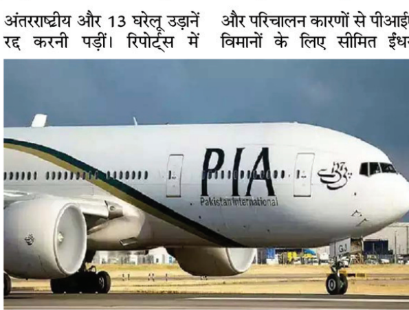
पीआईए के प्रवक्ता के हवाले से कहा गया है कि दैनिक आधार पर

मीडिया रिपोर्ट्स के मुताबिक पीआईए को मंगलवार को भी 11