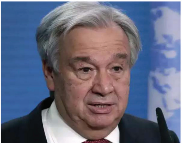
पहुंचे थे, तो उसी समय उन्होंने महासचिव गुटेरस को नेपाल आने का निमंत्रण दिया था।

काठमांडू। संयुक्त राष्ट्र संघ के महासचिव एन्टोनियो गुटेरस 29 अक्टूबर से चार दिवसीय नेपाल दौरे पर काठमांडू पहुंच रहे हैं। प्रधानमंत्री पुष्पकमल दाहाल 'प्रचंड' के निमंत्रण पर महासचिव गुटेरस काठमांडू में उच्च स्तरीय राजनीतिक मुलाकात करने के अलावा कई कार्यक्रमों में हिस्सा लेंगे। इससे पहले महासचिव गुटेरस की नेपाल यात्रा 13-16 अक्टूबर तक तय थी, लेकिन