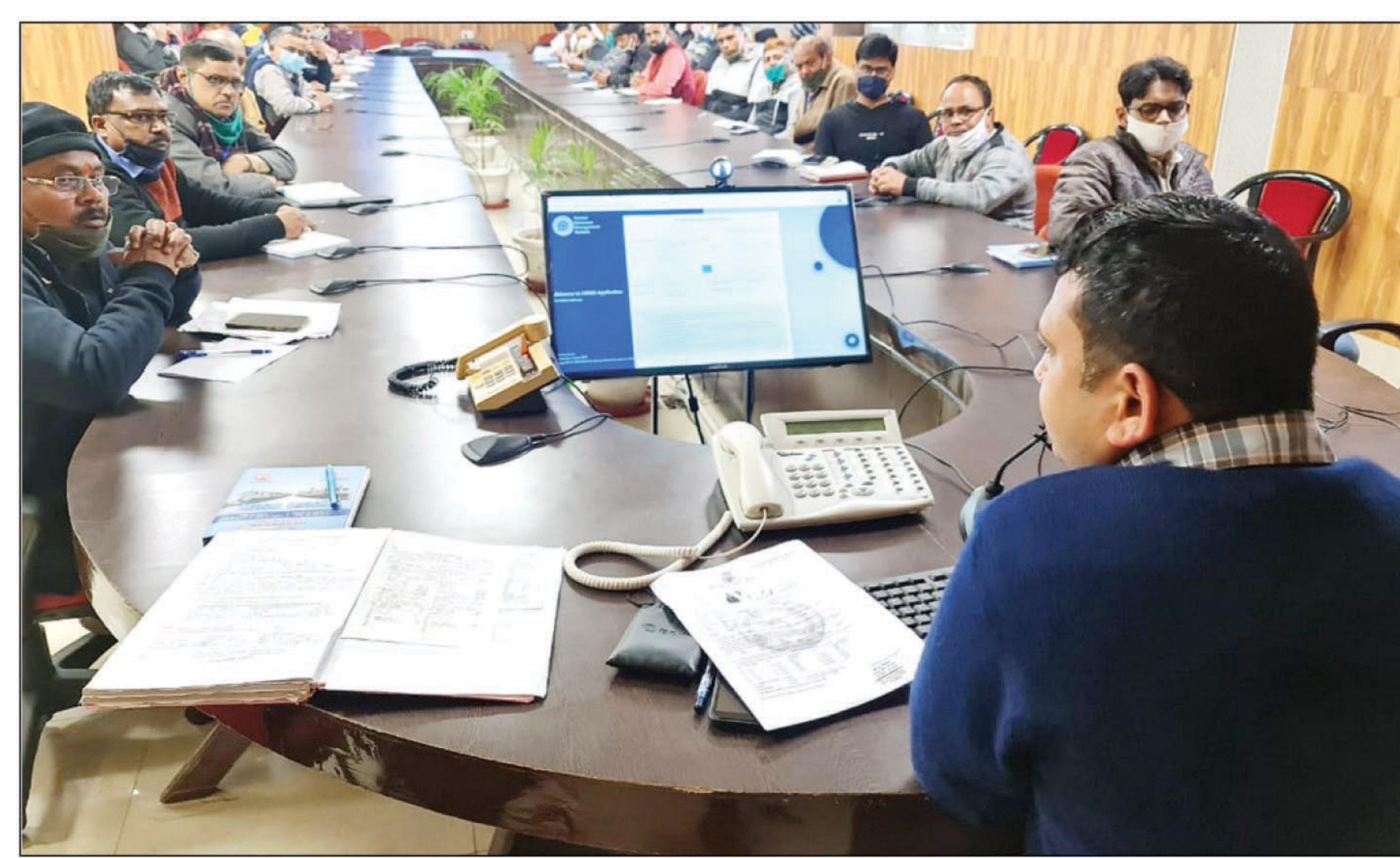
प्रशिक्षण कार्यक्रम में उपस्थित सेवानिवृत्त कर्मचारी व सेवारत कर्मचारी

प्रयागराज। उत्तर मध्य रेलवे, प्रयागराज मंडल के कार्मिक विभाग के प्रयासों के फलस्वरूप अब सेवानिवृत्त रेल कर्मचारी घर बैठे ले सकेंगे सुविधा पास की सुविधा। कार्यरत कार्मिकों के साथ साथ कार्मिक विभाग ने इस सुविधा को प्रयागराज मण्डल के 23876 सेवानिवृत्त रेल कर्मचारियों तक पहुंचाना प्रारम्भ कर दिया गया है। गुरुवार को प्रयागराज मण्डल से सभागार में आयोजित प्रशिक्षण कार्यक्रम के दौरान 15 से अधिक सेवानिवृत्त कर्मचारियों एवं 40 सेवारत कर्मचारियों को इस सिस्टम को प्रयोग करने की ट्रेनिंग दी गई। इस सिस्टम के माध्यम से कोई भी सेवानिवृत्त कर्मचारी अपने घर से ही पास की सुविधा ले सकता है, उसे किसी भी कार्यालय में आने की आवश्यकता नहीं होगी। इस सिस्टम की जानकारी प्रयागराज मण्डल के सभी सेवानिवृत्त