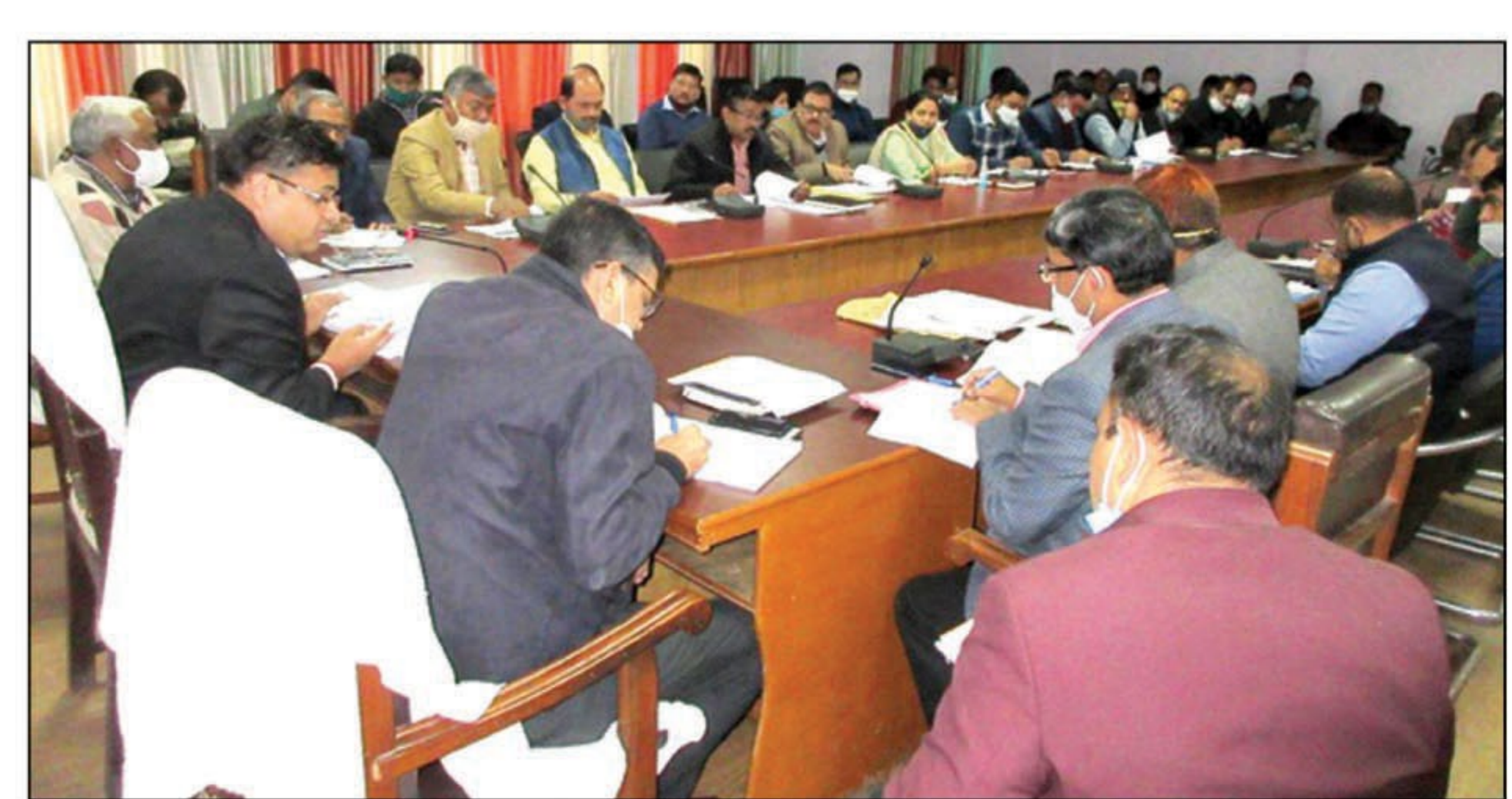
कार्यदायी संस्था के लोगों के साथ समीक्षा बैठक करते जिलाधिकारी

प्रतापगढ़। जिलाधिकारी डा0 नितिन बंसल की अध्यक्षता में कल सांघकाल विकास भवन के सभागार में अधिकारियों एवं कार्यदायी संस्थाओं के प्रतिनिधियों के साथ जनपद में 50 लाख से ऊपर के निर्माण कार्यों की समीक्षा की। उन्होंने समीक्षा के दौरान कार्यदायी संस्थाओं एवं अधिकारियों को निर्देशित करते हुये कहा कि जिन परियोजनाओं के निर्माण कार्य में गुणवत्ता खराब पायी जायेगी तो सम्बन्धित कार्यदायी संस्था एवं अधिकारियों का उत्तरदायित्व निर्धारित करते हुये सम्बन्धित के विरुद्ध प्राथमिकी दर्ज करायी जायेगी। समीक्षा के दौरान जिलाधिकारी ने मुख्य विकास अधिकारी को निर्देशित किया कि आई0टी0आई0 लालमंज का निर्माण कार्य जो कार्यदायी संस्था आवास विकास परिषद द्वारा कराया गया है उसकी तकनीकी जांच हेतु कमेटी गठित कर जल्द से जल्द जांच करायी जाये, यदि जांच में मानक विहीन कार्य एवं अनियमितता पायी जाती है तो सम्बन्धित के विरुद्ध कार्यवाही की जाये। सेतु निगम की समीक्षा के दौरान बताया गया कि जनपद में कुल 11 सेतु बनने थे जिसमें