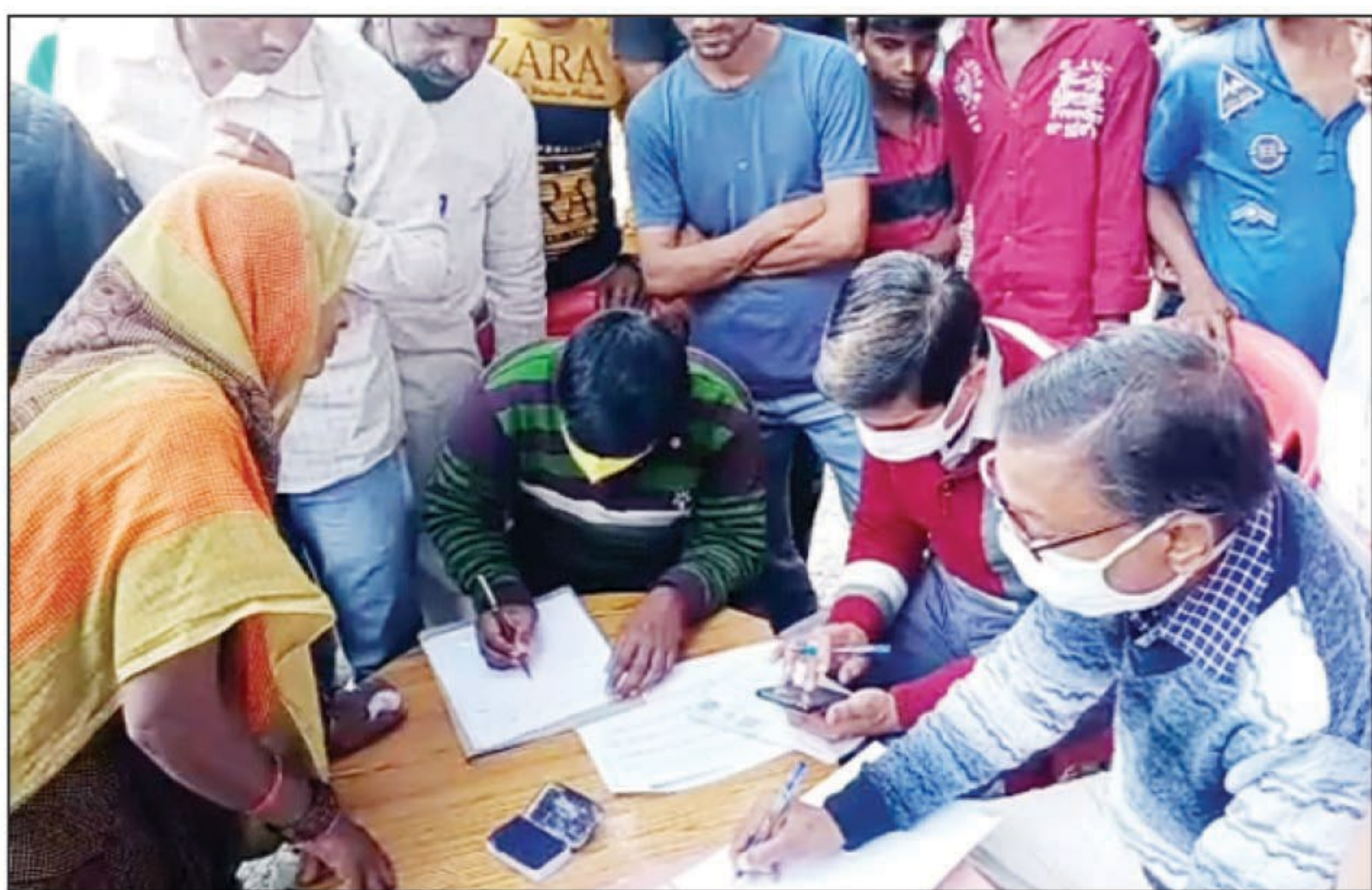
जांच करते आपूर्ति निरीक्षक

हडिया। हडिया तहसील क्षेत्र के बेल्हा (सिंघमऊ) के कोटेदार पर पूरे गांव के लोगों ने आरोप लगाया कि 3 महीने का राशन अक्टूबर-नवंबर दिसंबर का कोटेदार द्वारा अंगूठा लगवाने के बाद नहीं दिया गया। जिसकी शिकायत गांव के लोगों ने उपजिलाधिकारी हडिया से की जिस पर उप जिलाधिकारी हडिया द्वारा आपूर्ति निरीक्षक को जांच का आदेश दिया। जांच में गड़बड़ी पाए जाने पर आपूर्ति निरीक्षक द्वारा दिनांक 6-12-2020 को सरकारी गल्ला की दुकान को सील कर दिया गया। 24 घंटे भी नहीं बिते थे कि दबंग कोटेदार ने अधिकारियों की मिलीभगत से सील सरकारी गल्ले की दुकान खुलवा लिया। गांव के लोगों ने जिसकी शिकायत पुनः उच्च अधिकारियों से की जिस पर पुनः जांच करने गुरुवार को टीम बेल्हा सिंघमऊ गांव पहुंची।