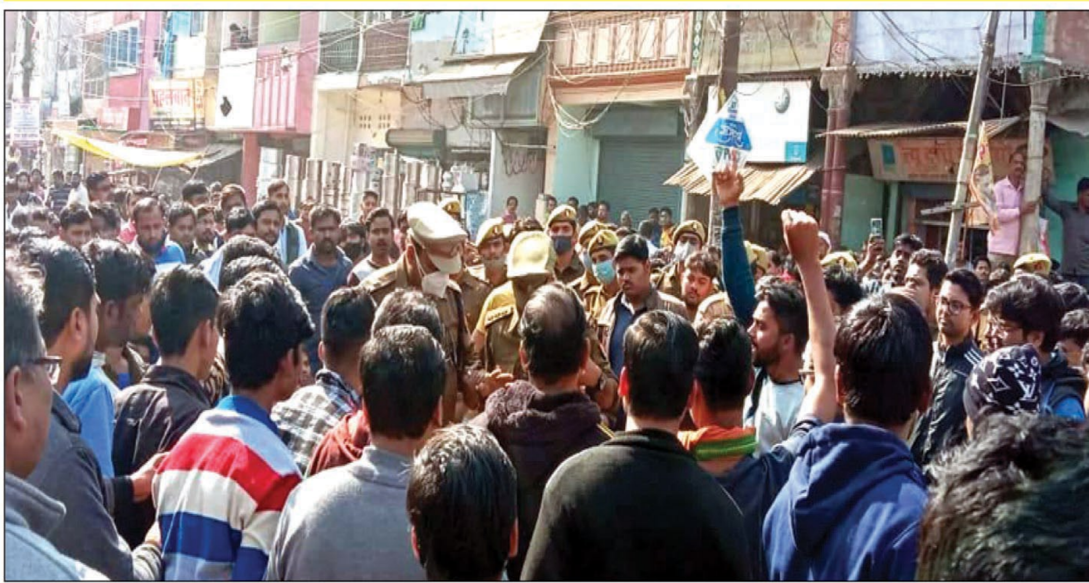
नगर में ज्वैलर्स के साथ लूट से आक्रोशित व्यापारी व शहरी