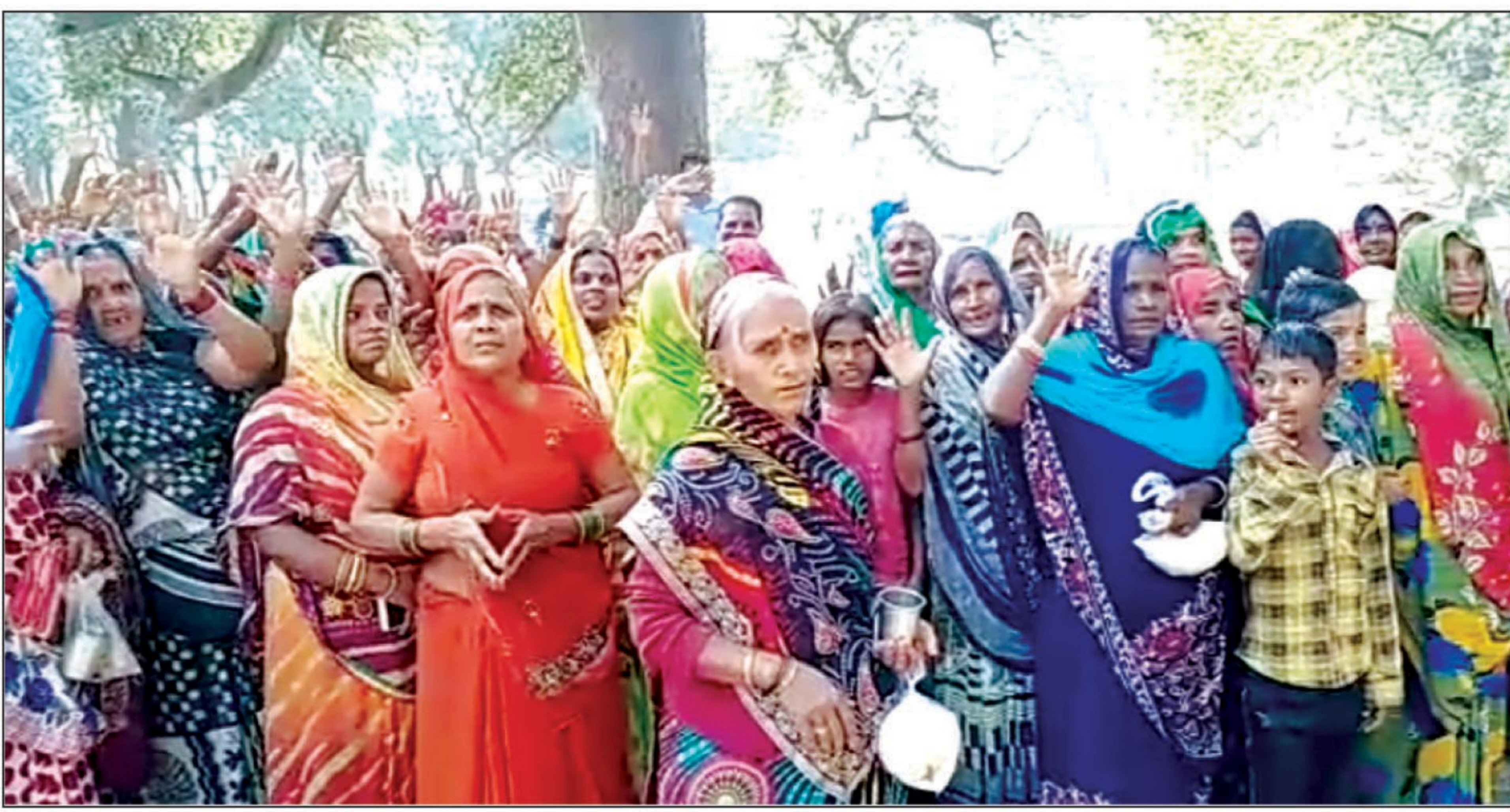
कोटेदार के खिलाफ कार्रवाई की मांग करते कार्ड धारक

देखा जाए तो सरकार किसी एक गरीब को राशन मिलने से ना छूट जाए यह योजना का लाभ पहुंचा रही है। वहीं दबंग कोटेदार द्वारा पूरे गांव का राशन 3 महीने का बेच दिया जाए और अधिकारी मौन रहे तो सवाल