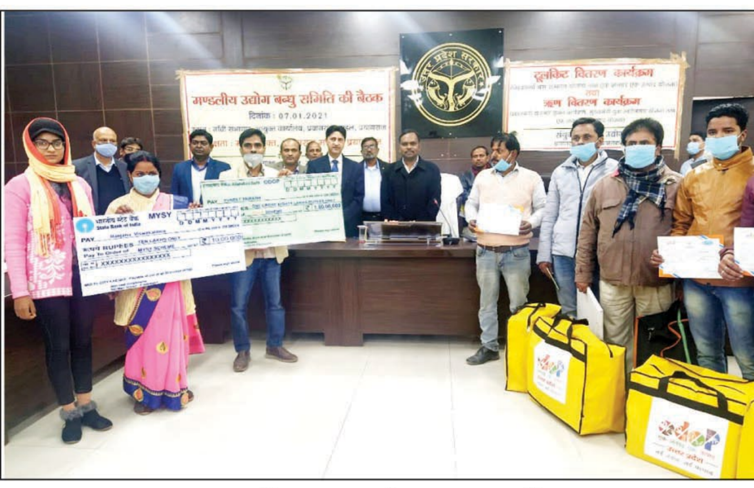
टूलकिट व ऋण के साथ लाभार्थी

विश्वकर्मा श्रम सम्मान योजना तथा एक जनपद एक उत्पाद योजना के अन्तर्गत मण्डल के 15 लाभार्थियों को टूल किट का किया गया वितरण