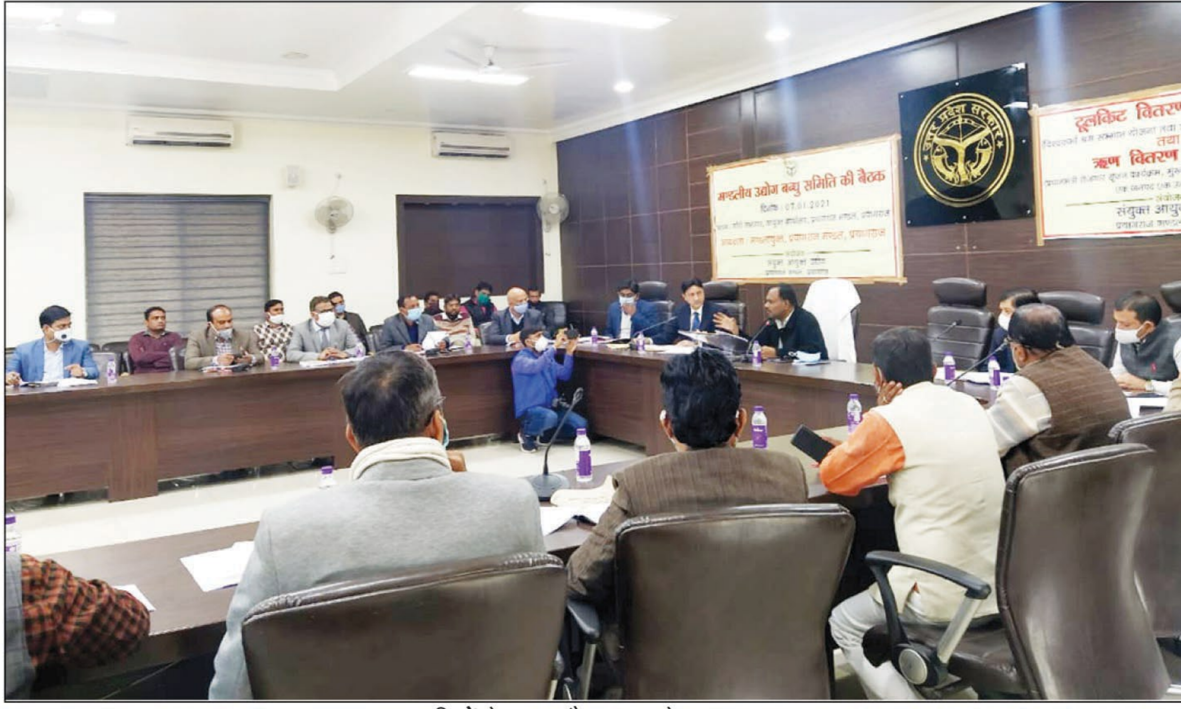
उद्यमियों के साथ बैठक करते मण्डलायुक्त

प्रयागराज। मण्डलायुक्त आर० रमेश कुमार की अध्यक्षता में गुरुवार को मण्डलीय उद्योग बन्धु की बैठक गांधी सभागार में सम्पन्न हुई। बैठक में वर्ष 2020-21 में मण्डल के अधीनस्थ जनपदों द्वारा माहवार आयोजित जिला उद्योग बन्धु की बैठकों की समीक्षा करते हुए सभी उपायुक्तों उद्योग प्रयागराज मण्डल को निर्देशित किया गया कि प्रत्येक माह जिलाधिकारी की अध्यक्षता में जिला उद्योग बन्धु की बैठकों का नियमित आयोजन करते हुए प्राप्त समस्याओं का निस्तारण गुणवत्तापूर्ण रूप से समय से कराना सुनिश्चित करे। विभाग द्वारा संचालित स्वरोजगारपरक योजनाएं प्रधानमंत्री रोजगार सृजन कार्यक्रम, मुख्य युवा स्वरोजगार योजना तथा एक जनपद एक उत्पाद वित्त पोषण योजनाएं