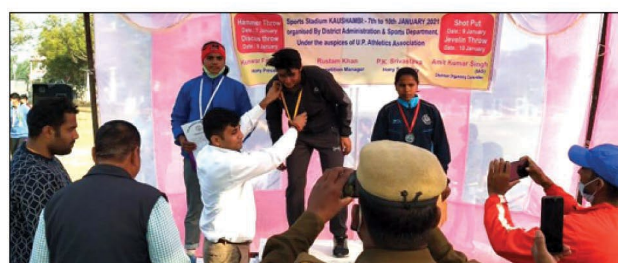
एथलेटिक्स प्रतियोगिता में विजयी प्रतिभागियों को मेडल पहनाते