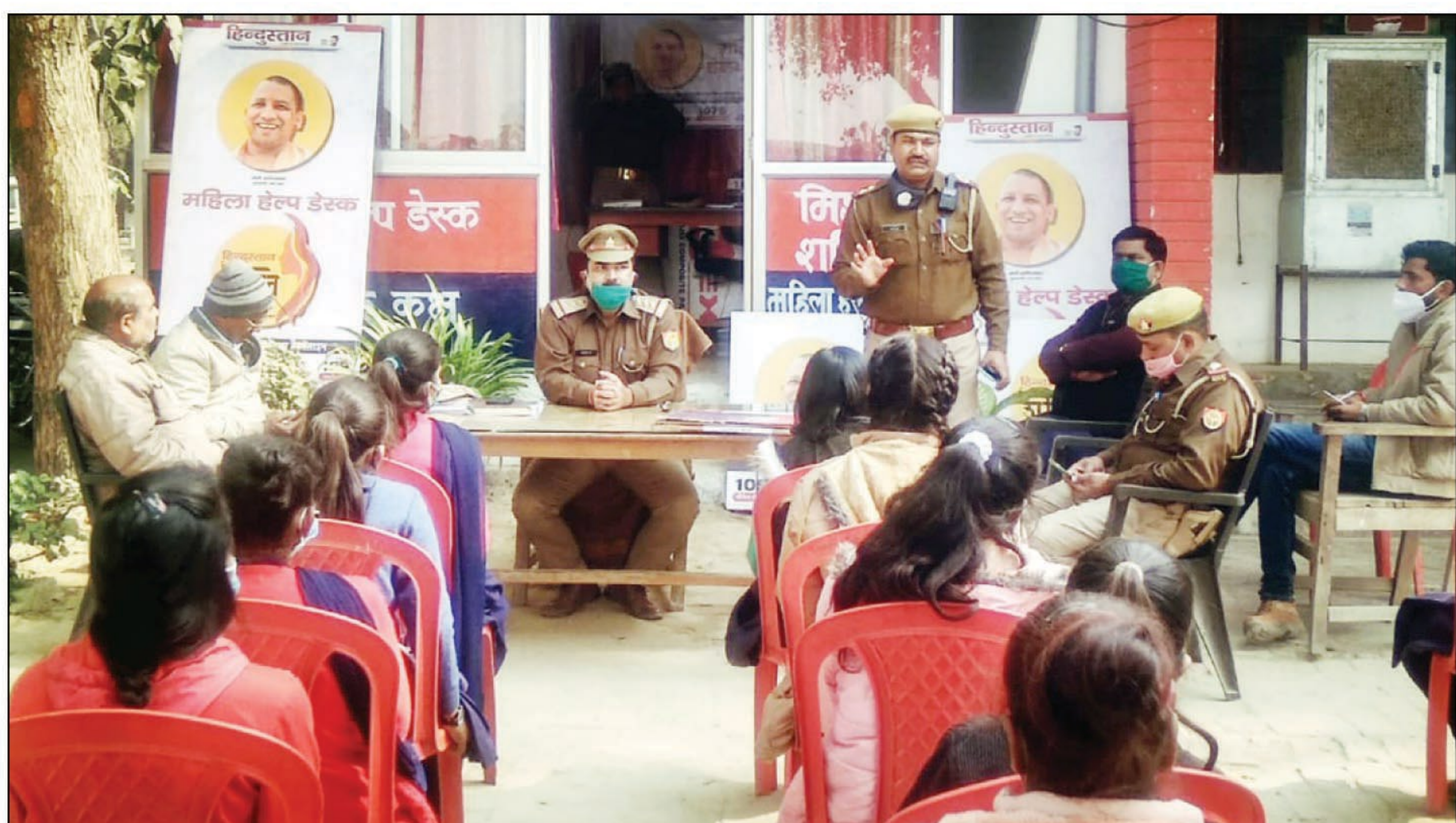
छात्राओं को जागरूक करते होलागढ़ इंस्पेक्टर

होलागढ़। होलागढ़ थाना परिसर में नारी सम्मान सशक्तिकरण अपराजिकता के तहत कार्यक्रम का आयोजन किया गया। जिसमें होलागढ़ क्षेत्र के विरभानपुर खरगापुर स्थित जगलाल जगत बहादुर पटेल इंटरमीडिएट कालेज के इंटर की छात्राओं ने थाना परिसर के बंदी गृह व अभिलेख सहित कई चीजों का जायजा लिया। जिसमें होलागढ़ इंस्पेक्टर तोरकेश्वर राय ने बताया कि 1090, 1098 व 1076, आदि नम्बरो को याद कर ले ताकि कभी शिकायत कर सकती है। और कहा कि महिलाओं के द्वारा दी गयी जानकारी को गुप्त रखते हुए कार्यवाही की जाती है। और कहा कि बेहिशिक शिकायत कर सकती है। और महिला हेल्प डेस्क पर उच्चाधिकारियों के द्वारा आये आदेशों पर हर बिन्दुओं को बताया। रजिस्टर नम्बर 8, ग्राम सभा अपराध रजिस्टर सहित रजिस्टरों को दिखाकर जानकारी दी गयी। ए-टीसीमियो प्रभारी मंगल सिंह ने छेड़छाड़ को रोकने के लिए उपाय