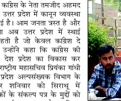
मंचासीन कांग्रेसी नेता

संपूर्ण जर्जा माफ़ी का फैसला भी लिया जायेगा। किसानों के अनाज की खरीद दारी को लेकर पार्टी का विशेष ध्यान रहेगा। उन्हीं ने कहा कि उत्तर प्रदेश में कांग्रेस की सरकार बनने के बाद बिजली का बिल सबका हाफ किया जाएगा। कोरोना में आर्थिक मार झेलने वालों को आर्थिक मदद की जायेगी।