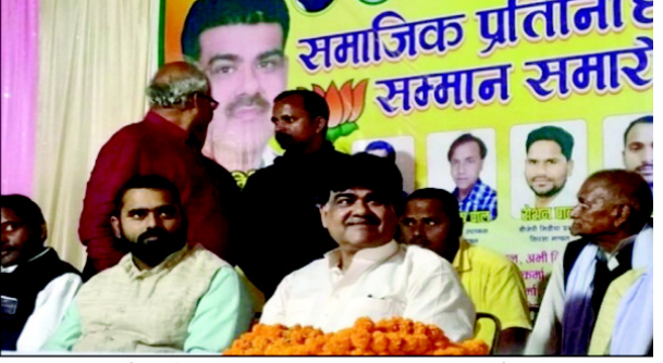
गोष्ठी में हुआ सामाजिक प्रतिनिधि सम्मान समारोह।