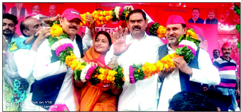
काबीना मंत्री इंद्रजीत सरोज का स्वागत करते सपाईं

कौशाब्बी। पश्चिम सरौरा कस्बे में समाजवादी पार्टी की रैली में उपस्थित भीड़ को संबोधित करते हुए पूर्व काबीना मंत्री समाजवादी नेता इंद्रजीत सरोज ने कहा कि उत्तर प्रदेश सरकार पूरी तरह से कानून व्यवस्था में फेल है महंगाई चरम पर है आम जनता महंगाई से परेशान है हत्या लूट डकैती बलात्कार से आम जनता त्राहि-त्राहि कर रही है उन्होंने कहा कि कोरोना काल में आम जनता को साधन नहीं मिल सके आम जनता परेशान रही कोरोना वायरस से रोजगार बंद हो गया जिससे गरीबों के सामने भुखमरी की स्थिति पैदा हो गई लेकिन योगी सरकार और केंद्र की मोदी सरकार दीया बाती जलाती रह गई उन्होंने कहा कि आने वाले समय में उत्तर प्रदेश में समाजवादी पार्टी की पूर्ण बहुमत की सरकार बनेगी उन्होंने कहा कि समाजवादी पार्टी के मुख्यमंत्री अखिलेश यादव के