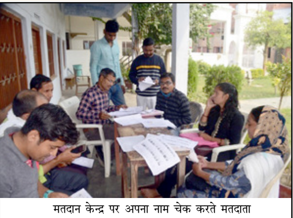
मतदान केन्द्र पर अपना नाम चेक करते मतदाता