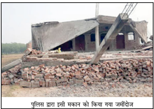
पुलिस द्वारा इसी मकान को किया गया जमींदोज