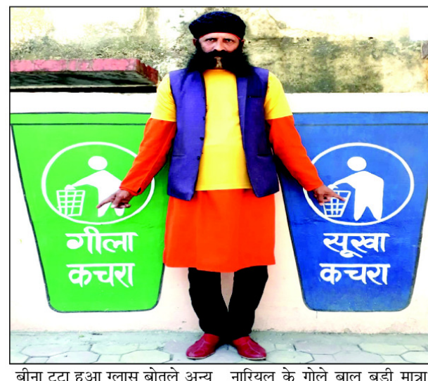
बीना टूटा हुआ ग्लास बोतलें अन्य सूखा कचरा गत्ता सोदर्य प्रसाधन रबर थमाकोल लकड़ी के टुकड़े

प्रयागराज। नगर निगम के अभियान के तहत शहर को स्मार्ट सिटी बनाने के लिए सम्मानित नागरिकों से अपील है कि स्वच्छता को मजबूती नहीं संस्कार में लाये कुड़ा कचरे को इधर उधर न फेंके घर में दुकानों कार्यालय रैस्टोरेंट में दो डस्टबिन रखे हरा और नीला हरे में गिला कुड़ा जैसे सज्जी चिकन चाय की पत्ती सड़े फल पत्ते की प्लेट काफ़ी पाउडर अंडे के छिलके फल के छिलके मछली की हड्डियां निकाया बचा भोजन निले में सूखा कुड़ा जैसे प्लास्टिक दूध दही पैकेट चिप्स टाफी रैपर प्लास्टिक कानाज कप प्लेट प्लास्टिक कवर बोतल कागज स्ट्रेसनरी अखबार पत्रिका टिश्यू पेंपरधातू में कोल्ड्रिक