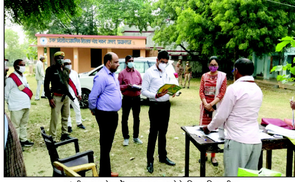
पंजीकरण केंद्रों का जायजा लेते जिलाधिकारी।