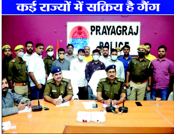
अंतरराज्यीय गैंग के चार लुटेरों के साथ पुलिस के आला अधिकारी