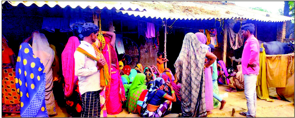
बालिका की हत्या के बाद मौके पर मौजूद ग्रामीण

कौशाब्बी। कोखराज थाना के अंतर्गत हिसामपुर परसखी गांव में मान सम्मान को लेकर एक बालिका की हत्या कर दी गई है जानकारी मिलने पर मौके पर स्थानीय चौकी पुलिस पहुंची है और बालिका के लाश को कब्जे में लेकर पोस्टमार्टम के लिए भेज दिया है बालिका का अपने रिश्ते के एक लड़के से शारीरिक संबंध थे परिजनों ने उस लड़के के साथ बालिका की आपत्तिजनक में देख लिया जिस पर वह अपना मानसिक संतुलन खो बैठे और मान सम्मान का हवाला देते हुए गला घोटकर बालिका की हत्या कर दी गई है।