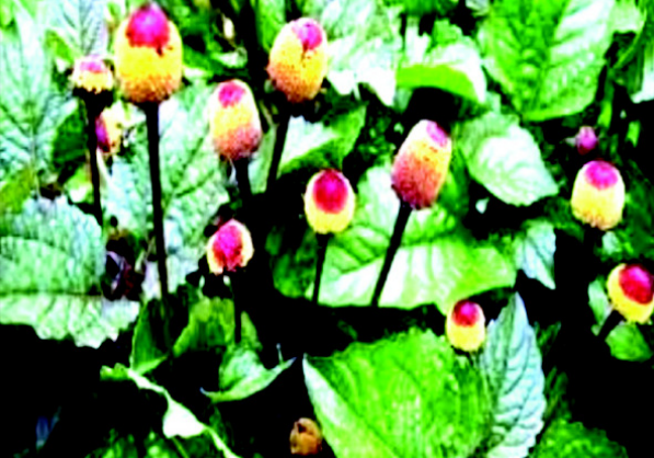
बैठक में उपस्थित कृषक व अकरकरा औषधि के पौधे।