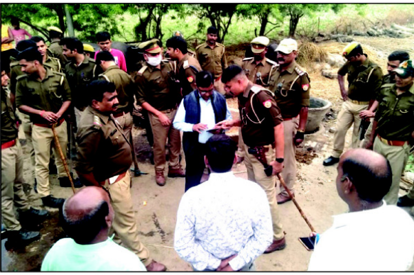
शराब भंडियों पर कार्यवाही के दौरान मौजूद भारी पुलिस फोर्स