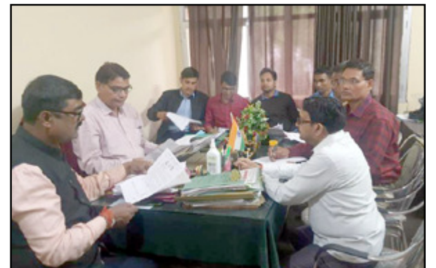
जनपद स्तरीय खेल प्रतियोगिता की बैठक में मौजूद अतिथिगण

बैठक में इस बात पर सहमति व्यक्त की गई कि विकास खण्ड आसपुर देवसरा, पट्टी, गौर, शिवगढ़, बाबा बलखरनाथ धाम, मंगरोरा, सदर, मांथाता, सांडवा चौडका, सांगीपुर, लालगंज, रामपुर संग्रामगढ़, लक्ष्मणपुर में 8, 9 एवं 10 नवंबर को प्रतिभागियों के खेल पंजीकरण का कार्य आरंभ