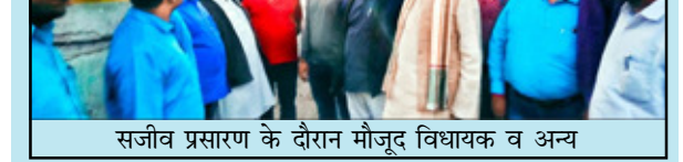
सजीव प्रसारण के दौरान मौजूद विधायक व अन्य