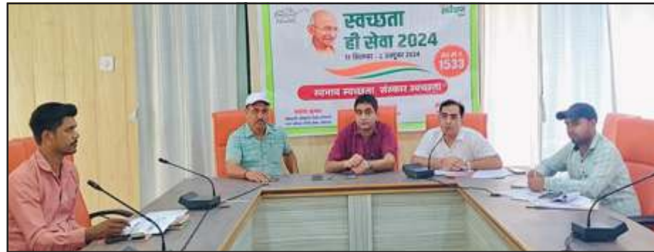
नगर पालिका सभागार में आयोजित बैठक में मौजूद ईओ व नगर स्वास्थ्य अधिकारी।

प्रतापगढ़। नगर पालिका के सभागार में आज प्रधानमंत्री नरेंद्र मोदी के जन्मदिन 17 सितंबर से लेकर राष्ट्रपिता महात्मा गांधी के जन्मदिन 2 अक्टूबर तक स्वास्थ्य पखवारा मनाने पर विस्तृत चर्चा की गई तथा पखवारे में स्वच्छता ही सेवा है की परिकल्पना पर केन्द्र सरकार व प्रदेश सरकार ने विस्तृत कार्यक्रम जारी किया है जिसमें स्वभाव में स्वच्छता और संस्कार में स्वच्छता