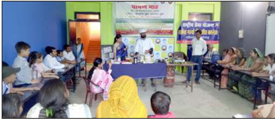
कार्यशाला में माताओं को जागरूकता की जानकारी देते अतिथिगण।

इस सफल आयोजन में सौ से अधिक माताओं ने भाग लिया और