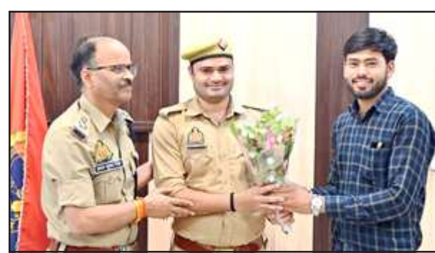
पुलिस को धन्यवाद देता साइबर ठगी का शिकार।