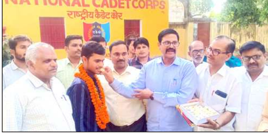
टापर को मिठाई खिलाते प्रधानाचार्य।