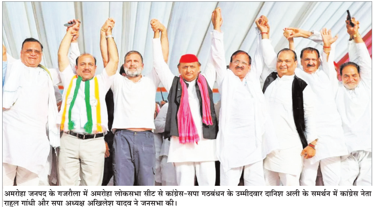
अमरोहा जनपद के गजरोला में अमरोहा लोकसभा सीट से कांग्रेस-सपा गठबंधन के उम्मीदवार दानिश अली के समर्थन में कांग्रेस नेता राहुल गांधी और सपा अध्यक्ष अखिलेश यादव ने जनसभा की।

विनिमार्ताओं और निवेशकों को आकर्षित करने का प्रयास करेंगे। वित्त मंत्री ने मुद्रास्फीति पर बोलते हुए कहा कि मोदी सरकार के तहत एक महीने को छोड़कर यह कभी भी सहनशील सीमा को पार नहीं कर पाई। उन्होंने कहा कि 2014 से पहले अर्थव्यवस्था खराब स्थिति में थी जबकि मुद्रास्फीति दोहरे अंकों में थी। रोजगार के बारे में पूछे गए एक सवाल के जवाब में उन्होंने कहा कि औपचारिक और अनौपचारिक दोनों क्षेत्रों के आंकड़ों में कमी है, लेकिन केंद्र सरकार की पहल से लाखों लोगों को रोजगार मिला है।