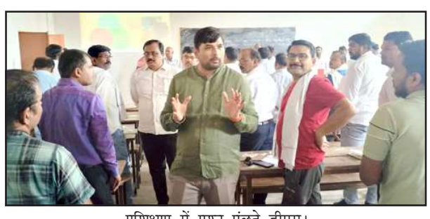
प्रशिक्षण में प्रश्न पूछते डीएम।

चित्रकूट। जिलाधिकारी/जिला निर्वाचन अधिकारी अभिषेक आनन्द ने मतदान कर्मियों के चित्रकूट इंटर कॉलेज कर्बी में जारी दोनों पार्टियों के प्रशिक्षण में लोकसभा चुनाव में मतदान बाबत सभी प्रक्रिया व ईवीएम में मतदान बाबत प्रशिक्षण का निरीक्षण किया। शनिवार को डीएम ने मास्टर ट्रेनरों से कहा कि अच्छे ढंग से मतदान कर्मियों को प्रशिक्षण दें, ताकि मतदान दौरान कोई समस्या न आये। उन्होंने मतदान कर्मियों से मतदान प्रक्रिया के बारे में पूछा। तत्काल मतदान कर्मियों ने