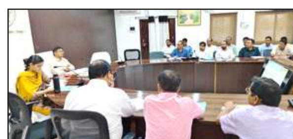
निर्देश देते डीएम।