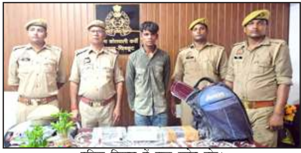
पुलिस गिरफ्त में माल समेत चोर।