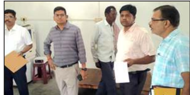
कार्यालय में जांच करते डीएम।