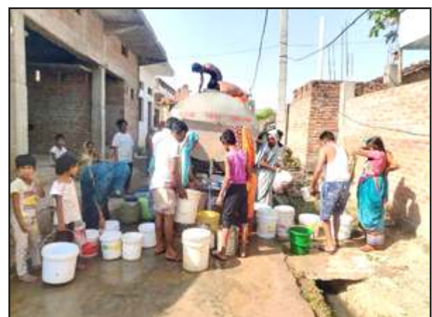
पेयजल को परेशान करवावासी।