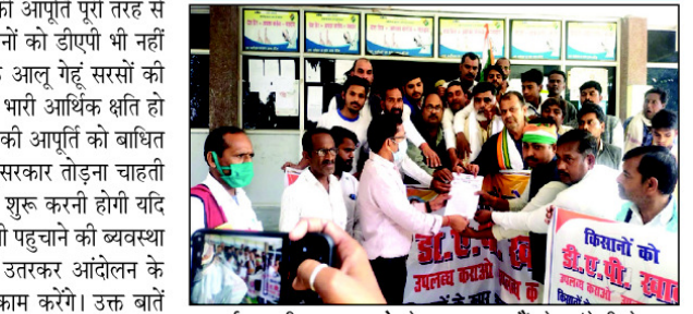
उत्तरक की समस्या को लेकर ज्ञापन सौंपते कांग्रेसी नेता