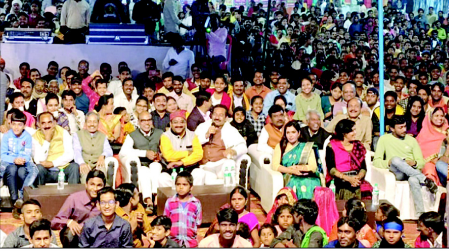
दीपावली मेला महोत्सव भरवारी में विदेशी कलाकारों को सुनने के लिए उमड़ी भीड़।