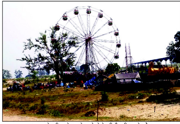
घूरपुर के भीटा में लगने वाले मेले की तैयारी करते लोग

प्रसन्न होकर यमराज बहन यमुना से वरदान मांगने को कहते हैं। बहन यमुना ने जन कल्याण के लिए भाई यमराज से यह वरदान मांगा कि जो भी इस दिन यमुना में स्नान करेगा वह