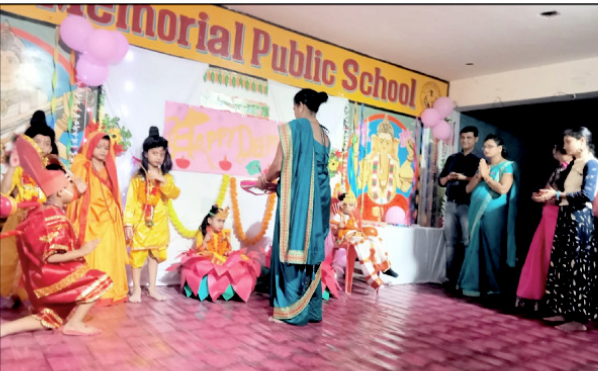
दीपावली पर्व के पूर्व विद्यालय में कार्यक्रम प्रस्तुत करते छोट-छोटे बच्चे