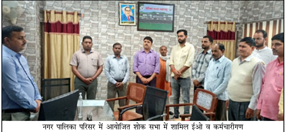
नगर पालिका परिसर में आयोजित शोक सभा में शामिल ईओ व कर्मचारीगण