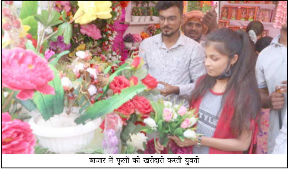
बाजार में फूलों की खरीदारी करती युवती