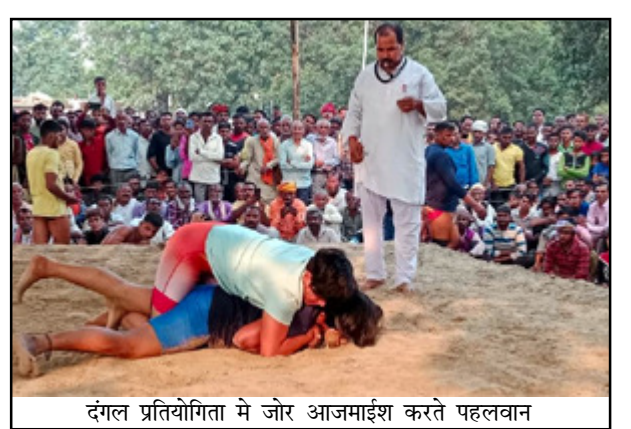
दंगल प्रतियोगिता में जोर आजमाईश करते पहलवान