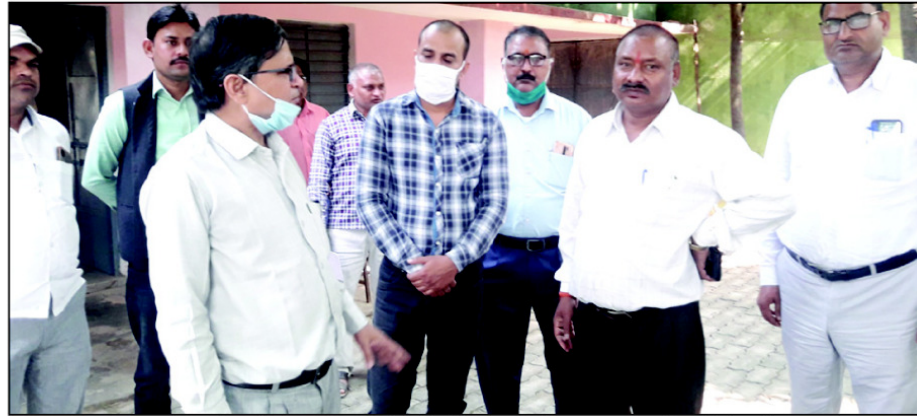
करछना के नये खंड विकास अधिकारी निरीक्षण के दौरान आवश्यक दिशा निर्देश देते

कौशांबी। उदहिन बाजार में चल रही दस दिवसीय रामलीला के आठवें दिन सीताहरण की लीला दिखाई गई। मामा मारीच के सोने के हिरण बनके जंगल की ओर भागने और भगवान राम के हाथों मारे जाने के दृश्य दे सिते.. हे सीते..कहने से माता सीता को यह आभास हुआ कि भगवान राम संकट में हैं। उन्होंने लक्ष्मण जी को राम जी की सहायता के लिए जंगल जाने को कहा। लक्ष्मण जी के मना करने पर माता सीता ने आदेश दिया कि लक्ष्मण जी रामजी की सहायता के अवश्य जंगल में जाएं। जाते - जाते लक्ष्मण जी कुटिया में लक्ष्मण रेखा खींचे गए और माता सीता से कहा कि जब तक हम नहीं आए, आप इस लक्ष्मण रेखा को पार मत करिएगा। लक्ष्मण जी के जाते ही कुटिया में साधु के भेष में लंकापति राजा रावण आया और माता सीता से भीक्षा मांगा। सीताजी लक्ष्मण रेखा के अंदर से भीक्ष मांसे लगीं। इसपर रावण ने भीक्षा लेने से मना कर दिया और कहा कि जब तक आप इस लक्ष्मण रेखा को पार कर बाहर आइं, रावण ने सीता जी का हरण कर लिया। माता सीता जी हे राम.. हे राम कहकर विलाप करने लगीं। रावण सीता जी का हरण कर जैसे ही लंका की ओर चल दिया, माता सीता जी जोर से विलाप करने लगीं और रामलीला पंडाल परिसर में मौजूद रहे सभी भक्त रुआंसे हो गए।