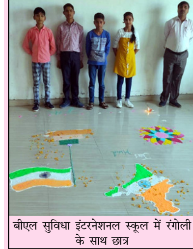
बीएल सुधिता इंटरनेशनल स्कूल में रंगोली के साथ छात्र