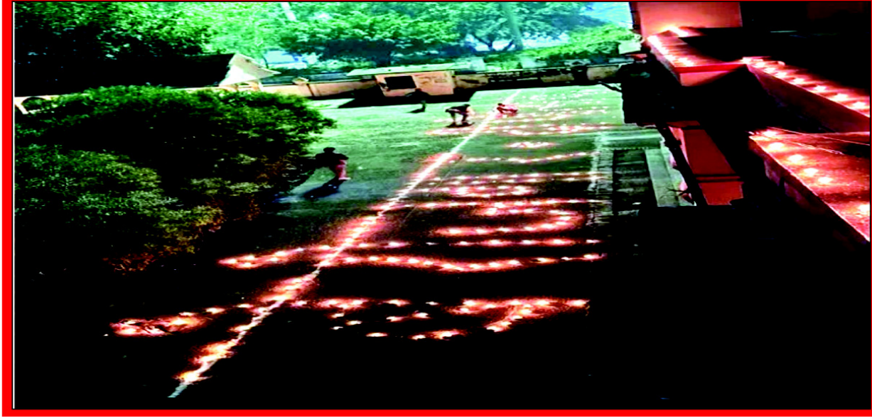
विश्वविद्यालय छात्र संघ भवन पर छात्रों ने झालर व दीपों से लिखा बेरोजगारी दिवस

प्रयागराज। इलाहाबाद विश्वविद्यालय के छात्रसंघ भवन पर संयुक्त बेरोजगार संघर्ष समिति ने झालरों से बेरोजगार दीपोत्सव लिखकर छोटी दिवाली को बेरोजगारी दिवस के रूप में मनाया। इस मौके पर बड़ी संख्या में छात्र मौजूद रहे। छात्रों ने झालरों और दीपक से बेरोजगार दीपोत्सव लिखा। कहा कि सरकार बेरोजगारों को रोजगार देने में असफल साबित हो रही है। लाखों पद खाली पड़े हैं, लेकिन सरकार विज्ञापन जारी नहीं कर रही है। इसके खिलाफ अनवरत धरना प्रदर्शन चल रहा है, बावजूद इसके सरकार ने अभी तक बेरोजगारों के लिए कुछ नहीं किया है। इसके चलते छात्र छोटी दिवाली को बेरोजगार दिवस के रूप में मनाने के लिए बाध्य हैं।