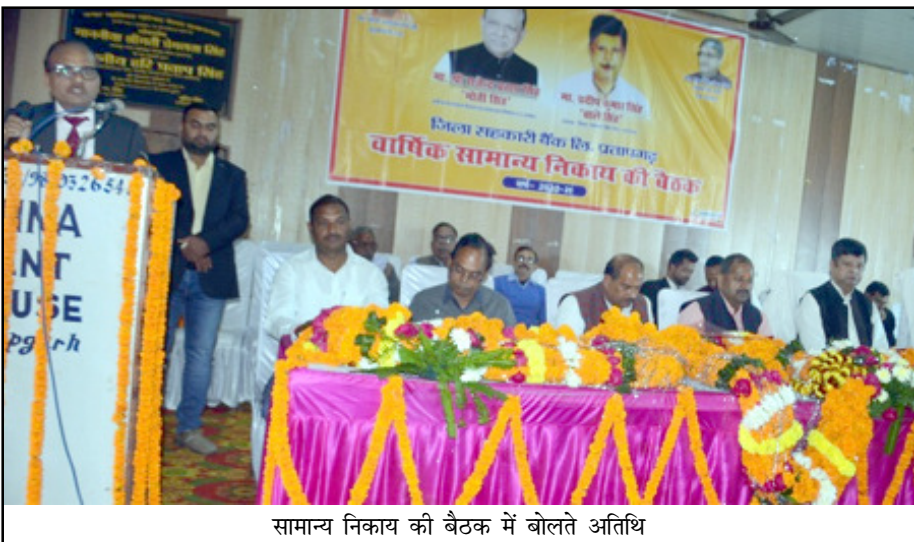
सामान्य निकाय की बैठक में बोलते अतिथि

में कुछ समितियों के माध्यम से माइक्रो एटीएम का प्रयोग कर विद्युत बिल जमा कराया जा रहा है।