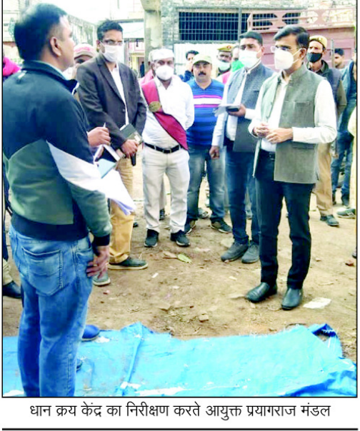
धान क्रय केंद्र का निरीक्षण करते आयुक्त प्रयागराज मंडल

कौशाम्बी। धान खरीद केंद्र में तमाम अव्यवस्था की शिकायत पर आयुक्त प्रयागराज मंडल अचानक धान खरीद केंद्र मनोरी पहुँच गए हैं धान खरीद केंद्र में आयुक्त के पहुंचते ही वहां अफरातफरी मच गई है जहां निरीक्षण के दौरान उन्हें तमाम खामियां मिली है तमाम किसानों ने धान खरीद केंद्र में अवैध वसूली कराने धान खरीद में परेशान करने का आरोप केंद्र प्रभारी पर लगाया है केंद्र पर मौजूद किसानों ने बताया कि वहां बिचौलियों और च्यापारी हॉबी है जिस पर आयुक्त ने केंद्र प्रभारी को जमकर फटकार लगाई है मनोरी धान क्रय केंद्र पर शनिवार को पहुँचे प्रयागराज कमिश्नर ने सीधा किसानों से बात कर केंद्र की स्थितियों की जानकारी लिया है, 'केंद्र तक पहुंचने का रास्ता बहुत सकरा है जिससे किसानों का माल लाने में बड़ी दिक्कत का सामना करना पड़ता है, 'कमिश्नर के आगमन की खबर मिलते ही केंद्र पर बैठे दलाल गिरते पड़ते भागते देखे गए।