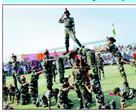
चैवल में प्रतिभाग करते खिलाड़ी

केन्द्रीय मंत्री ने कहा कि खेल में जीतना हारना महत्व नहीं रखता बल्कि खेल में प्रतिभाग करना बहुत ही महत्वपूर्ण