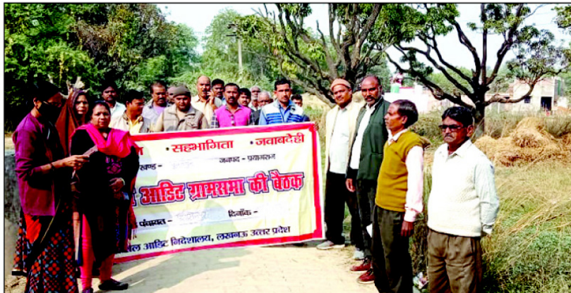
मनरेगा कार्यों का स्थलीय निरीक्षण करते हुए सोशल आडिट टीम के सदस्य