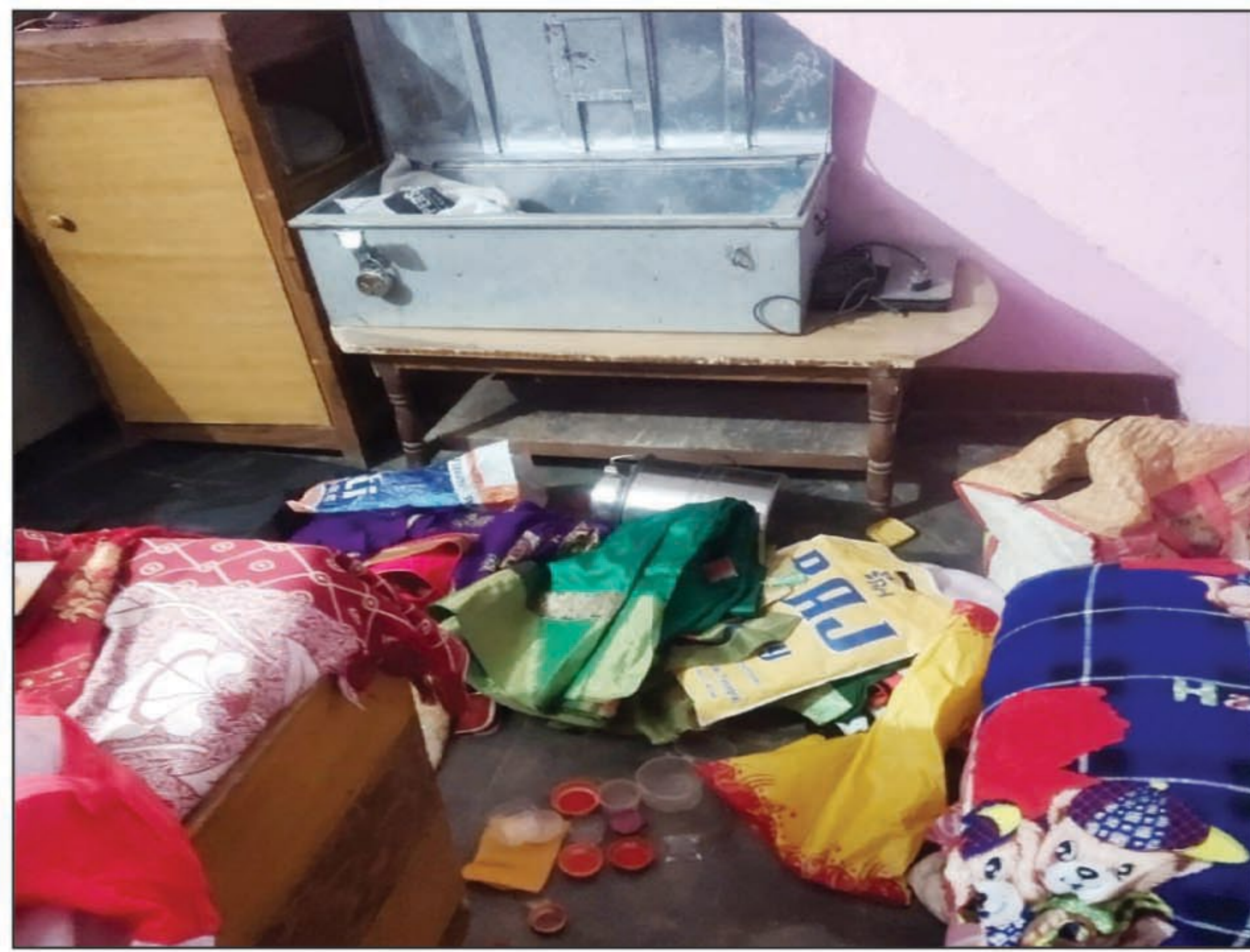
चूना मजरा शुक्लान गांव में लाखों की चोरी के बाद कमरे में पड़ा अस्त-व्यस्त सामान

नवाबगंज। बीती रात को अज्ञात चोरों ने छत के सहारे पर घर के कमरे में घुसकर नगदी समेत लाखों रूपए के सोने-चांदी के आभूषण समेत ले गए। शुक्रवार की सुबह जब परिजन सोकर उठे, तो घर के अन्य कमरे में पहुंचे तो अस्त-व्यस्त सामान देखकर दंग रह गए। आबकारी लिपिक के घर हुई लाखों की चोरी घटना की खबर जैसे ही गांव में पहुंची तो ग्रामीणों में हड़कंप मच गया। उधर गांव के ही पूर्व शिक्षक के घर में भी चोरों द्वारा हजारों की चोरी किये जाने का प्रयास किया गया है। लाखों की चोरी घटना की खबर पाकर पुलिस मौके पर पहुंचकर जांच-पड़ताल में जुट गई है। हालांकि भूक्तभोगी की तहरीर पर पुलिस रिपोर्ट दर्ज कर कार्रवाई करते हुए चोरों का पता लगाने में जुट गई है। जबकि लाखों की चोरी