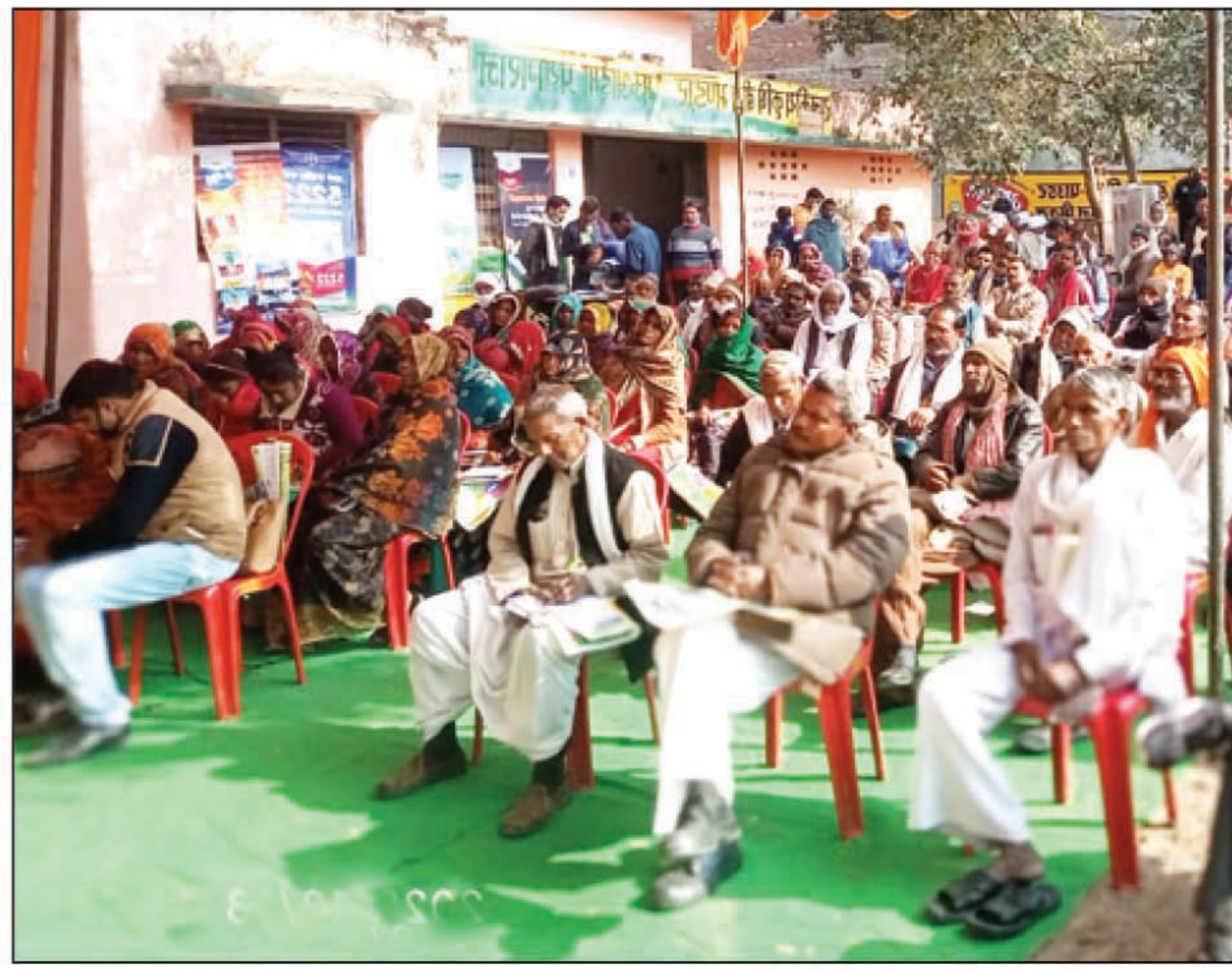
कृषि मेले में उपस्थित किसान