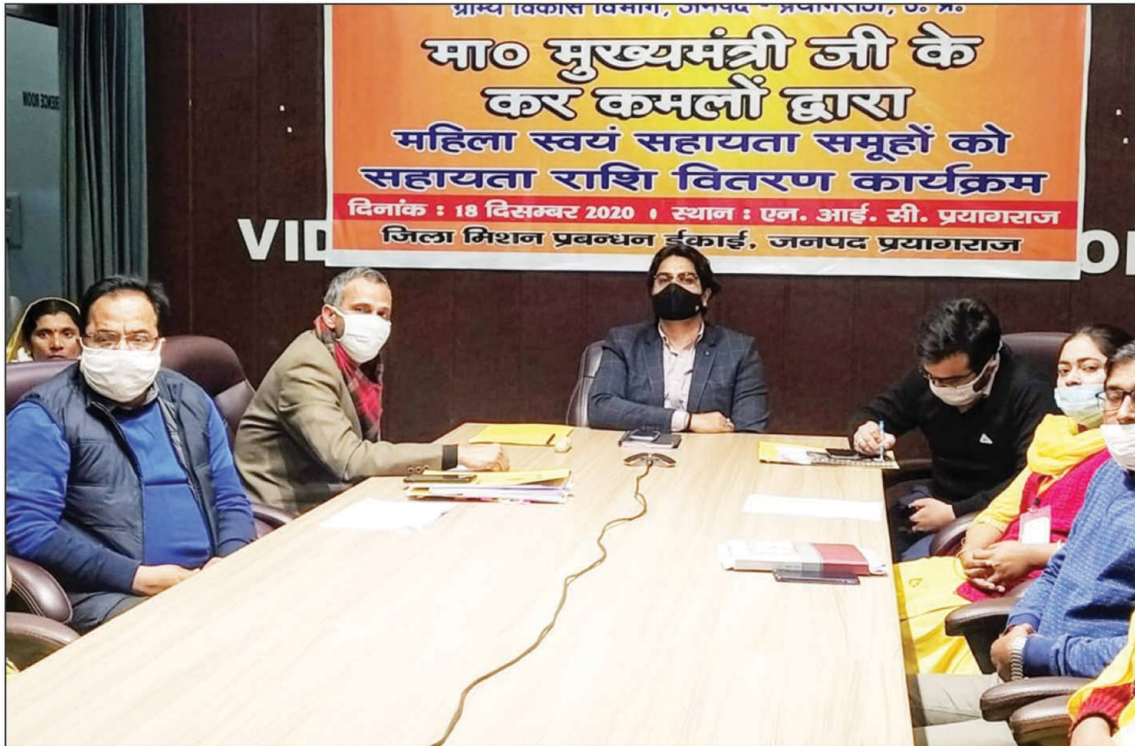
वीडियो कांफ्रेंसिंग से जुड़े जिलाधिकारी व अन्य

कर लिया जाये, जिससे कि उनको और भी कार्य मिल सके एवं वे अपनी आर्थिक स्थिति को मजबूत कर सकें। मा0 मुख्यमंत्री जी ने जनपद प्रयागराज में स्वयं सहायता समूहों के द्वारा यूनिफार्म सिलाई में किए गए अच्छे कार्य के लिए प्रशंसा भी की। इस अवसर पर जनपद प्रयागराज में समूह स्टार्ट अप मद के 642 समूहों को प्रति समूह की दर