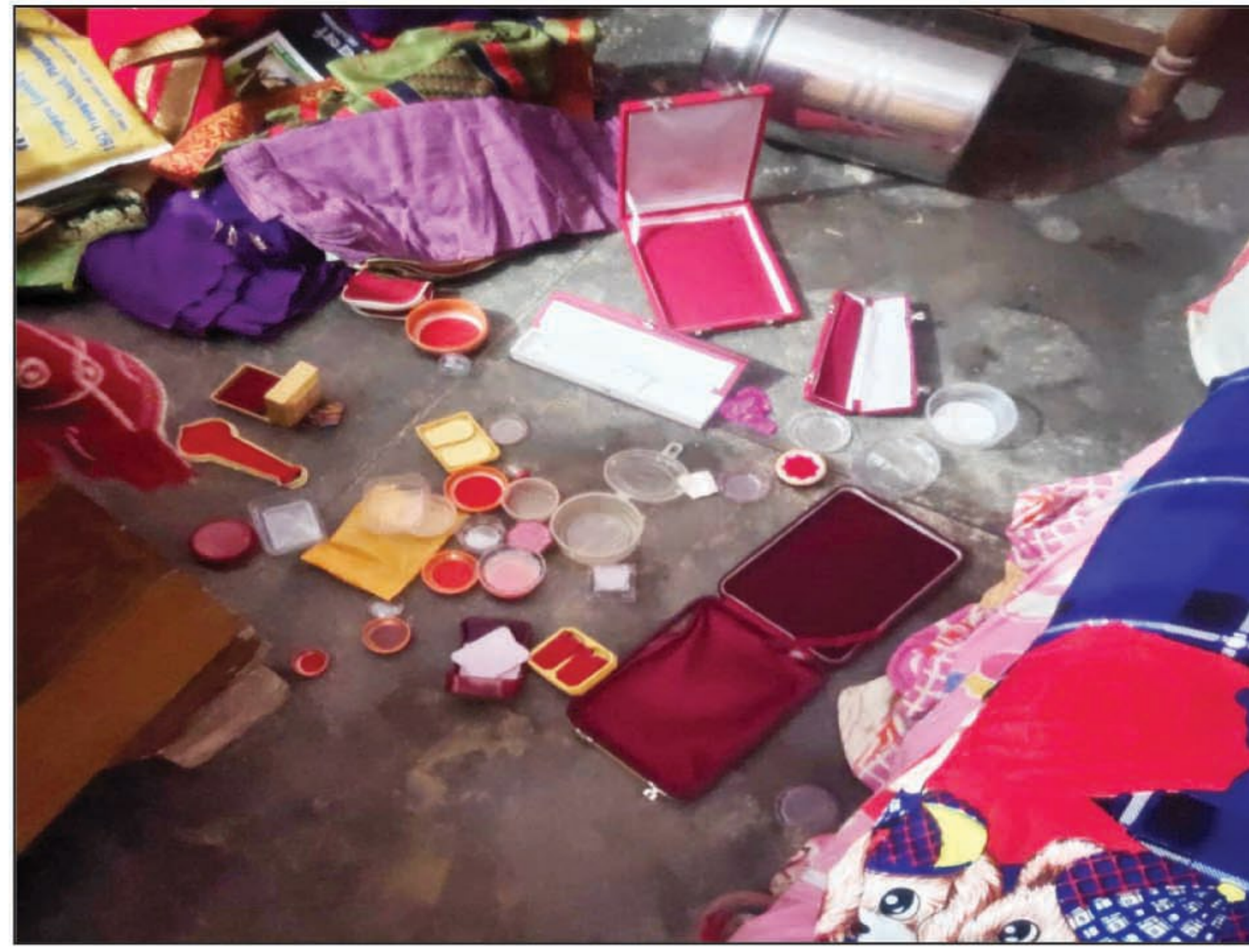
चूना मजरा शुक्लान गांव में लाखों की चोरी के बाद कमरे में पड़ा अस्त-व्यस्त सामान