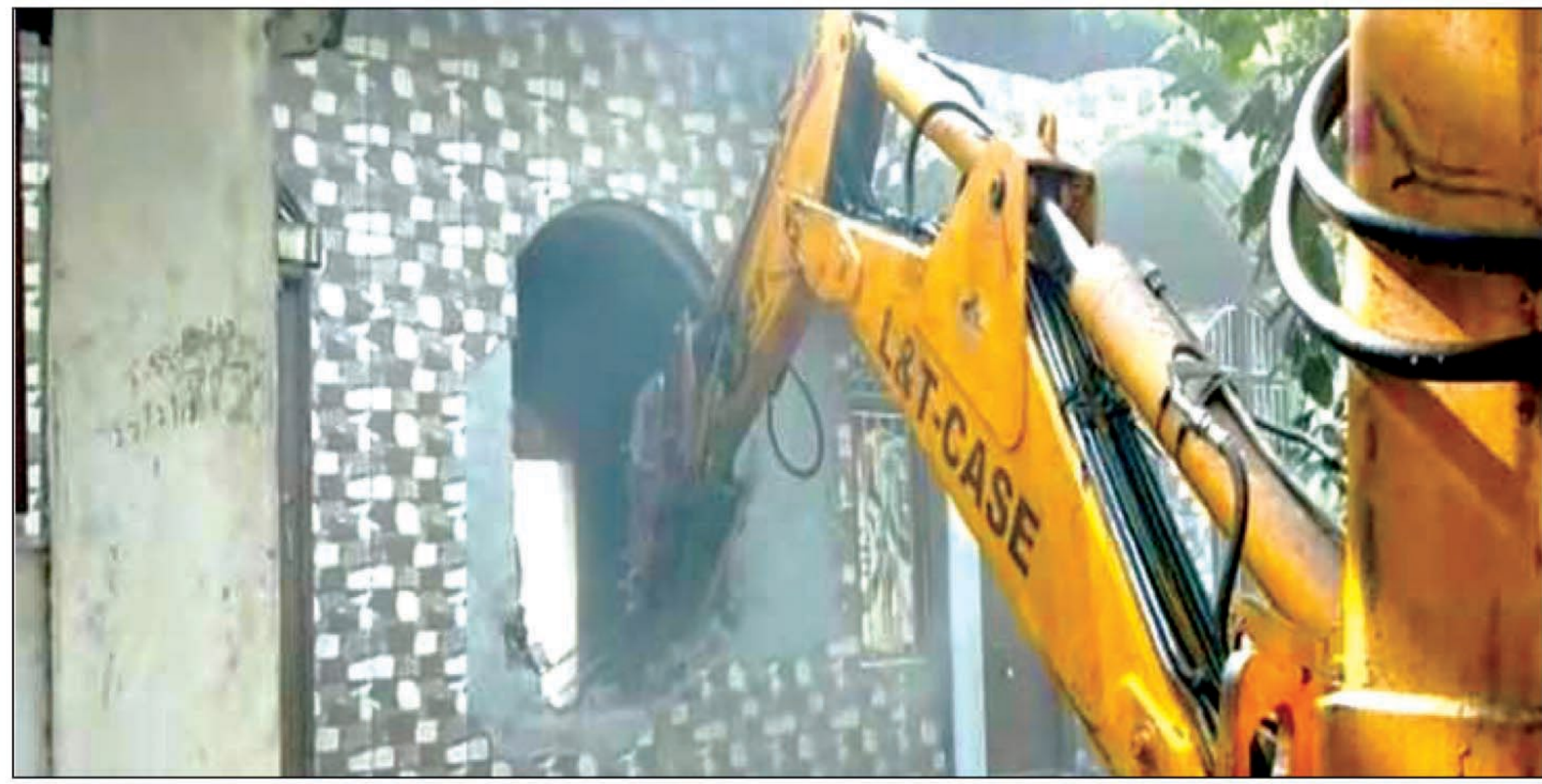
अवैध मकान ढहाता पीडीए का जेसीबी