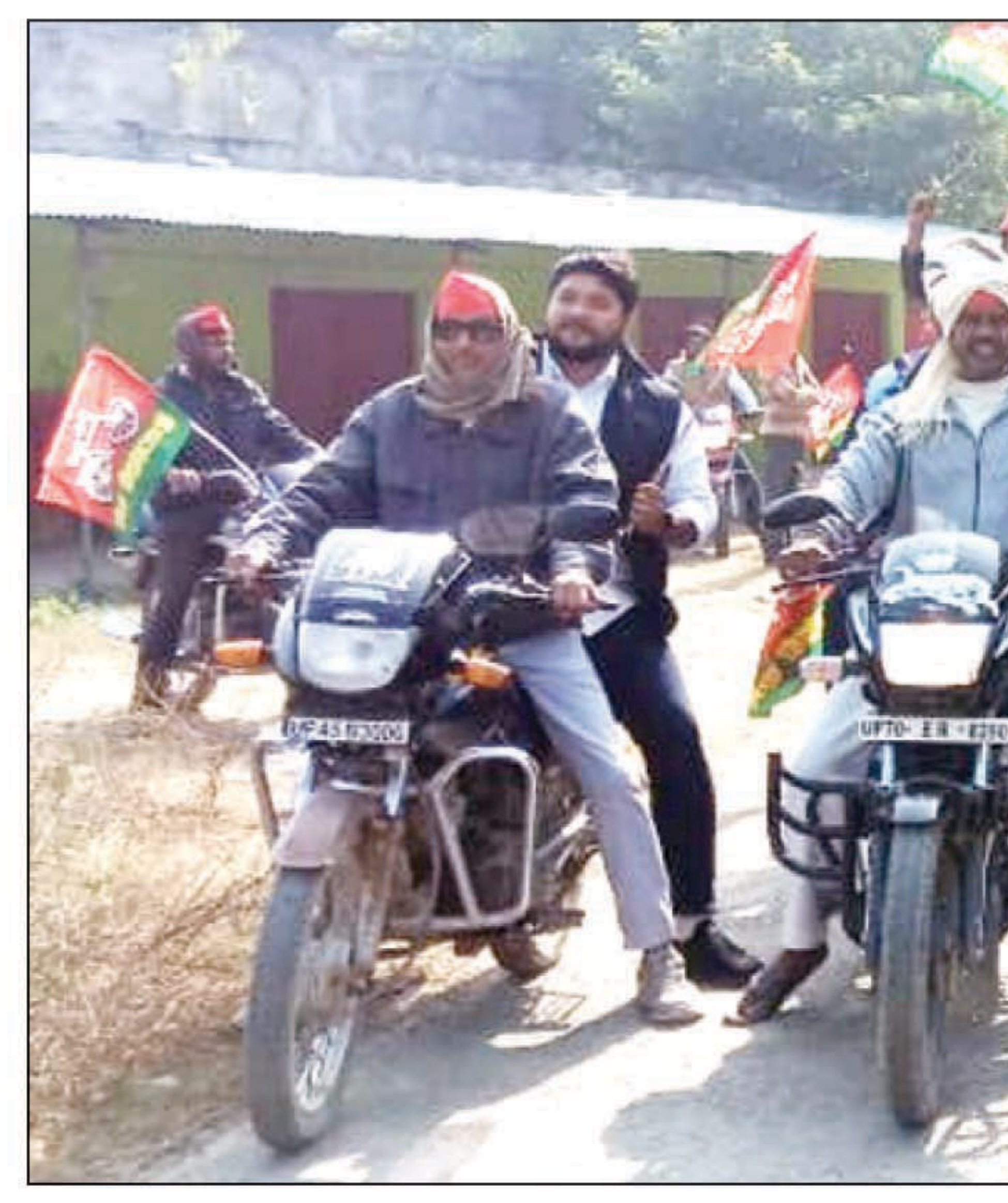
किसान सम्मान यात्रा निकालते सपाईं