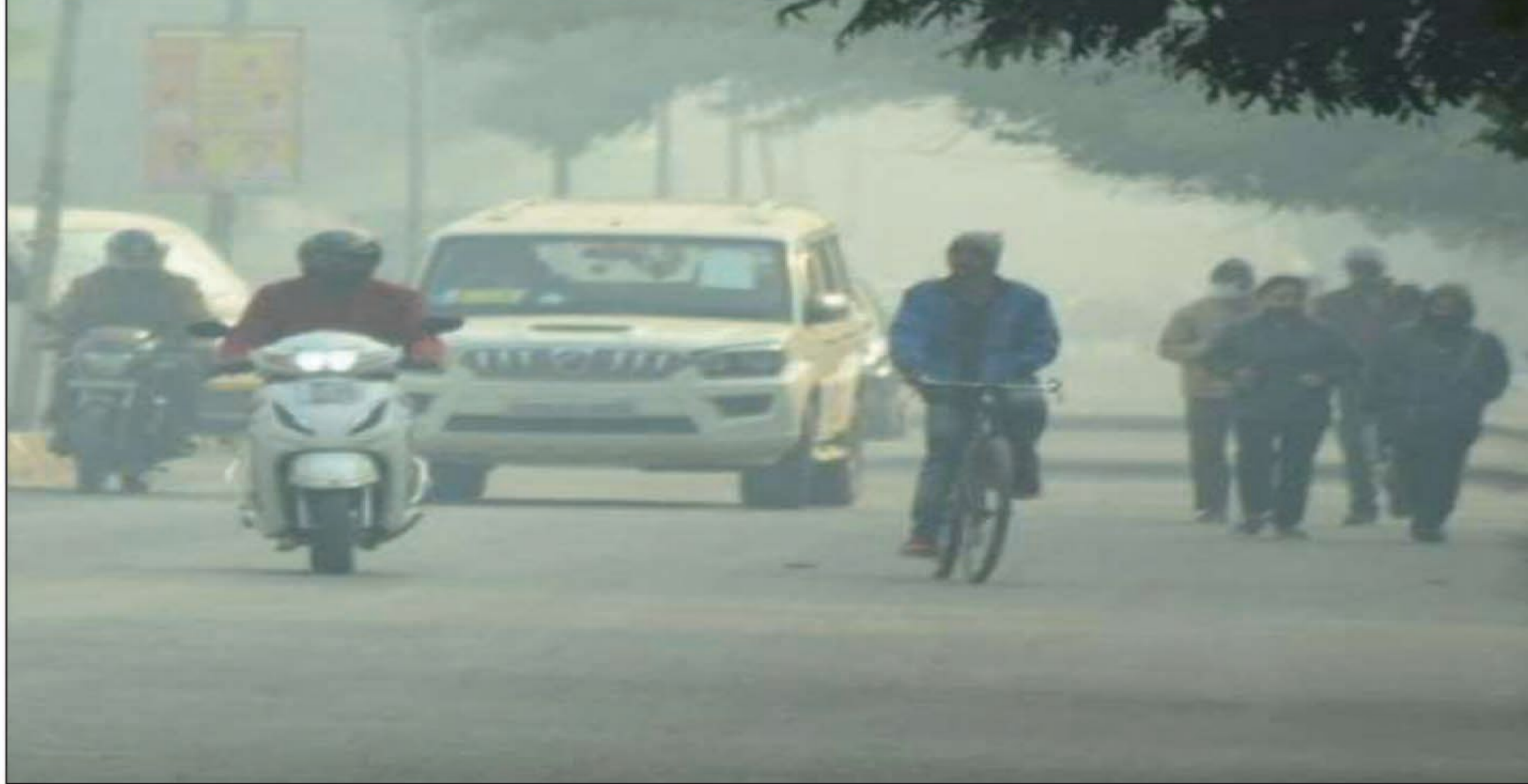
वहींशुक्रवार को दिन में धूप निकली। मगर, सर्द हवा ने परेशान कर दिया। शुक्रवार को

में उत्तरी-पश्चिमी हवा चल रही है। पहाड़ों से आने वाली ये हवा कंपकंपी बढ़ाएगी। शुक्रवार को पूर्वी और पश्चिमी यूपी के कई जिलों में शीतलहर शुरू हो गई है। शनिवार को अधिकतम तापमान 21 डिग्री सेल्सियस रहने का अनुमान है। वहीं न्यूनतम तापमान पांच डिग्री सेल्सियस के आसपास रहेगा। आठ बजे के करीब धूप निकली। मगर, उड़ी हवाओं के बीच यह बेअसर रही।