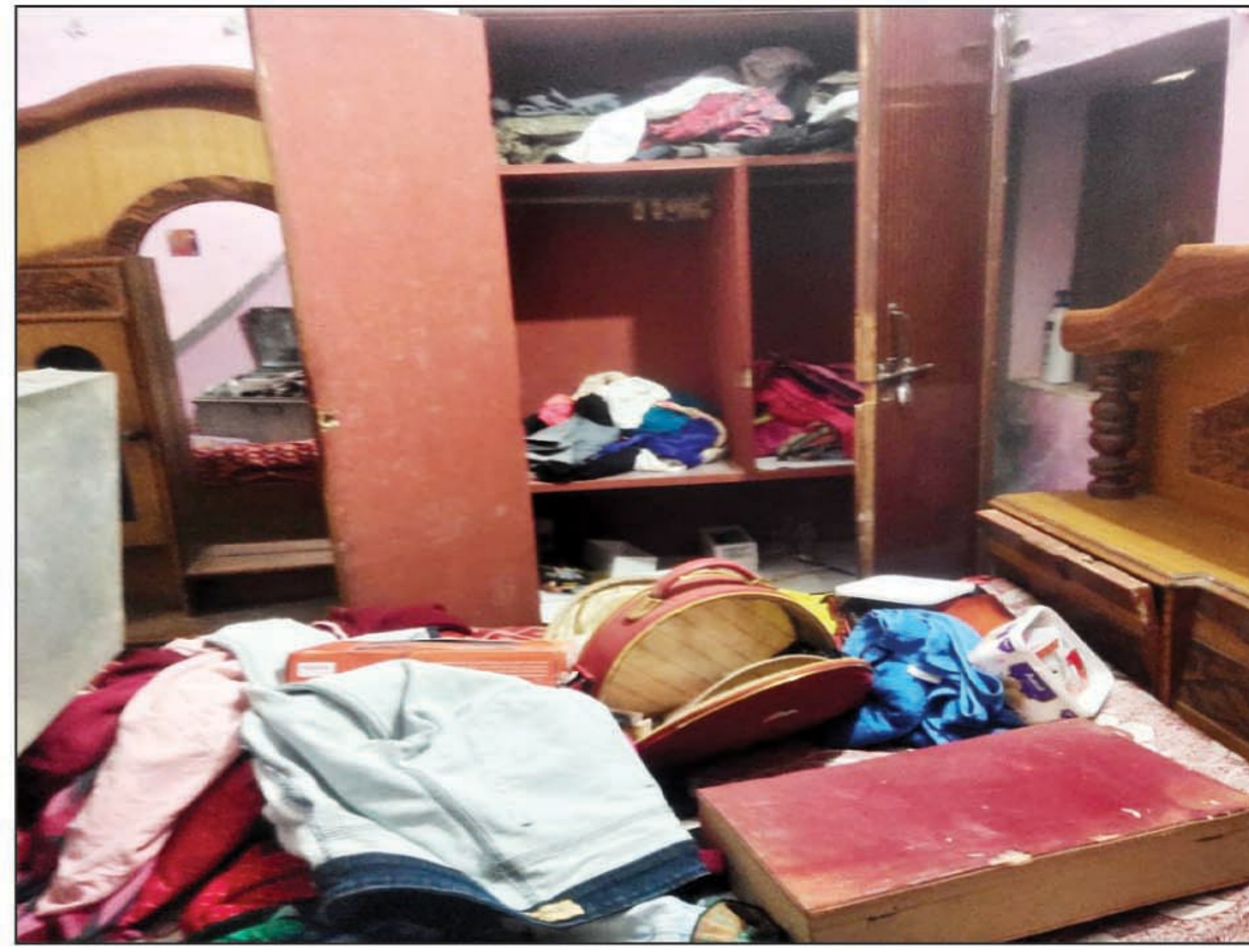
चोरी के बाद सूचना पर पहुंची पुलिस जांच पड़ताल करते हुए