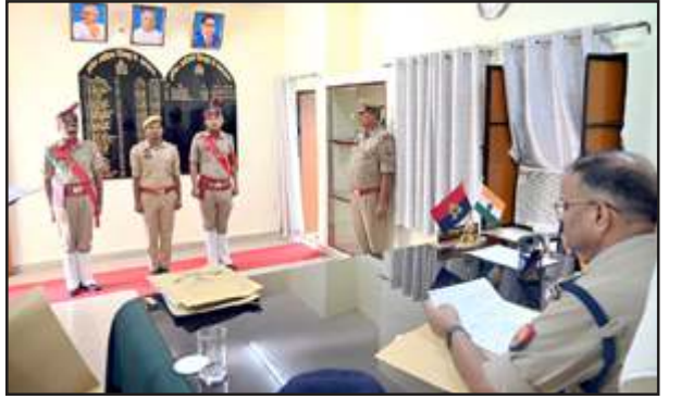
निरीक्षण करते एसपी।