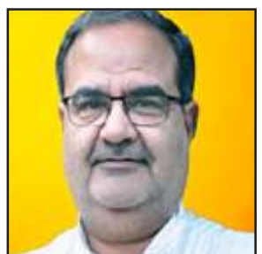
भाजपा प्रदेश अध्यक्ष भूपेंद्र चौधरी।

शुक्रवार को भाजपा प्रदेश अध्यक्ष भूपेंद्र चौधरी ने कहा कि बीजेपी के संगठन में दलित व महिलाओं के लिए आक्षेप की उचित व्यवस्था है। दादा से लेकर राहुल गांधी तक कांग्रेस की कमान