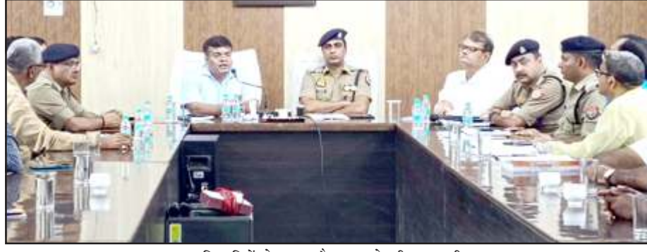
अधिकारियों के साथ बैठक करते डीएम-एसपी।

बैठक में जिलाधिकारी ने सर्वप्रथम विभिन्न संप्रदाय के धर्म गुरुओं व सम्प्रान्त नागरिकों तथा आयोजकों से उनके क्षेत्र में आने वाली समस्याओं के बारे में जानकारी ली तथा उनके