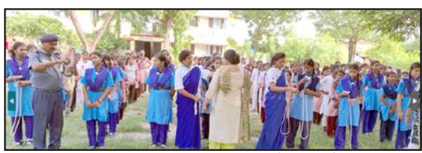
कस्तूरबा गांधी आवासीय बालिका विद्यालय की छात्राओं को प्रशिक्षण देती प्रशिक्षिकाएं।

प्रतापगढ़। कस्तूरबा गांधी आवासीय बालिका विद्यालयों में गाइड की तीन दिवसीय प्रशिक्षण शिविर के दूसरे दिन शुक्रवार को विभिन्न जानकारी दी गई। मंगरीरा में गाइडों को ध्वज शिष्टाचार, श्रमदान, प्राथमिक सहायता, प्रगतिशील प्रशिक्षण, ध्वज की जानकारी, सीटी के संकेत, गांठ, फांस बंधन का अभ्यास कराया गया। कस्तूरबा गांधी आवासीय बालिका विद्यालय पट्टी, आसपुर देवसरा, गौर, शिवगढ़, मानधाता