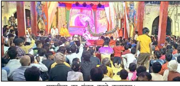
रामलीला का मंचन करते कलाकार।

शुक्रवार को सीता स्वयंवर पर जनक ने शिव धनुष तोड़ने की शर्त सुनकर देश-विदेश से आये राजा-महाराजाओं ने शिव धनुष तोड़ने का सर्पूण प्रयास किया। शिव धनुष को कोई राजा हिला तक नहीं पाया। इससे राजा जनक बहुत दुखी हुए। राजा जनक ने भरी सभा में कहा कि धरती वीरों से विहीन हो गई