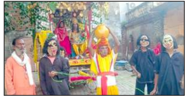
सीता उत्पत्ति की निकली मनोहर झांकी।

जगह-जगह महिलाओं ने आरती उतारी और पुष्प वर्षा की। आज की लीला की झांकी गोपाल मंदिर से चैक होते हुए सदर बाजार से चैक होते हुए रेलवे स्टेशन प्रतापगढ़ से वापस पंजाबी मार्केट