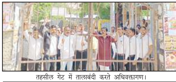
तहसील गेट में तालाबंदी करते अधिवक्तागण।