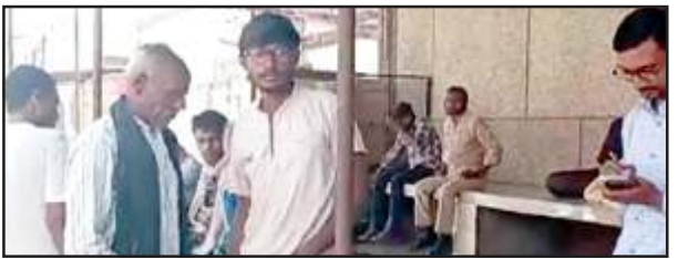
मर्चरी में बैठे मृतक के परिजन।