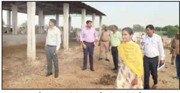
गौशाला का निरीक्षण करते डीएम-सीडीओ।

शुक्रवार को डीएम ने ने भूसा स्टाक, गौवंशों की संख्या, पेयजल, शेड, चरही, साफ-सफाई आदि का निरीक्षण किया। सचिव व पशु चिकित्साधिकारी ने बताया कि गौशाला में 150 गौवंश हैं। भूसा की पर्याप्त व्यवस्था है। डीएम ने प्रधान-सचिव को निर्देश दिये कि गौवंशों को खिलाने को हरा चारा दें। पेयजल की समुचित व्यवस्था