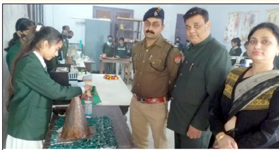
रिवर डेल में लगी विज्ञान प्रदर्शनी का अवलोकन करते सीओ सिटी व प्रबंधक।

मुख्य अतिथि ने बच्चों को प्रमाण पत्र वितरित किया।