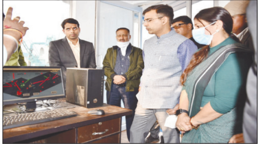
नगर निगम द्वारा संचालित बसवार प्लांट में सी.एण्ड डी. वेस्ट प्लांट का शुभारंभ करते मण्डलायुक्त साथ में नगर पालिका अध्यक्ष

प्रयागराज। 5 करोड़ 63 लाख की लागत से बने इस प्लान्ट की क्षमता 100 मी0टन प्रतिदिन की है। इसमें स्मार्ट सिटी से 4.13 करोड़ एवं नेशनल क्लोन एयर प्रोग्राम से 1.5 करोड़ लगाए गए हैं। मलबे को रिसाइकल कर ईंट, कब्रं स्टोन, टाइल्स एवं स्लैब कवर तैयार किया जा सकेगा जिसका उपयोग सड़क पटरी निर्माण एवं इण्टरलॉकिंग बनाने में किया जाएगा। लगभग 15000 मेट्रिक टन कंस्ट्रक्शन एवं डिमोलिशन वेस्ट अभी तक इकट्ठा किया जा चुका है जिससे रिसाइकलिंग का काम चल रहा है। नगर क्षेत्र से जनिट कंस्ट्रक्शन एवं डिमोलिशन वेस्ट (निर्माण एवं विध्वंस से जनिट अपशिष्ट) के वैज्ञानिक विधि से निस्तारण हेतु नगर निगम द्वारा संचालित बसवार प्लांट में आज सी0एण्डडी0 वेस्ट प्लान्ट का शुभारंभ महापौर श्रीमती अम्बिकाला गुप्ता नंदी द्वारा मंडलायुक्त श्री संजय गोयल एवं नगर आयुक्त श्री रवि रंजन की उपस्थिति में किया गया। सी0एण्ड डी0 वेस्ट प्लान्ट प्रारंभ करने वाला प्रयागराज प्रदेश का पहला नगर निगम है। सड़को, भवनों एवं अन्य निर्माण/विध्वंस