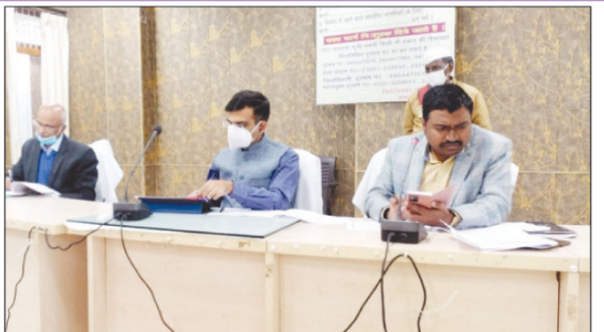
बैठक में उपस्थित कमिश्नर डीएम व उपस्थित विभिन्न विभाग के अन्य अधिकारी व जनप्रतिनिधि

कौशाम्बी। रोल प्रेक्षक मण्डलायुक्त ने निर्वाचक नामावलियों के विशेष संक्षिप्त पुनरीक्षण के सम्बन्ध में राजनैतिक दलों के प्रतिनिधियों के साथ सम्राट उदयन सभागार में बैठक की। बैठक में राजनैतिक दलों के प्रतिनिधियों ने मा0 रोल प्रेक्षक/ मण्डलायुक्त को अपनी समस्याओं से अवगत कराया, जिस पर मण्डलायुक्त ने कहा कि समस्याओं को लिखित रूप में उपलब्ध करा दिया जाय। उन्होंने राजनैतिक दलों के प्रतिनिधियों को आश्वस्त किया है कि उनकी सभी समस्याओं का समाधान अवश्य किया जायेगा। उन्होंने कहा कि निष्पक्ष एवं पूरी पारदर्शिता के साथ चुनाव कराना हमारी पूर्ण जिम्मेदारी है। उन्होंने कहा कि निर्वाचक नामावलियों के विशेष संक्षिप्त पुनरीक्षण में यदि कोई कमी पायी जाती है तो उसका शत-प्रतिशत निस्तारण अवश्य किया जायेगा। बैठक में जिलाधिकारी द्वारा राजनैतिक दलों के प्रतिनिधियों को विधानसभावार प्राप्त फार्म-06, 07 एवं 08 के सम्बन्ध में विस्तृत जानकारी दी गयी।