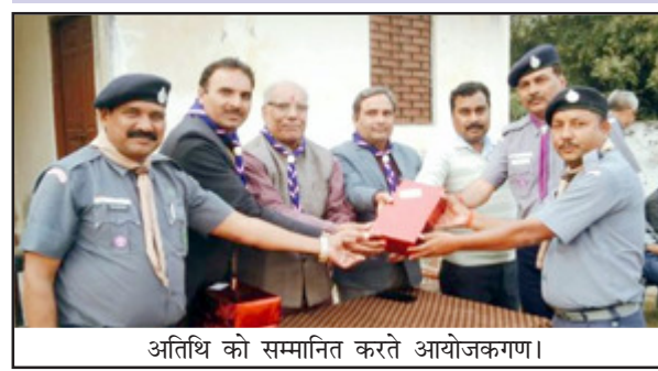
अतिथि को सम्मानित करते आयोजकगण।

तिलक कालेज में चल रहे स्काउट गाइड प्रशिक्षण शिविर का हुआ समापन