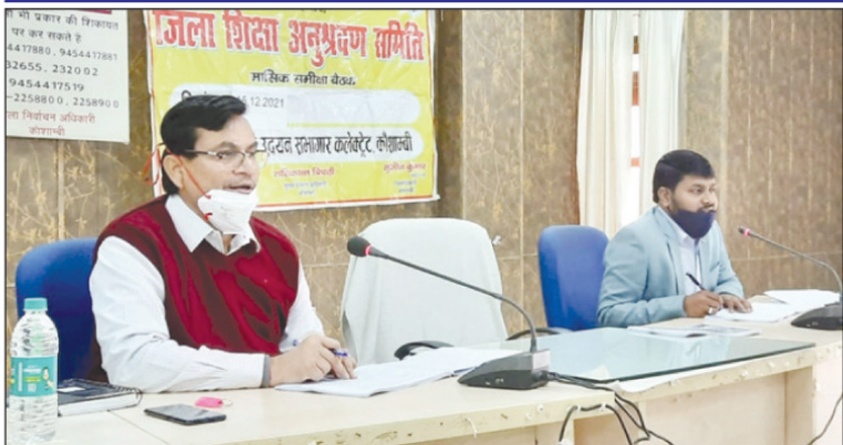
बैठक में उपस्थित लोगों को संबोधित करते मुख्य विकास अधिकारी व उपस्थित विभिन्न विभाग के अधिकारी