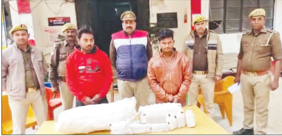
पुलिस की चुपल में मिलावटी शराब बेचने वाले सेल्समैन