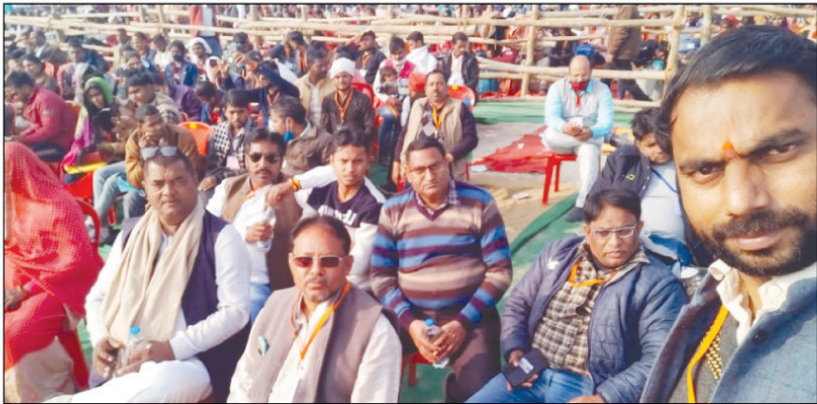
लखनऊ में रैली में उपस्थित प्रधान संघटन