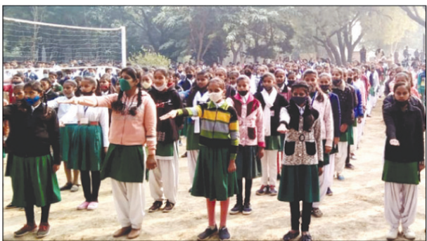
स्कूल के छात्र ने चलाया मतदाता जागरूकता का संकल्प कार्यक्रम