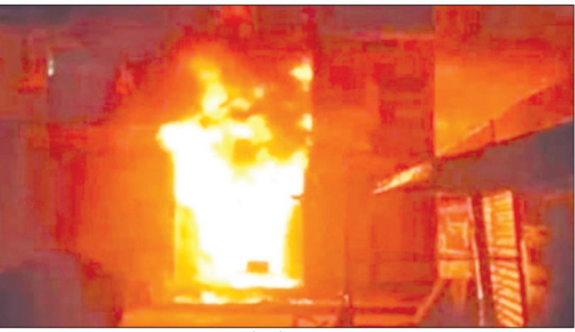
दुकान में लगी आग का दृश्य