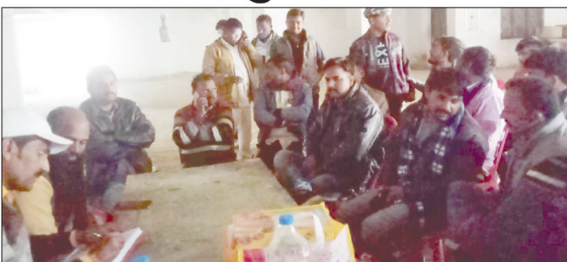
बैठक करते जेसीबी संचालक

इस मौके पर बोलते हुए उन्होंने कहा कि आज इस तरीके से संगठन के सभी लोग एकजुट हो ऐसे ही संगठन के किसी सदस्य पर हो रहे अनैतिक शोषण के खिलाफ खड़े होकर आवाज उठाएंगे। संगठन की एकता जरूरी है एक-एक सदस्य संगठन के लिए महत्वपूर्ण है ऐसे संगठन के सभी पदाधिकारियों को अपने कर्तव्यों का निर्वाहन करना होगा। उन्होंने कहा कि प्रशासनिक अधिकारी अवैध तरीके से जेसीबी संचालकों का शोषण