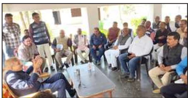
भारत जोड़ो न्याय यात्रा की तैयारियों की समीक्षा करते प्रमोद तिवारी।

लालगंज, प्रतापगढ़। राज्य सभा में विपक्ष के उप नेता प्रमोद तिवारी ने राहुल गांधी के नेतृत्व में भारत जोड़ो न्याय यात्रा को देश के संवैधानिक मूल्यों की रक्षा को लेकर ऐतिहासिक करार दिया है। शनिवार को रामपुर खास के दौरे पर आये विपक्ष के उपनेता प्रमोद तिवारी ने उन्नीस फरवरी सोमवार को यहाँ आ रही भारत जोड़ो न्याय यात्रा को लेकर सांगीपुर तथा लालगंज में कार्यकर्ताओं के साथ तैयारियों की समीक्षा की।