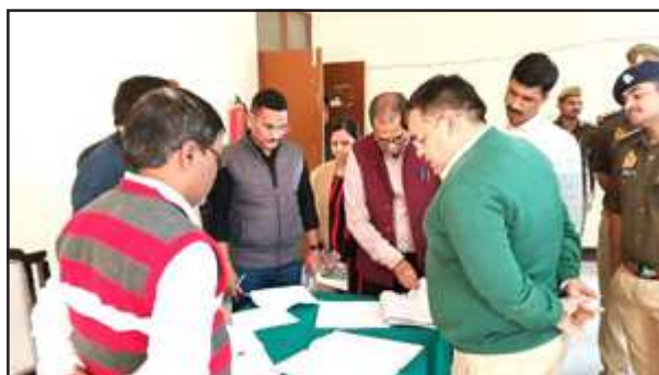
पट्टी तहसील का निरीक्षण करते जिलाधिकारी संजीव रंजन।

जिलाधिकारी ने उपजिलाधिकारी कक्ष में बैठकर विभिन्न रजिस्टरों खतौनी, पट्टा रजिस्टर, सत्यापन रिपोर्ट, आईजीआरएस, नीलापी, मत्स्य पालन रजिस्टर, भूमि आवंटन, वृक्षारोपण आदि का अवलोकन किया गया। जिलाधिकारी ने सम्पूर्ण समाधान दिवस व जनसुनवाई के दौरान जो शिकायतें प्राप्त हुई थी उनकी फाइलों को देखा कि कितनों का निस्तारण किया गया है, सम्पूर्ण समाधान दिवस एवं जनसुनवाई के निस्तारण के प्रकरण को स्थिति ठीक नहीं पायी गयी, जिस पर जिलाधिकारी ने नाराजगी व्यक्त करते हुये तहसीलदार पट्टी को निर्देशित किया कि कार्यप्रणाली में सुधार लाये अन्यथा की स्थिति में कार्यवाही की जायेगी। उन्होंने कम्प्यूटर कक्ष में जाकर व्हासट एवं