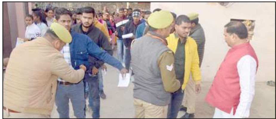
परीक्षा केन्द्र पर अभ्यर्थियों की गेट पर तलाशी लेते शिक्षकगण।