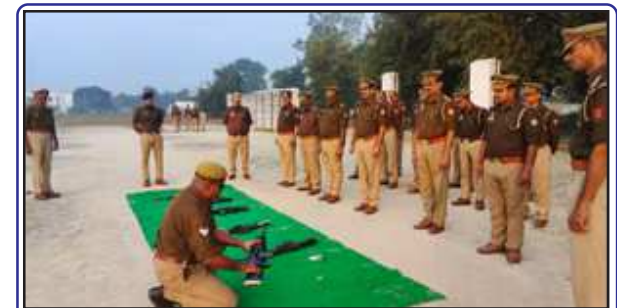
शस्त्र अभ्यास करती पुलिस।

मोबाइल फोन पर बात नहीं करने, हमेशा एम्ब्लेन्स और फावर विग्रेड एवं अन्य आवश्यक आकस्मिक सेवाओं से सम्बन्धित गाडियों को पहले जाने के लिए रास्ता देने, सड़क दुर्घटना में पीड़ितों की मदद के लिए सदैव तत्पर रहने का शपथ दिलाया गया।