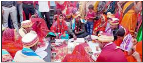
सामूहिक विवाह का आयोजन।