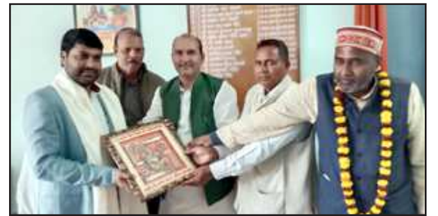
बीएसए से मुलाकात करते शिक्षक संघ।