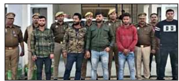
लूट की कार के साथ पकड़े गए आरोपी।