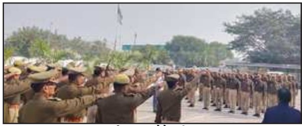
यातायात की शपथ लेते पुलिस जवान।

कौशाम्बी। प्रदेश की यातायात व्यवस्था को सुचारू रूप से संचालित करने तथा आम जनमानस को यातायात नियमों के पालन हेतु जागरूक करने के उद्देश्य से सड़क सुरक्षा के सम्बन्ध में पुलिस अधीक्षक द्वारा पुलिस कार्यालय में उपस्थित समस्त पुलिस अधिकारी कर्मचारियों को यातायात नियमों का पालन करने हेतु शपथ दिलायी गयी इसी क्रम में समस्त क्षेत्राधिकारी कार्यालयों व जनपद के प्रत्येक थानों एवं चौकियों पर पुलिस बल सहित आम नागरिकों को रसदक पर वाहन चलाने से पहले सभी सुरक्षा