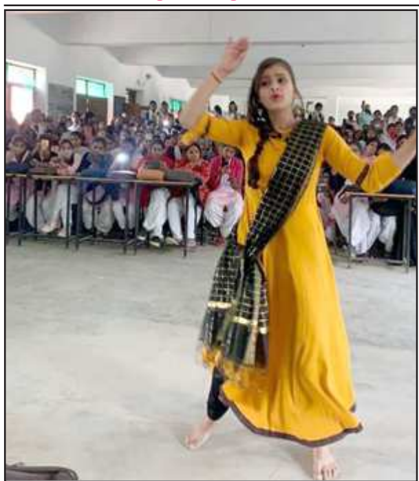
एमडीपीजी कालेज में आयोजित युवोत्सव-2022 में कला का प्रदर्शन करती छात्रा।