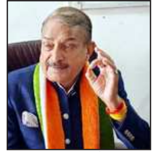
राज्यसभा सदस्य प्रमोद तिवारी।

श्री तिवारी ने कहा कि गुजरात में बीजेपी तथा दिल्ली में नगर निगम चुनाव में आम आदमी पार्टी तथा हिमांचल प्रदेश में कांग्रेस पार्टी की निर्णायक विजय के साथ छत्तीसगढ़, बिहार, उड़ीसा एवं उत्तर प्रदेश में हुए उप चुनाव के परिणामों से यह तस्वीर उभरी है कि अब देश का मतदाता बीजेपी का विकल्प ढूँढ रहा है। उन्होंने कहा कि इन चुनावों के मिले ताजा परिणामों से यह साफ हो गया है