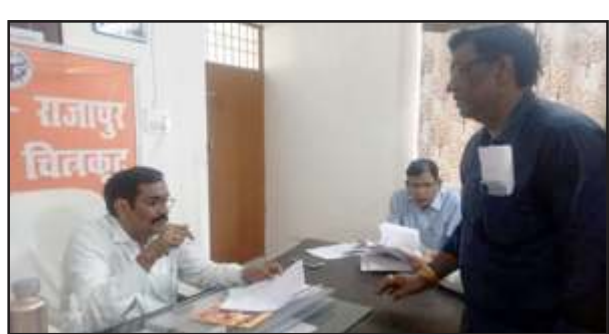
एसडीएम को जापान देते समाजसेवी।

राजापुर/चित्रकूट। समाजसेवियों ने विद्युत समस्या पर एसडीएम राजापुर को सौंपे जापान में विद्युत आपूर्ति दुरुस्त कराने की मांग की है। तुलसी जन्मस्थली राजापुर समेत ग्रामीण क्षेत्रों में विद्युत विभाग के अधिकारियों व कर्मचारियों की लापरवाही से कस्बे समेत ग्रामीण क्षेत्रों की विद्युत की आंख-मिचैली से कई दिनों से उमस भरी गर्मी में लोग परेशान हैं।