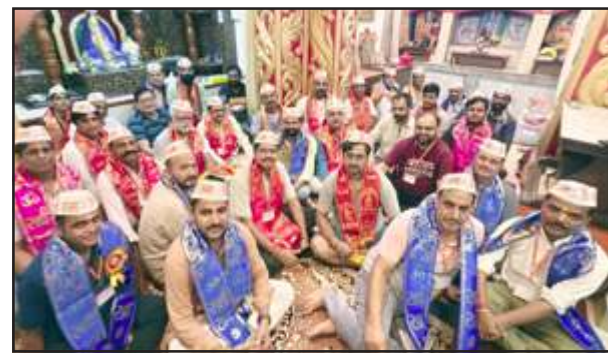
साईनाथ महोत्सव तैयारी बैठक में मौजूद पदाधिकारी।

कोर कमेटी की अंतिम तैयारी व समीक्षा बैठक बुधवार देर रात तक चली। इसमें भक्तों के सुझाव को फाइनल किया गया। सर्वसहमति से सारी रूपरेखा तय की गई।