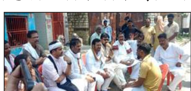
पीडित से बात करते कांग्रेसियों का प्रतिनिधि मंडल।