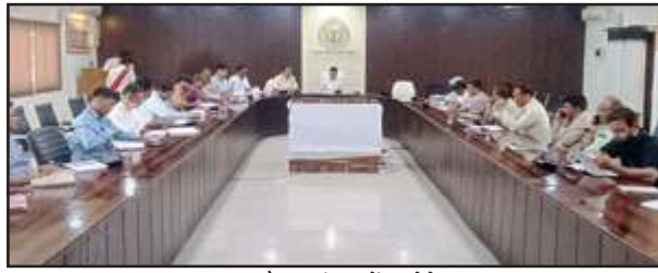
बाढ़ बाबत बैठक में निर्देश देते डीएम।

चैकियां बनाई गई हैं। गुरुवार को कलेक्ट्रेट सभागार में बैठक की अध्यक्षता करते हुए जिलाधिकारी शिवशरणप्पा जीएन ने एडीएम से कहा कि तहसील क्षेत्र के बाढ़ प्रभावित गांव का भ्रमण कर प्रभावित आबादी का आंकलन करें। देखें कि कितने पशु बाढ़ से प्रभावित होते हैं। व्यवस्था कराकर राहत दिलाई जाये। गांव में गोताखोर व नाव की व्यवस्था कर लें। गोताखोरों के नाम, मोबाइल नंबर समेत सूचना रहे। उन गांव में कर्मचारियों की नियुक्ति करें। जिनमें बाढ़ दौरान