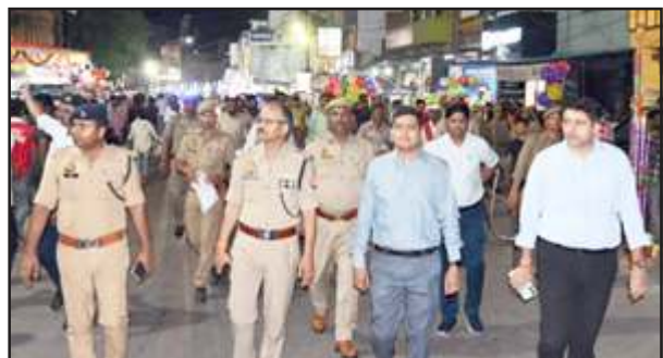
मोहरम में शहर में भ्रमण करते डीएम-एसपी।