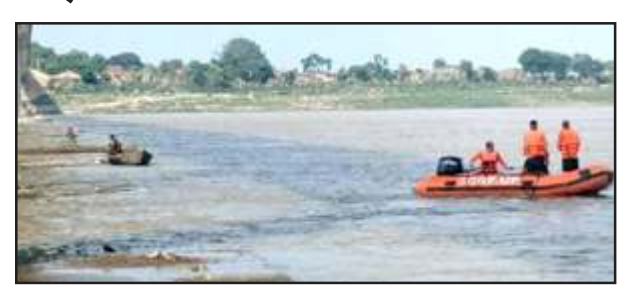
यमुना से निकले शव।

मऊ/चित्रकूट। बुधवार को कोतवाली कर्वी के रंगौली की रहने वाली ननद व भाभी की मऊ घाट में यमुना नदी में माई विजयन दौरान गहरे पानी में जाने से डूबकर मौत हो गई थी। यमुना नदी में काफी प्रयास के बाद शव की खोजबीन में एसडीआरएफ को सफलता मिल गई। गुरुवार को पूर्वान्ह 11 बजे एसडीआरएफ प्रभारी सूरज सिंह की अगुवाई में टीम ने ननद-भाभी के शव को खोज निकाला। गुरुवार को प्रत्यक्षदर्शियों के अनुसार जिस जगह पिटर नम्बर 33 के पास ननद-भाभी के डूबने की बात कही थी। ठीक उसी जगह