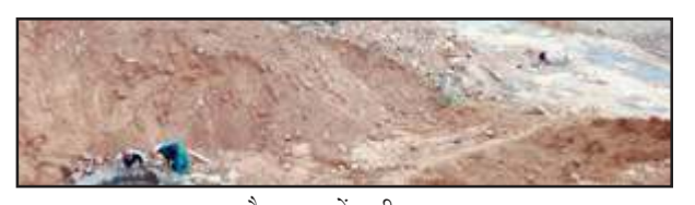
अवैध डम्प में पड़ी बालू।