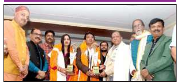
पीसीएस टॉपर को सम्मानित करते अतिथिगण।

को सफलता के उच्च मुकाम पर पहुंचाने में एक अहम किरदार