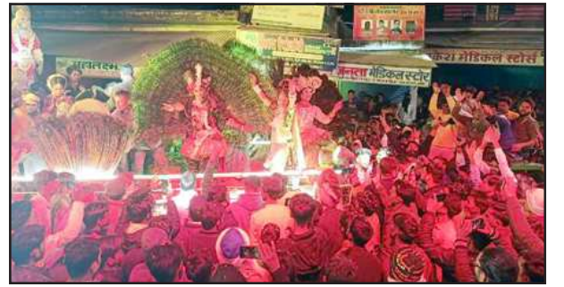
भरत मिलाप पर झांकी का प्रदर्शन करते कलाकार।