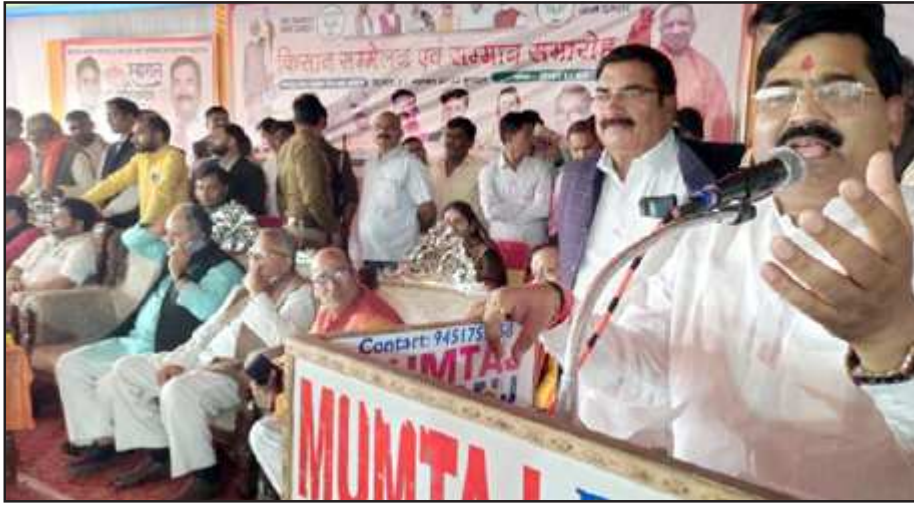
किसान सम्मेलन में बोलते सांसद संगम लाल गुप्ता।