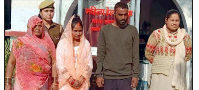
कोतवाली परिसर में एक दूसरे के हुए प्रेमी युगल।

बनाता चला आ रहा है। बीते इस्कीस नवम्बर को वह शाम को उसके घर आया और उसकी बेटी को बहला-फुसला कर लेकर चला गया। जब वह घर आई तो बेटी को न देखकर सन्न रह गई।