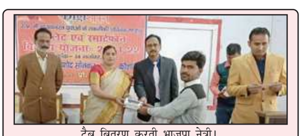
टैब वितरण करती भाजपा नेत्री।

प्रतिभागियों ने अपने लेखन कौशल का प्रयोग करते हुए अलग अलग कहानियां लिखते हुए प्रस्तुत किया। कहानी लेखन के लिए प्रतिभागियों को निर्धारित डेड लाइन दिए गए थे इस मौके पर डायट के सभी वरिष्ठ प्रवक्ता, प्रवक्ता उपस्थित रहे।