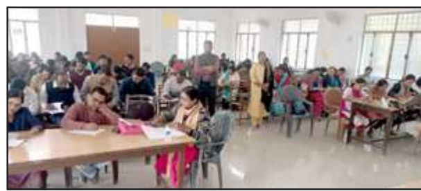
बाल कहानी प्रतियोगिता में शामिल शिक्षक।

कौशाम्बी बेसिक शिक्षा परिषद द्वारा आयोजित बाल कहानी लेखन प्रतियोगिता में जनपद प्रथम, कोविड 19 जागरूकता, पशु पक्षियों, पर्यावरण जागरूकता संदेश पर प्रतिभागियों ने स्वरचित कहानियों का लेखन कर अपने अंदर छुपे बाल कहानीकार का परिचय दिया। हिंदी विषय प्रवक्ता अरमा