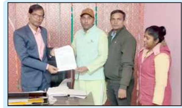
जापान सौंपते शिक्षक नेता।

तरीके से खेल खेला जा रहा है मतदाता सूची के नाम पर वसूली के चलते करखे के लोगों में जबरदस्त आक्रोश व्याप्त है। चेकिंग के दौरान की गई कार्यवाही कौशाम्बी। पुलिस अधीक्षक के निर्देश के क्रम में जनपद स्तर पर विभिन्न थानों व यातायात पुलिस द्वारा यातायात नियमों का पालन न करने वालों के विरुद्ध सघन चेकिंग की गई एवं चेकिंग के दौरान दो पहिया व चार पहिया वाहनों को चेक किया गया जिसमें यातायात नियमों का उल्लंघन करने वाले 447 वाहनों का ई-चालान किया गया तथा 05 वाहन से 2500 रुपए सम्मन शुल्क वसूला गया।