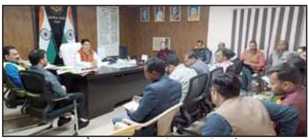
बैठक करते मुख्य विकास अधिकारी।