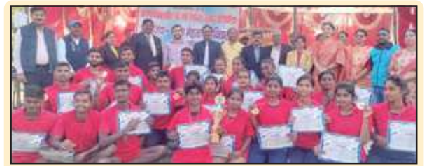
प्रमाण पत्र के साथ खो खो टीम के छत्र।

कर्मचारी और अधिकारी मालामाल हो रहे हैं वाहनों के दुरुपयोग के मामले की उच्चस्तरीय जांच कराई गई तो कई चेहरे बेनकाब होंगे और कई लोगों पर कठोर कार्यवाही की उम्मीद लगाई जाती है लेकिन क्या योगी सरकार में स्वास्थ्य विभाग में बड़े भ्रष्टाचार पर स्वास्थ्य मंत्री मामले को गंभीरता से लेते हुए दौड़ेंगे पर कार्यवाही कर योगी सरकार के भ्रष्टाचार मुक्त शासन को आगे बढ़ाने में सफल होंगे या सब कुछ अंधेरे गर्दी की तरह स्वास्थ्य विभाग कौशाम्बी में चलता रहेगा वाहनों के नाम पर करोड़ों के भुगतान किए जाने के मामले में मुख्य चिकित्सा अधिकारी से बात करने का प्रयास किया गया लेकिन काफी प्रयास के बाद भी उनसे बात नहीं हो सकी है।