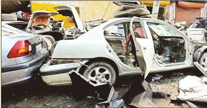
वाहन कबाड़ सुविधाएं या केंद्र खोल सकते हैं।

पॉलिसी पुराने और प्रदूषण फैलाने वाले गाड़ियों को स्टेप वाइज खत्म करने में मदद करेगा। देश के हर जिले में 3 कबाड़ केंद्र खोलने की योजना: हाल ही में गडकरी ने बताया था कि सरकार ने देश के हर जिले में कम से कम तीन रजिस्टर्ड वाहन कबाड़ केंद्र खोलने की योजना बनाई है। उन्होंने कहा कि सड़क मंत्रालय को रोपवे, केबल कार और फनिक्च्युलर रेलवे (केबल रेलवे) के लिए 206 प्रस्ताव मिले हैं। और सरकार हर जिले में तीन पंजीकृत