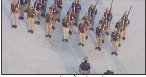
साप्ताहिक परेड की सलामी।