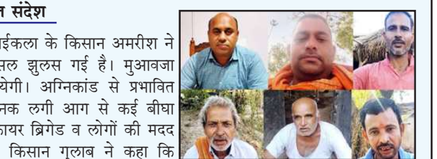
क्या कहते हैं एसडीएम व किसान।