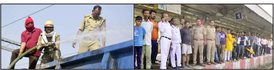
मालगाड़ी में लगी आग को बुझाते फायर ब्रिगेड के कर्मचारी व फ्लेटफार्म पर जमा भीड़।