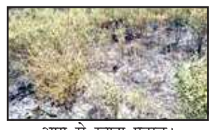
आग से स्वाहा फसल।