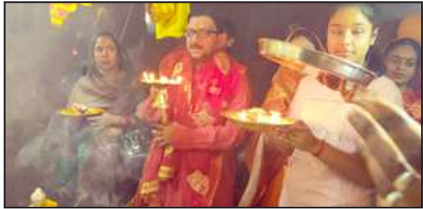
हनुमान मंदिर चिलबिला में पूजन अर्चन करते श्रद्धालु।