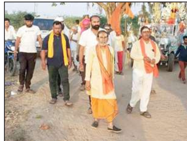
शोभायात्रा निकालते लोग।

सीटें बीजेपी को मिलने के आसार हैं। कर्नाटक में 28 सीटों में दस बीजेपी व 18 कांग्रेस को, तेलंगाना में 17 सीटों में बीजेपी दो व कांग्रेस 11, अदर्स चार सीटें पा रहा है। इस तरह से गुलु मिलाकर लब्धोल्भाव पूरे देश में मोदी की तस्वीर में दरारें दिख रही हैं। बीजेपी पूरे देश में 543 में 178 सीट व 26 दलों का गठबंधन कांग्रेस को 335 सीटें मिलती दिखाई दे रही हैं। अदर्स को 30 सीटें मिलने के आसार हैं। केन्द्र में सरकार बनाने को 272 का आंकड़ा होना चाहिए, ऐसे में कांग्रेस की सरकार बनती दिख रही है।