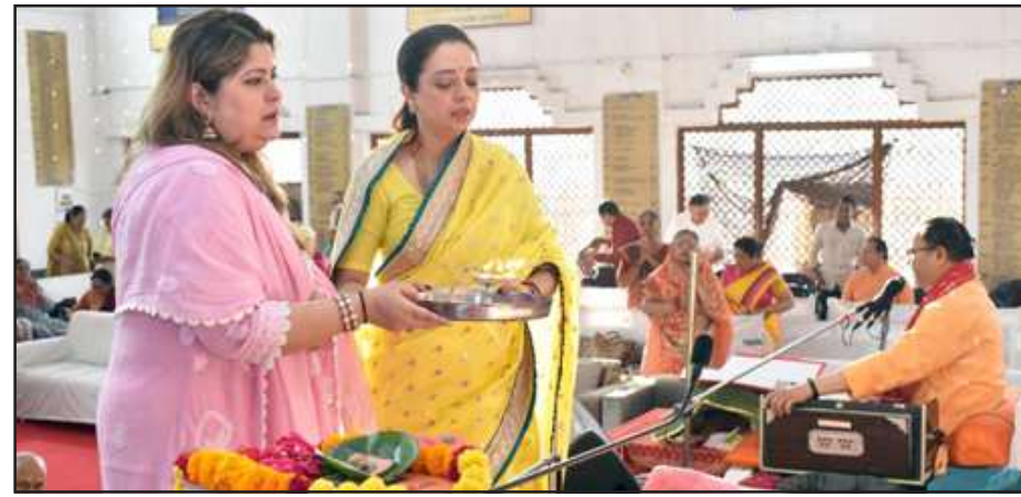
भगवान राम की झांकी व आरती करते श्रद्धालु।