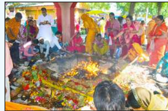
बेल्हा देवी मंदिर में हवन पूजन करते श्रद्धालु।