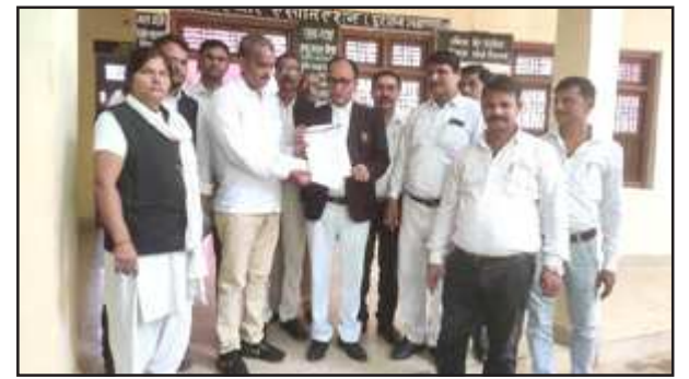
जूबाए के जिलाध्यक्ष को ज्ञापन सौंपते अधिवक्तागण।