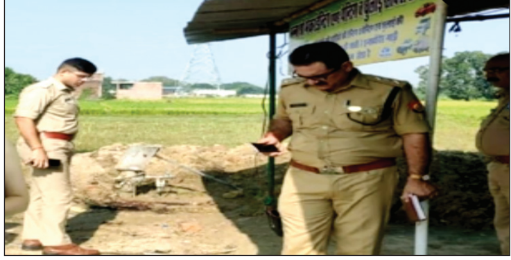
घटना स्थल पर जांच पड़ताल करती पुलिस