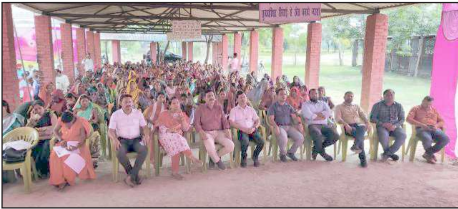
पीएम का सीधा प्रसारण देखते कृषकगण।

परियावा, प्रतापगढ़। एग्री स्टार्टअप कॉन्क्लेव और किसान सम्मेलन दो दिवसीय प्रोग्राम का आयोजन पूसा मेला ग्राउंड में किया गया। इस सम्मेलन के तहत सोमवार को प्रधानमंत्री ने पीएम किसान सम्मान निधि की 12 वीं किस्त रिमोट का बटन दबाकर डीबीटी के माध्यम से जारी की साथ ही 600 प्रधानमंत्री किसान सेवा केन्द्र व एक देश एक उर्वरक जो भारत ब्रांड के नाम से जाना जायेगा की शुरुआत की। कार्यक्रम का उद्घाटन प्रधानमंत्री नरेन्द्र मोदी ने किया। इस कार्यक्रम के तहत किसानों को कृषि से संबंधित नई-नई जानकारी दी गई। साथ ही किसान कृषि क्षेत्र में स्टार्टअप कैसे करें, इसके बारे में भी बताया गया। पीएम मोदी ने उद्घाटन करने के बाद किसानों से