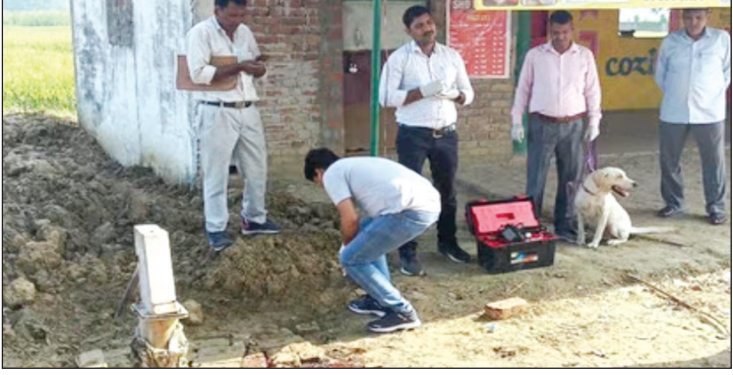
घटना स्थल पर जांच पड़ताल करती पुलिस