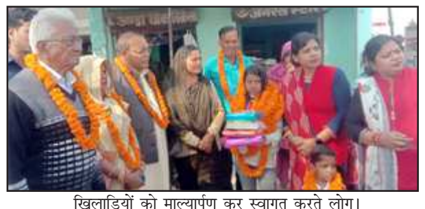
खिलाड़ियों को माल्यार्पण कर स्वागत करते लोग।

अखंड भारत संदेश कौशांबी। जिले के खिलाड़ियों ने कानपुर खेल में जिले का परचम लहराया है खेल में जीत दर्ज करने वाले खिलाड़ियों के वापस आने पर उन्हें माल्यार्पण कर उनका जोरदार स्वागत किया गया है एकल अभियान अभ्युदय यूथ क्लब सम्भाग स्तरीय खेलकूद समारोह कानपुर में आयोजित हुआ जिसमें अंचल कौशांबी से 13 खिलाड़ियों ने बहुत अच्छा प्रदर्शन कर खेल में जीत दर्ज की है जिस पर कौशांबी