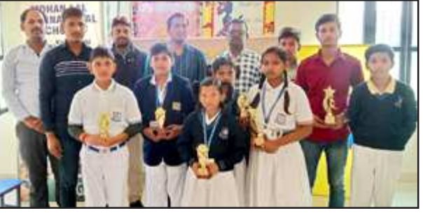
शतरंज खेल में मेडल प्राप्त करने वाले छात्र।