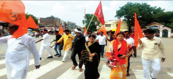
मंदिर में ध्वज लगाने जाते हिंदू जागरण मंच के नेता

पूजा अर्चना किया। मंदिर में पूजा किए जाने से सभी भक्त खुश नजर आए। आसपास के लोगों ने बताया कि केशरवानी समाज द्वारा बनवाया गया यह मंदिर लगभग 300 साल पुराना है लेकिन यहां पर आसपास मुस्लिम बस्ती होने के चलते इसकी देखरेख नहीं हो पा रही है और जमीनों पर अतिक्रमण हो गया है संगठन ने प्रशासनिक अधिकारियों से मंदिर के आसपास