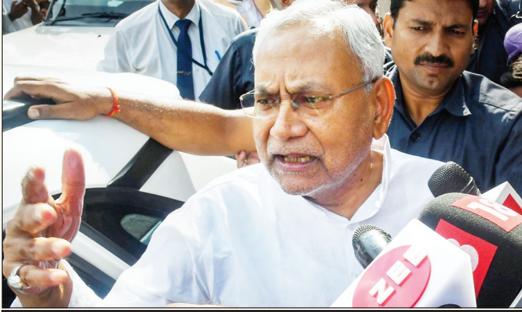
मणिपुर: जदयू के 6 में से 5 विधायक बीजेपी में शामिल

पटना: बिहार के मुख्यमंत्री नीतीश कुमार ने शनिवार को राज्य कार्यकारिणी की बैठक को संबोधित किया। उन्हेोंने कहा कि वह जिस एकजुट विपक्ष पर काम कर रहे हैं, वह 2024 के लोकसभा चुनाव में भाजपा को शिकस्त देगा। हम भाजपा को 2024 में 50 सीटों पर ही समेट देंगे। राज्य कार्यकारिणी के बाद अब राष्ट्रीय कार्यकारिणी की बैठक होगी। पार्टी की एक विज्ञापित के मुताबिक, मुख्यमंत्री ने 2020 के विधानसभा चुनावों में जदयू की हार को भाजपा की साजिश बताया और सीटों में आई गिरावट के लिए भी पुराने साथों को जिम्मेदार ठहराया। उन्हेोंने उस बात को फिर से याद किया जब उन्हेोंने कम सीटों की वजह से दोबारा सीएम बनने के लिए अनिच्छा जताई थी। विज्ञापित में यह भी कहा गया कि विधानसभा चुनाव के परिणामों ने अविश्वास के बीज बोए और विश्वास का संकट उस वक्त और गहरा गया, जब जदयू के पूर्व अध्यक्ष आरसीपी सिंह ने भाजपा के साथ मिलकर पार्टी के खिलाफ साजिश रची। नीतीश कुमार ने कहा कि यदि सभी विपक्षी दल एक साथ लड़ते हैं, तो भाजपा को लगभग 50 सीटों पर समेट दिया जाएगा। मैं खुद को उस अभियान के लिए समर्पित कर रहा हूँ। नीतीश कुमार अपने इन्हीं राजनीतिक प्रयासों के तहत तीन दिवसीय दौरे पर सोमवार को दिल्ली पहुंचेंगे। लगभग तीन दशकों तक भाजपा के सहयोगी रहे दिग्गज नेता ने अपनी पार्टी के कार्यकर्ताओं को भी चेतावनी दी। उन्हेोंने कहा कि भाजपा राज्य में सामाजिक और सांप्रदायिक सौहार्द बिगाड़ने की कोशिश करेगी। हमें पंचायतों के स्तर पर निगरानी रखकर उनके मंसूबों को नाकाम करना होगा। मुख्यमंत्री नीतीश कुमार विपक्ष को एकजुट