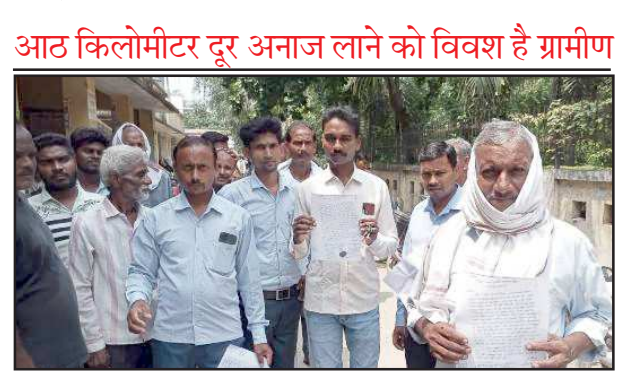
कोटे के चयन के खिलाफ प्रदर्शन करते ग्रामीण।

के अवसर पर पट्टी तहसील में पहुंचे ग्रामीणों ने इस संबंध में प्रार्थना पत्र दिया जिसमें ग्रामीणों ने आरोप लगाया कि धनगढ़ सराय छिवलहा गांव में दो साल पहले कोटे को निर्वाचित