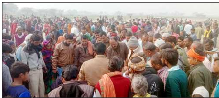
अधेड़ की लाश मिलने पर छानबीन करती पुलिस।