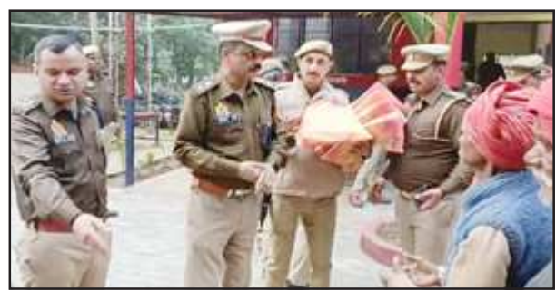
हथिगवां थाने में चौकीदारों को कम्बल बांटते एसपी।