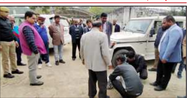
जिला जज के निरीक्षण के दौरान ईंट व मोरंग का सेम्पल करते न्यायिक अधिकारी।

सीनियर डिवाजन सिविल जज के न्यायिक कक्ष तथा कार्यालय एवं शौचालय आदि में कार्यदायी संस्था द्वारा पीली ईंट लगाये जाने व खराब मोरंग का प्रयोग किये जाने की शिकायत की। परिसर में पीली ईंट डम्प देख जिला जज कार्यदायी