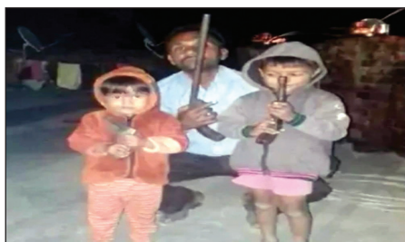
अवैध असलहा की ट्रेनिंग लेते नाबालिग अबोध बच्चे

कोखराज थाना क्षेत्र के एक गांव में सक्रिय है अपराधियों की गैंग तैयार करने वाले गिरावे के सदस्य