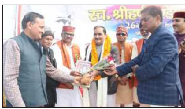
अतिथिगण का स्वागत करते आयोजकगण।