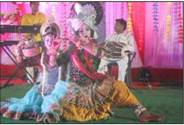
सांस्कृतिक कार्यक्रम प्रस्तुत करते कलाकार।