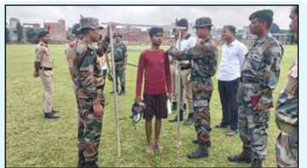
बच्चों की लम्बाई की जांच करते अधिकारी।