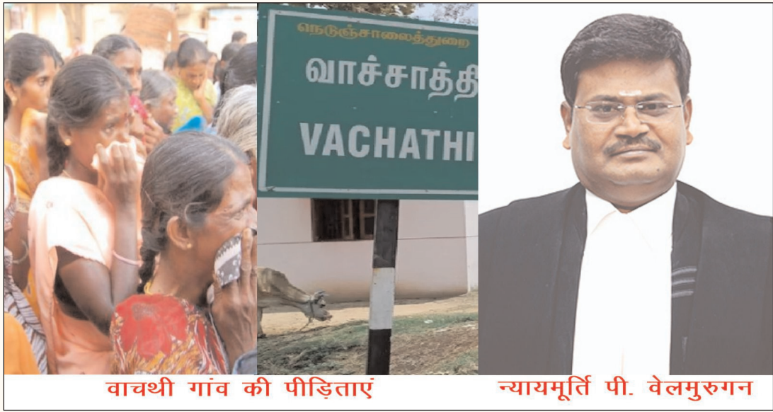
वाचथी गांव की पीड़िताएं

यह शौर्यगाथा है तमिलनाडु के पूर्वी घाट के खड्ड में स्थित मनोरम चित्तेरी पहाड़ियों के वनाच्छादित गांव वचथी की। जनपद धर्मपुरी के इस नन्हे से गांव का तस्करा शुरु होता है 20 जून 1992 की शाम को। गोधूलि पर। पुलिसवाले कुख्यात तस्कर मुनिस्वामी वीरप्पन की तलाशी में आए थे। यह आतंकी और डाकू चंदन के पेड़ काटकर बेचने के अलावा, राजनेताओं का अपहरण करना और फिरती बटोरने में लिप्त रहा। पुलिस और राजस्व अधिकारियों ने वचथी गांव पर छापा मारा। घरों में अंधाधुंध तोड़फोड़ की। वृद्धों, महिलाओं और बच्चों को बेरहमी से पीटा गया। उनके घरेलू सामान और कृषि उपकरण नष्ट कर डाले। करीब 18 महिलाओं को एक सुनसान जगह पर ले जाया गया। उनके साथ बलात्कार किया गया। हृदय हिंदू दैनिक ने फोटो भी छपी थी। यह आदिवासी गांव तालुक मुख्यालय हरूरु से 17 किमी दूर स्थित है। गांव की कुल जनसंख्या 1992 में 655 थी, केवल 12