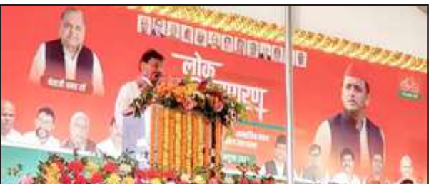
प्रशिक्षण शिविर में बोलते पूर्व मंत्री शिवपाल यादव।

प्रतापगढ़। समाजवादी पार्टी का प्रशिक्षण कार्यक्रम आज राजकीय इंटर कालेज में शुरू हो गया। शाम को सपा मुख्या व प्रदेश के पूर्व मुख्यमंत्री अखिलेश यादव के भी पहुंचने का कार्यक्रम है। वैसे प्रशिक्षण में वह कल ही मुख्य रूप से भाग लेंगे। अखिलेश यादव आज यहां देर शाम आने पर लोक निर्माण विभाग में रात रुकेंगे और पांच अक्टूबर को दिन में 11 बजे वह प्रशिक्षण स्थल पर पार्टी कार्यक्रमों को सम्बोधित करेंगे।