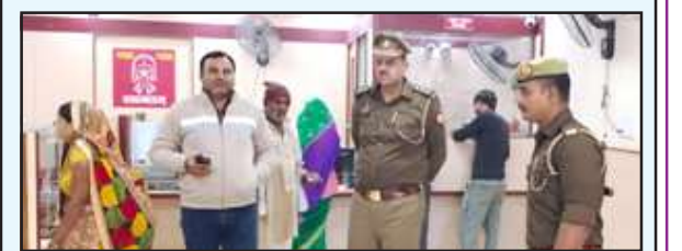
बैंकों में निरीक्षण करती पुलिस।