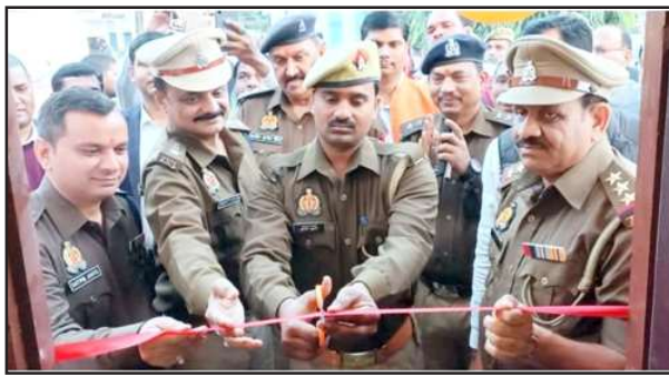
जनसुनवाई कक्ष के उद्घाटन अवसर पर मौजूद एसपी व अधिकारी।

इस उद्घाटन समारोह में शामिल ग्राम प्रहरियों को शीतकालीन वस्त्र वितरित किया गया व ग्राम प्रहरियों