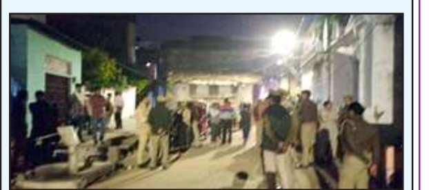
मृतक के घर में मौजूद पुलिस।