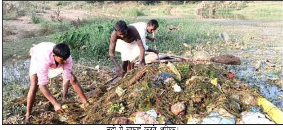
नदी में सफाई करते श्रमिक।

चित्रकूट। बुदेली सेना की मांग पर सिंचाई विभाग ने एक नाव व तीन श्रमिकों से पुलघाट कर्वी में सफाई कराई। विसर्जन घाट से कई ट्रेक्टर मलबा बाहर निकाला। नाव से नदी में तैरने वाले प्लास्टिक कचरे-पालीथिन व चोई की सफाई हुई। सोमवार को सफाई अभियान के पांचवें दिन बुदेली सेना