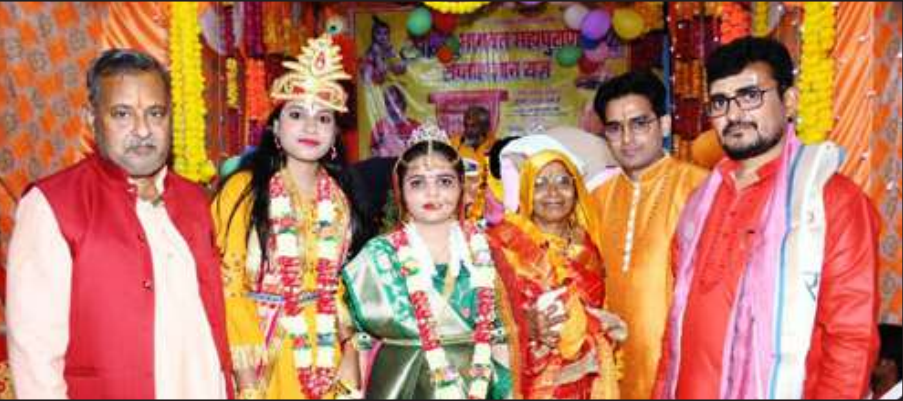
श्रीकृष्ण-रुक्मणी विवाह का दृश्य।