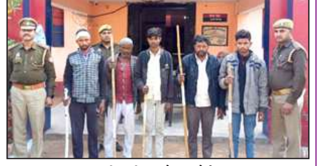
पुलिस गिरफ्त में हत्यारोपी।