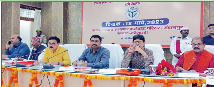
बैठक को संबोधित करते मुख्य विकास अधिकारी

कौशाम्बी। सांसद विनोद सोनकर की अध्यक्षता में उदयन सभागार में जिला विकास समन्वय एवं निगरानी समिति (दिशा) की बैठक सम्पन्न हुई सांसद द्वारा गत दिशा बैठक में दिये गये निर्देशों के अन्तर्गत विभाग से उपस्थित अधिकारी ने बताया कि सांसद के प्रयासों से जनपद के अथसराय रेलवे स्टेशन पर रैक प्लांट बनाने के लिए स्वीकृति मिल गई है तथा रैक प्लांट बनाने का कार्य प्रारम्भ कर दिया गया है रैक प्लांट बन जाने से जनपदवासियों को खाद सहित आदि सुविधाएं शीघ्रता से प्राप्त हों सकेगी। उन्होंने रेलवे विभाग के अधिकारी को जनपद के निर्देश दिये। उन्होंने जिला खनन को अमृत भारत योजना में सम्मिलित कराने के लिए प्रस्ताव तैयार कर रेलवे मंत्रालय, भारत सरकार को प्रेषित करने के निर्देश दिये। उन्होंने जिला खनन अधिकारी से कहा कि खनन से प्रभावित जनपद के 24 ग्रामों में जहाँ-जहाँ पर सामुदायिक भवन नहीं हैं, उन सभी ग्रामों में सामुदायिक भवन के निर्माण के लिए उप जिलाधिकारियों के माध्यम से भूमि विहित