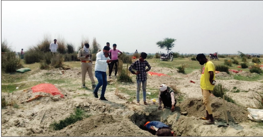
गड्डा खोदकर लाश निकलवाती पुलिस

कौशाम्बी। परिजनों के कहने पर एक माह पूर्व दफन की गई लाश को पुलिस ने सक्षम अधिकारी एवं परिजनों की मौजूदगी में निकालवाकर पोस्टमार्टम हेतु भेजा और उसके पश्चात साक्ष्य संकलित करने में जुट गई। कुछ दिन पहले एक युवक की संदिग्ध परिस्थितियों में मौत हो गई थी जिसके बाद परिजनों ने प्राणीयों के समझे पुलिस को सूचना दिए बिना जल्दबाजी में लाश का अंतिम संस्कार कर दिया। अंतिम संस्कार करने के बाद परिजनों को शक हुआ कि युवक के दोस्तों ने जहर खिलाकर मार डाला। युवक की मौत के पीछे की सच्चाई क्या है जानने के लिए परिजनों ने अधिकारियों के समक्ष उपस्थित होकर दफन की गई लाश