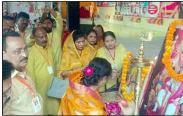
भगवान सहस्रबाहु के चित्र पर माल्यार्पण व पूजन करते मुख्य अतिथि।