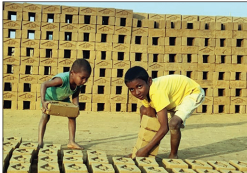
लालगोपालगंज परिक्षेत्र में कच्ची ईंटों की ढुलाई करते बालक तथा क्षेत्र में संचालित ईंट भट्टा।

बाल श्रम या शोषण : बाल श्रम एक अभिशाप है। जो बच्चों के स्कूल जाने का अधिकार छीन रहा है। भट्टा संचालकों के शोषण से मजदूर गरीबी के चक्रव्यूह से बाहर नहीं निकल पा रहा है। एक और 2 जून की रोटी की तलाश में दूसरे जनपदों से आए मजदूर अपने परिवार के साथ मेहनत मजदूरी कर रहा है। बाल मजदूरी एक अभिशाप :