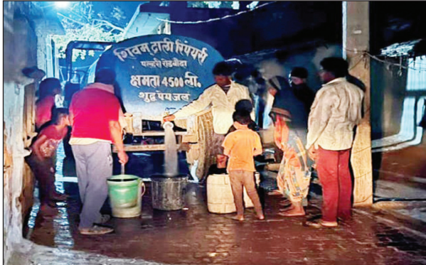
टैंकर से पानी भरते ग्रामीण