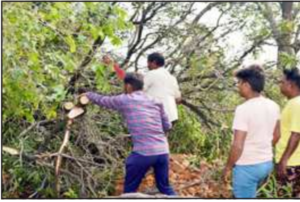
पूरे सुकाल गांव में पेड़ को काटते नगर पालिका कर्मी।

सदर बाजार, पल्टन बाजार, सहेदपुर पूर्वी व पश्चिमी में पानी के टैंकर भेजे गये थे जहां पानी लाने वालों की भीड़ देखी गई।