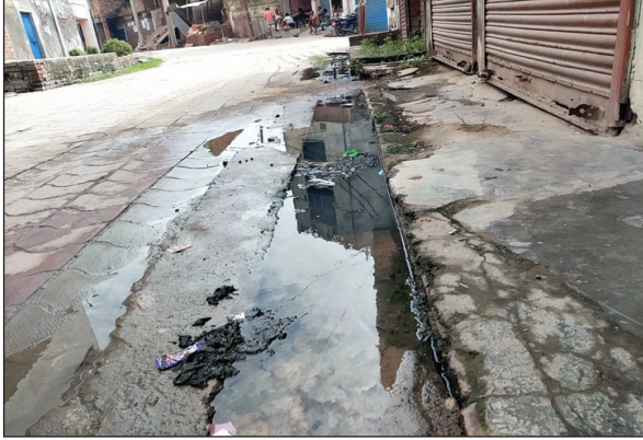
गन्दगी का दृश्य

अडुवा कौशाम्बी। गंदगी व बदलते मौसम की वजह से नगर पंचायत अडुवा क्षेत्र में इन दिनों मच्छरों की भरमार हो रही है हालात यह है कि शाम होते ही लोग घरों के खिड़की दरवाजे बंद करने पर मजबूर हैं ताकि मच्छरों से बचाव हो सके लोग मच्छरों से बचने के लिए अनेक प्रकार के उपाय कर रहे हैं वही नगर पंचायत के जिम्मेदार कान में उंगली लगाकर चैन की बंशी बजाकर सो रहे हैं नगर पंचायत में फॉगिंग मशीन और नालियों में एंटी लारवा का छिड़काव कब हुआ इसकी जानकारी देने वाला कोई मौजूद नहीं नगर पंचायत में इस समय खाऊ कमाऊ नीति का पालन किया जा रहा है जिम्मेदार सरकारी धन का बंदरवांट करने में लगे हुए हैं नगर वासियों के