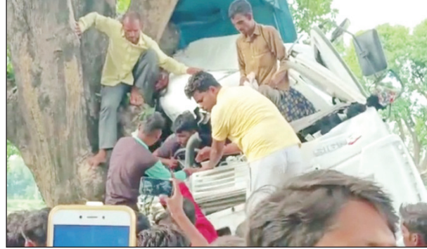
सड़क हादसे में दबे लोको को बाहर निकालते

अडुवा कौशाम्बी। सैनी थाना क्षेत्र के काजीपुर गांव के समीप तेज रफतार गिट्टी लदा डम्पर अनियंत्रित होकर पेड़ से टकरा गया है हादसे में डम्पर क्षतिग्रस्त हो गया है और डंपर के अंदर चालक खलासी फंस गए सूचना पाने के बाद घटनास्थल पर कड़ाधाम पुलिस पहुंची और जेसीबी वा कटर मशीन से डंपर को काटकर चालक खलासी को बाहर निकाला है और इलाज के लिए अस्पताल में भर्ती कराया है क्षतिग्रस्त डम्पर में अंदर डेढ़ घंटे तक घायल ड्राइवर व खलासी फंसे रहे हादसे में घायल चालक खलासी अपना नाम पता नहीं बता पा रहे हैं पुलिस ने घायलों को इलाज के लिए अस्पताल में भर्ती कराया है। घटनाक्रम के मुताबिक शनिवार की सुबह कड़ा धाम