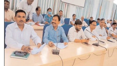
गन्दगी का दृश्य