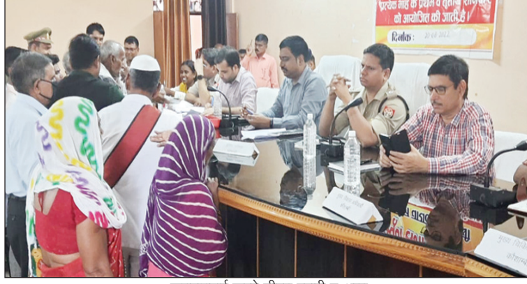
जनसुनवाई करते डीएम एसपी व अन्य