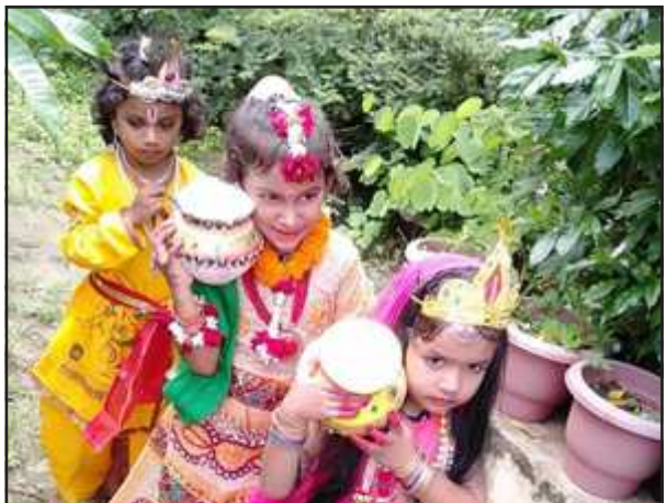
राधा-कृष्ण की वेशभूषा में सजे बच्चे।