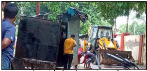
अवैध गुमटियां को हटाने नगर पालिका कर्मी।