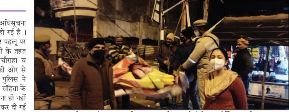
अधिसूचना के बाद प्रशासनिक अमला मुस्तेद सड़कों से बैनर व होर्डिंग हटवाती

जारी। विधानसभा चुनाव 2022 की अधिसूचना जारी होते ही कौंधियारा पुलिस अलर्ट हो गई है। आचार संहिता के अनुपालन के लिए हर पहलू पर बारीकी से नजर रखी जा रही है। इसी के तहत कौंधियारा व जारी कस्बे के प्रमुख चौराहा व विभिन्न मोहल्लों में राजनीतिक दलों की ओर से लगाए गए होर्डिंग व बैनर को जारी पुलिस ने उतरवा दिया। साथ ही लोगों को आचार संहिता के बारे में भी जानकारी दी जा रही है। इतना ही नहीं विधानसभा चुनाव की तारीख भी नियत कर दी गई है। चुनाव आयोग के जारी फरमान के बाद कौंधियारा पुलिस प्रशासन अलर्ट हो गया है। रविवार को कौंधियारा व जारी पुलिस कर्मियों ने सड़क किनारे व सार्वजनिक स्थानों पर लगाए गए चुनाव प्रचार के होर्डिंग व बैनर को उखड़वा दिया। विधानसभा चुनाव 2022 की चुनाव आचार संहिता लागू होने के बाद जारी में चुनाव हलचल और बढ़ गई है शनिवार को आयोग