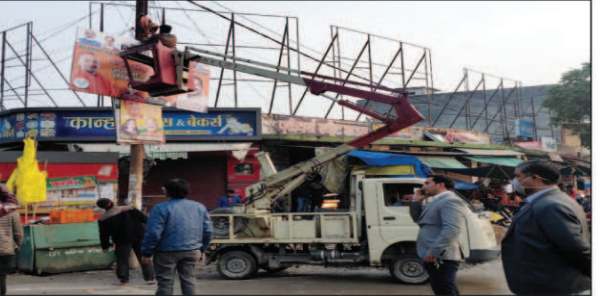
होर्डिंग उतरवाते अधिकारी

अधिसूचना जारी होते ही कौशाम्बी में कर्मचारी जैसीबी ले कर उतर आए और बिजली के पोलों व मकानों पर लगे होर्डिंग हटा दिए. साथ ही हाइवे और रोड से भी होर्डिंग हटाए गए. शनिवार को जैसे ही अधिसूचना आई सार्वजनिक स्थानों पर