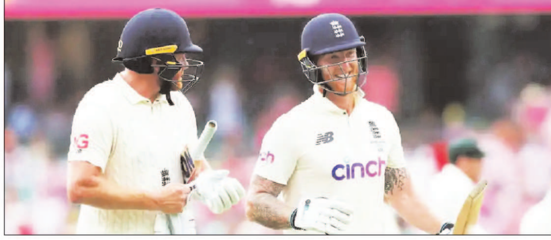
रन का लक्ष्य रखा था, जिसका पीछा करते हुए मेहमान टीम ने अपनी दूसरी इनिंग में 9 विकेट पर 270 रन बनाए।

नई दिल्ली: एशेज सीरीज का चौथा टेस्ट मैच ड्रॉ हो गया है। सीरीज पहले ही हार चुकी इंग्लैंड ने यहां संघर्ष किया और मैच को बचा ले गए। इस मुकाबले में ऑस्ट्रेलिया ने इंग्लैंड के सामने जीत के लिए 388 रनों का लक्ष्य रखा था। लेकिन इंग्लैंड की टीम ने मैच के पांचवें और अंतिम दिन रविवार को 9 विकेट पर 270 रन बनाकर मैच ड्रॉ करा दिया। इस ड्रॉ के साथ ही ऑस्ट्रेलिया की क्लीन स्वीप करने की तमना भी खत्म हो गई है। 5 टेस्ट मैचों की सीरीज में 4 टेस्ट खेल लेने के बाद उसकी जीत का स्कोर अब भी 3-0 ही है। दोनों टीमों के बीच एशेज सीरीज का पांचवां और अंतिम टेस्ट 14 जनवरी से होबार्ट में खेला जाएगा। इस टेस्ट में ऑस्ट्रेलिया ने इंग्लैंड के सामने 388