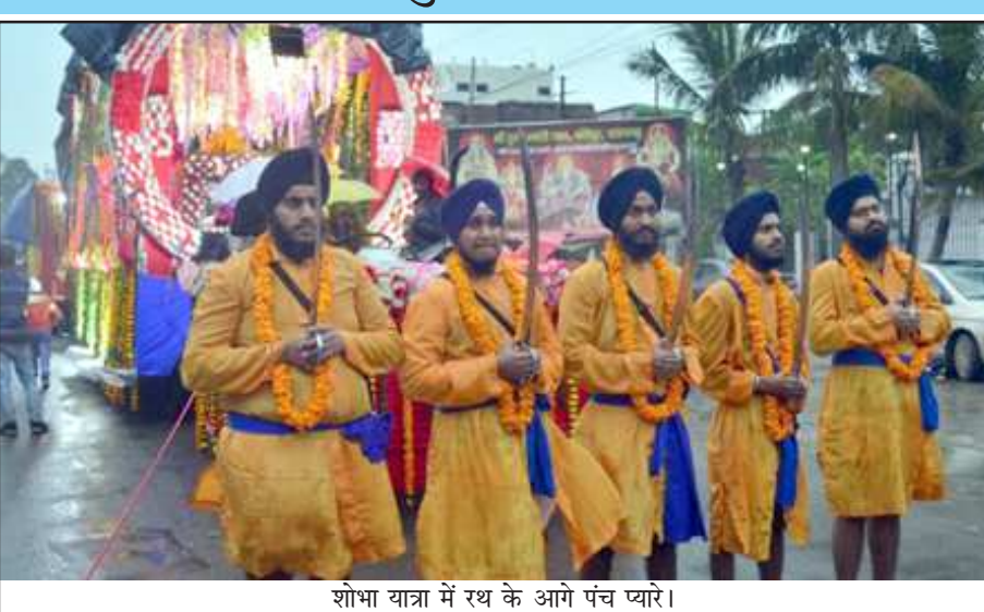
शोभा यात्रा में रथ के आगे पंच प्यार।

शहर में नानकशाही गुरुद्वारा से निकली शोभा यात्रा