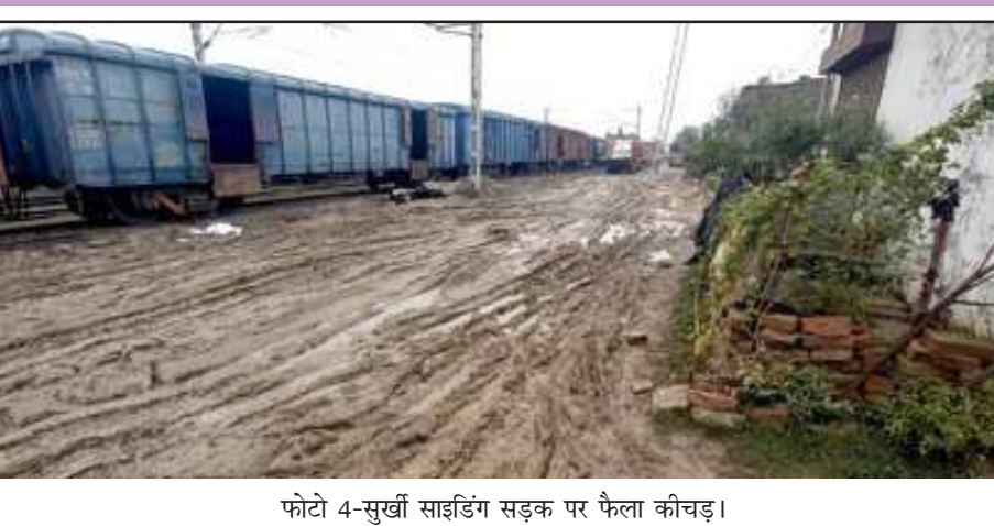
फोटो 4-सुखी साइडिंग सड़क पर फैला कीचड़।

खाद्यान वितरण अचानक बन्द होने से हुई परेशानी