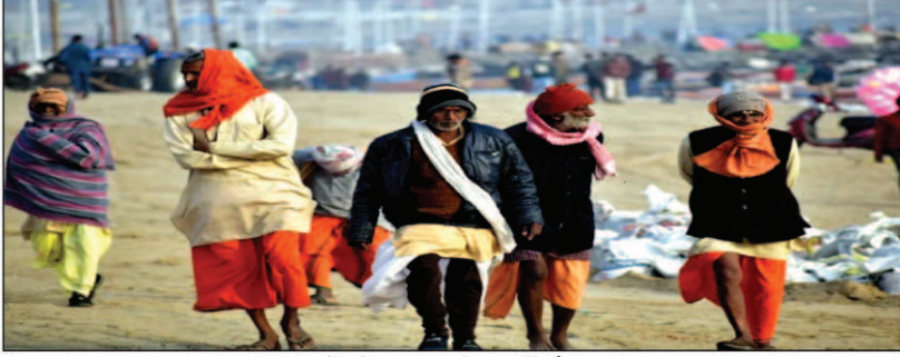
संगम क्षेत्र में स्नान करने जा रहे और श्रद्धालु

चिकित्सा अधिकारी नानक सरन ने मेला क्षेत्र में दो सिपाहियों के संक्रमित होने की पुष्टि की। सोमआने बताया कि अब तक 10 हजार से अधिक संतो-भक्तों की मेला क्षेत्र में जांच की जा चुकी है। स्वास्थ्य विभाग के मेला इंचार्ज जयकिशन ने बताया कि कोरोना संक्रमित मरीजों के पाए जाने के बाद मेला क्षेत्र में सतर्कता बढ़ा दी गई है। संक्रमण और बढ़ा तो उन स्थानों को हॉटस्पॉट के रूप में चिह्नित कर