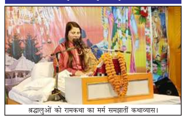
श्रद्धालुओं को रामकथा का मर्म समझाती कथाव्यास।

पक्ष निरूपित किया। रामलला के मनमोहक भजनों के बीच कथाव्यास वैदेही जी ने कहा कि रघुकुल की रीति सदैव प्राणी पर दया और उसके