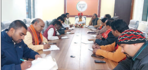
पार्टी के वरिष्ठ पदाधिकारियों के साथ बैठक करते सांसद सुब्रत पाठक

प्रतापगढ़। प्रदेश महामंत्री सांसद कन्नौज सुब्रत पाठक ने आगामी विधानसभा चुनाव प्रबंधन के दृष्टिगत जिला पदाधिकारियों एवं वरिष्ठ कार्यकर्ताओं की बैठक की। उन्होंने चुनाव संचालन समिति से जिले का मिजाज जाना और समीकरण पर चर्चा की। विधानसभा वार जातिमान आंकड़े, उनके मुद्दे और वर्तमान स्थिति भी पूछा। सुब्रत पाठक ने कहा प्रधामंत्री नरेंद्र मोदी और उत्तर प्रदेश के मुख्यमंत्री योगी आदित्यनाथ ने देश एवं प्रदेश में भय एवं भ्रष्टाचार मुक्त शासन दिया है। सुब्रत ने कहा कि उत्तर प्रदेश में 2022 के चुनाव में भाजपा की जीत कार्यकर्ताओं के दम पर होगी और कार्यकर्ता जनता का आशीर्वाद लेकर चुनाव जीतेंगे। न 'बूथ जीता, तो उत्तर प्रदेश जीता' का संकल्प दिया।