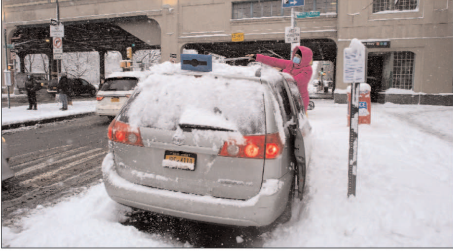
हवाई अड्डे से आने और जाने वाली 300 से ज्यादा उड़ानें रद्द कर दी गईं। फ्लाइंटअवेयर डॉट कॉम के अनुसार, जॉन एफ कैनेडी अंतर्राष्ट्रीय हवाई अड्डे और नेवाक लिबर्टी अंतर्राष्ट्रीय हवाई अड्डे के

न्यूयॉर्क। न्यूयॉर्क शहर और उसके आसपास के इलाकों में भारी बर्फबारी हुई है, जिसके कारण क्षेत्र के अंदर और बाहर सैकड़ों उड़ानें रद्द कर दी गई हैं। नेशनल वेदर सर्विस (एनडब्ल्यूएस) के एक अपडेट के अनुसार, लागार्डिया हवाई अड्डे ने शुक्रवार को जॉन एफ कैनेडी अंतर्राष्ट्रीय हवाई अड्डे पर 5.5 इंच बर्फबारी और नेवाक लिबर्टी अंतर्राष्ट्रीय हवाई अड्डे पर 8.4 इंच बर्फबारी दर्ज की। समाचार एजेंसी सिन्हुआ ने एनडब्ल्यूएस के हवाले से कहा, इस बीच, न्यूयॉर्क शहर के सेंट्रल पार्क में 5.5 इंच की बर्फबारी हुई। फ्लाइंटअवेयर डॉट कॉम के अनुसार, शुक्रवार को लागार्डिया