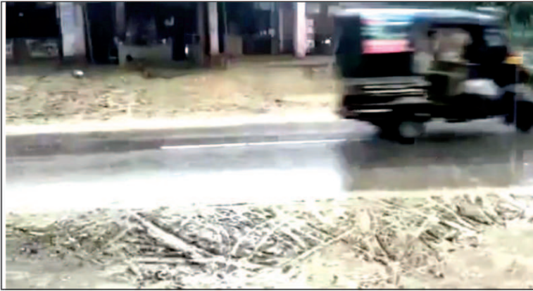
बेमौसम बारिश से सड़कें कीचड़ से सनी आमजत मानस को झेलनी पड़ रही मुसीबत

आवासीय योजना की हकीकत भी खुलकर सामने आ रही है 3 दिनों की बारिश में ही तमाम गरीबों के घर गिर रहे हैं गरीबों के गिरते घर के बाद भी उन्हें मदद करने के बजाय जिम्मेदार अपनी खांभियों पर पटों डालकर अधिकारियों को गुमराह करने पर लगे हैं जनपद मुख्यालय मंझनपुर में सड़क चौड़ाकरण के नाम पर आम जनता के मकानों को ध्वस्त कर दिया गया था जिससे पूरी सड़क नरक में तब्दील हो गई है 3 दिन से लगातार हो रही बारिश से पूरी सड़क में कीचड़ गंदगी से भरी है जिससे आम जनमानस का सड़कों पर निकलना मुश्किल है नगरपालिका मंझनपुर के बद्धतजामी का खामियाजा आम जनमानस भुगत रहा है यही हाल ग्रामीण क्षेत्रों का है जहां मकान गिर रहे हैं लेकिन सचवाई स्वीकार करने से राजस्व कमी भाग रहे हैं जिले में कहीं-कहीं बारिश के साथ ओले भी गिरने की चचाएं हैं जिससे आम जनजीवन बुरी तरह से प्रभावित है जिले के चायल