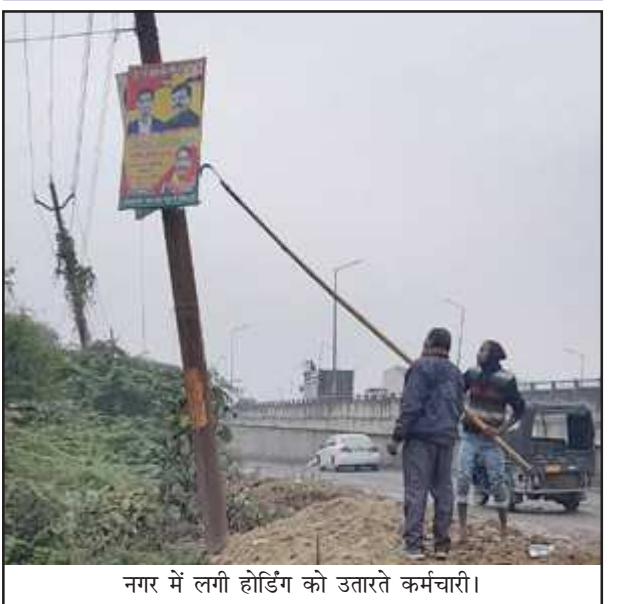
नगर में लगी होर्डिंग को उतारते कर्मचारी।

आचार संहिता लगते ही नवाबगंज पुलिस हुई सक्रिय