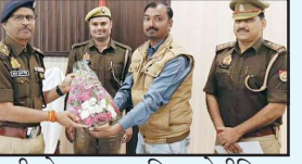
एएसपी को धन्यवाद ज्ञापित करते पीड़ित।