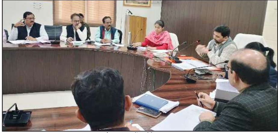
बैठक में निर्देश देते डीएम।