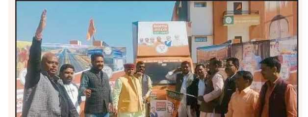
हरी झंडी दिखाकर वैन को रवाना करते जिलाध्यक्ष।