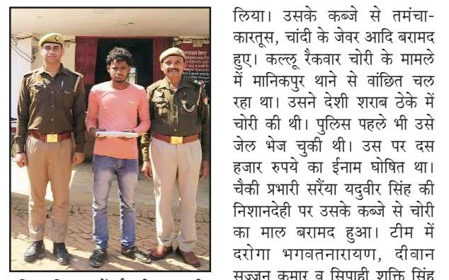
पुलिस गिरफ्त में ईनामी अपराधी।

चित्रकूट। मन्दाकिनी नदी के भैरोंगागा रोड स्थित सुंदर घाट में अराजकतत्वों ने शिवलिंग की जलधारी तोड़ दी है। ढूढ़ने के प्रयास किये जा रहे हैं। अभी तक ये पत्ता नहीं चल सका किसने तोड़ा है। पुलिस प्रशासन भी जांच कर रहा है। बुधवार को शिवलिंग की जलधारी टूटी देखने को मिली। सुन्दर घाट में शाम होते ही अराजकतत्वों का जमावडा शुरू हो जाता है। अंधेरा होने से लोग शराब की बोतले लेकर मंदिर व घाटों की सीढ़ियों में शराब पीते हैं। शराब पीने वाले बोतलें घाटों की सीढ़ियों में तोड़ते हैं। मां मंदाकिनी में बोतलें फेंक देते हैं। शिवलिंग जलधारी टूटने से को लेकर लोगों ने सवाल उठाये हैं। प्रदेश सरकार को सुन्दर घाट की व्यवस्था को उचित प्रबंध करना चाहिए। शराबियों का जमघट दूर करने के प्रयास होने चाहिए।