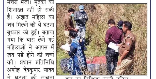
शव का निरीक्षण करती पुलिस।