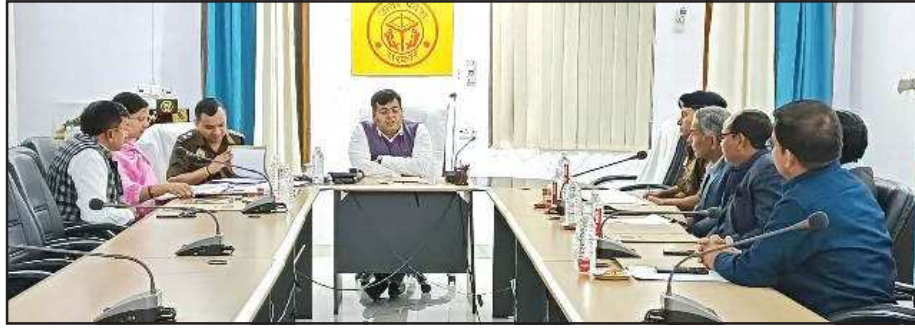
लोकसभा सामान्य निर्वाचन सम्बन्धी बैठक में बोलते जिलाधिकारी।

उन्होंने निर्देशित किया कि अपने अपने क्षेत्र के अन्तर्गत बूथों का भ्रमण कर समस्त व्यवस्थायें पहले से ठीक एवं अपने-अपने अधीनस्थ कर्मचारियों के साथ बैठक करा लें।