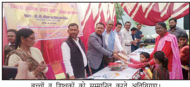
बच्चों व शिक्षकों को सम्मानित करते अतिथिगण।