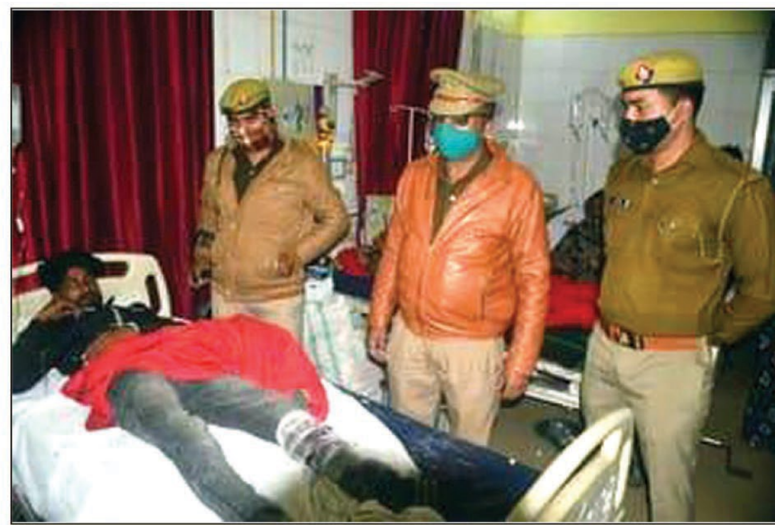
चेकिंग से भागे युवक के पैर पर लगी गोली जख्मी हालत में

पट्टी में सपा कार्यकर्ताओं ने किया रोड शॉ, लगाया जाम, मांग पूरा करने के आश्वासन के बाद समाप्त हुआ जाम, आक्रोशित व्यापारियों ने बंद कराया सब्जी मंडी