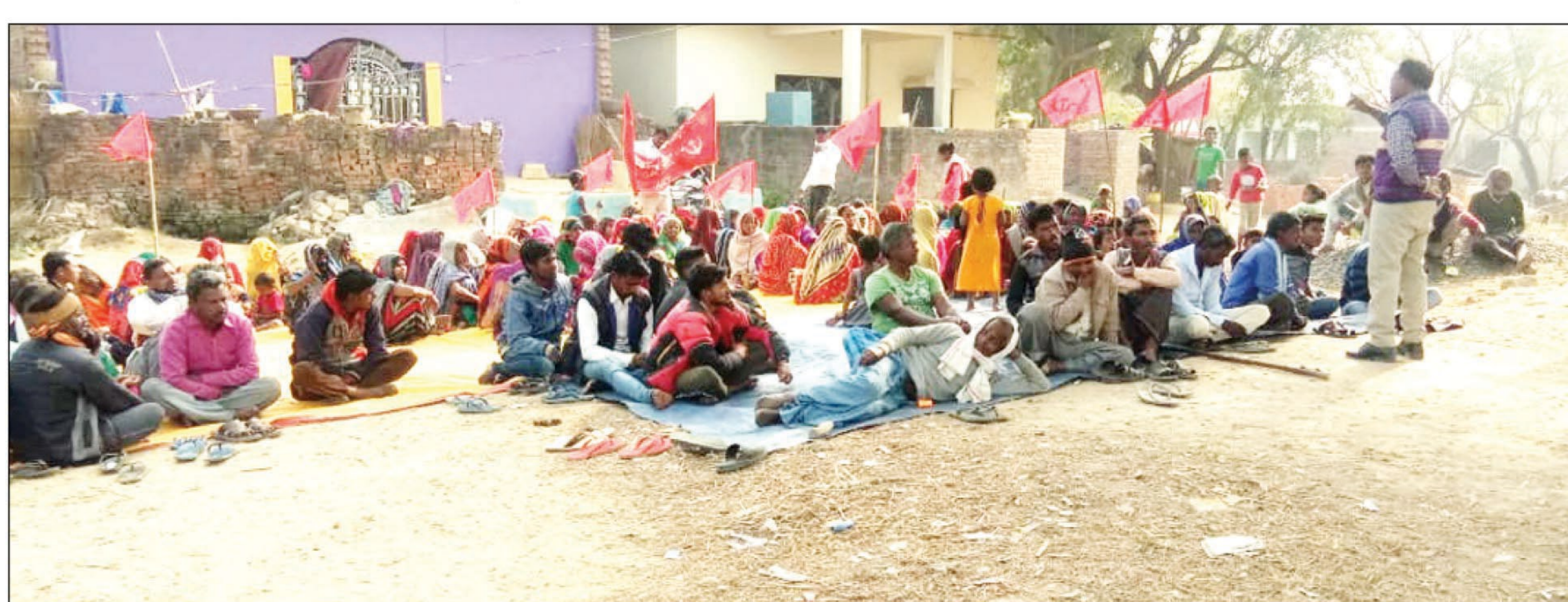
बीकर गाव में सभा करते मनरेगा मजदूर

घूरपुर। अखिल भारतीय किसान मजदूर सभा बीकर गाँव कमेटी ने मजदूरों के रोजगार व मनरेगा में किये काम के पेमेंट को लेकर रविवार के दिन सभा कर चेतावनी दी कि यदि मकर संक्रांति के पहले मनरेगा मजदूरों को बकाया भुगतान नहीं मिला तो ब्लाक जसरा का घेराव कर प्रदर्शन किया जायेगा। मजदूरों ने बताया कि मनरेगा में