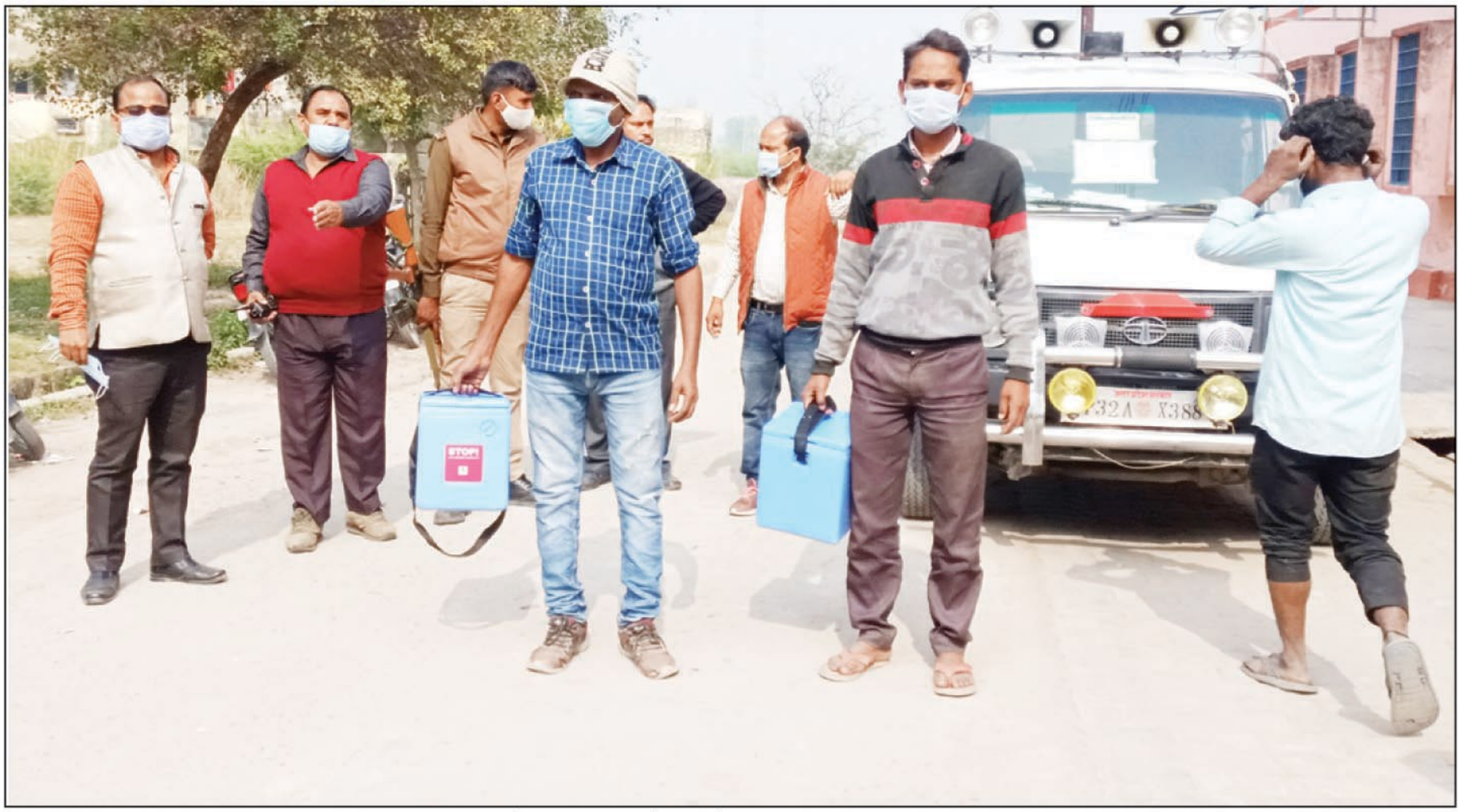
कोविड-19 सैपल के साथ स्वास्थ्य टीम