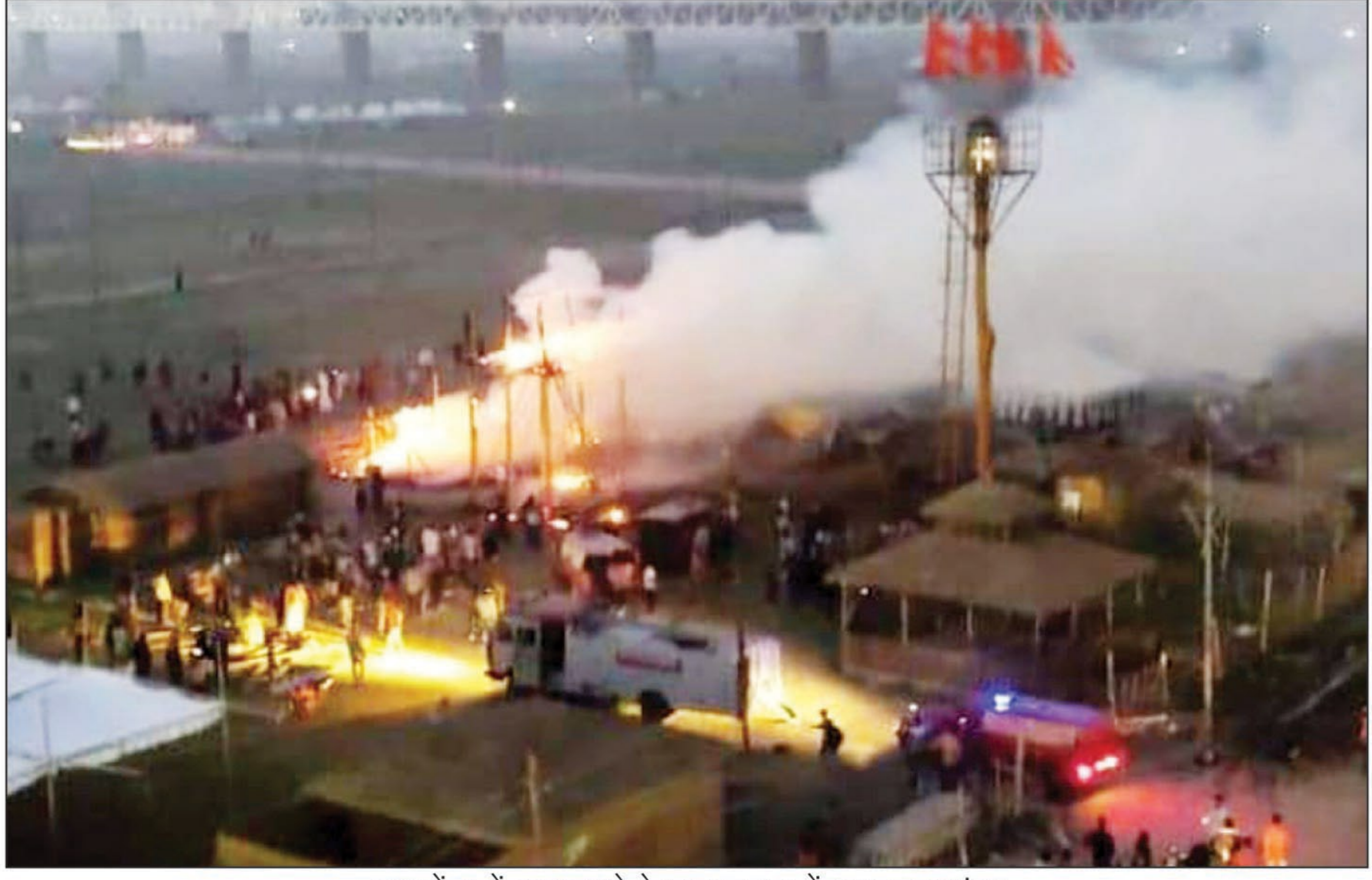
माघ मेला में आग लगने के बाद जलता टेंट व उजता धुआ

प्रयागराज। मेला बसने से पहले ही रविवार को शाम माघ मेला में भीषण आग लग गई। आग लगने की सूचना मिलते ही मौके पर पहुंची फायर ब्रिगेड की टीम आग पर काबू पाने का प्रयास करने में जुट गई। बताया जा रहा है कि शार्ट सर्किट की वजह से आग लगी है। आग लगने की वजह से मेला में अफरा-तफरी का माहौल है। गनीमत यही रहा कि अभी जगह-जगह शिविर लगने की तैयारियां हो रही हैं। कुछ जगहों पर शिविर लग भी चुका है। जैसे ही आग लगने की सूचना दमकल विभाग को हुई तो तत्पत्रता दिखाते हुए मौके पर दमकल विभाग की कई गाड़ियां पहुंच गईं। हालांकि माघ मेला प्रशासन की तत्पत्रता की वजह से आग पर काबू पा लिया गया। आग लगने से नवनिर्मित टेंट तथा सड़के आसपास के टेंट जलकर खाक हो गये।