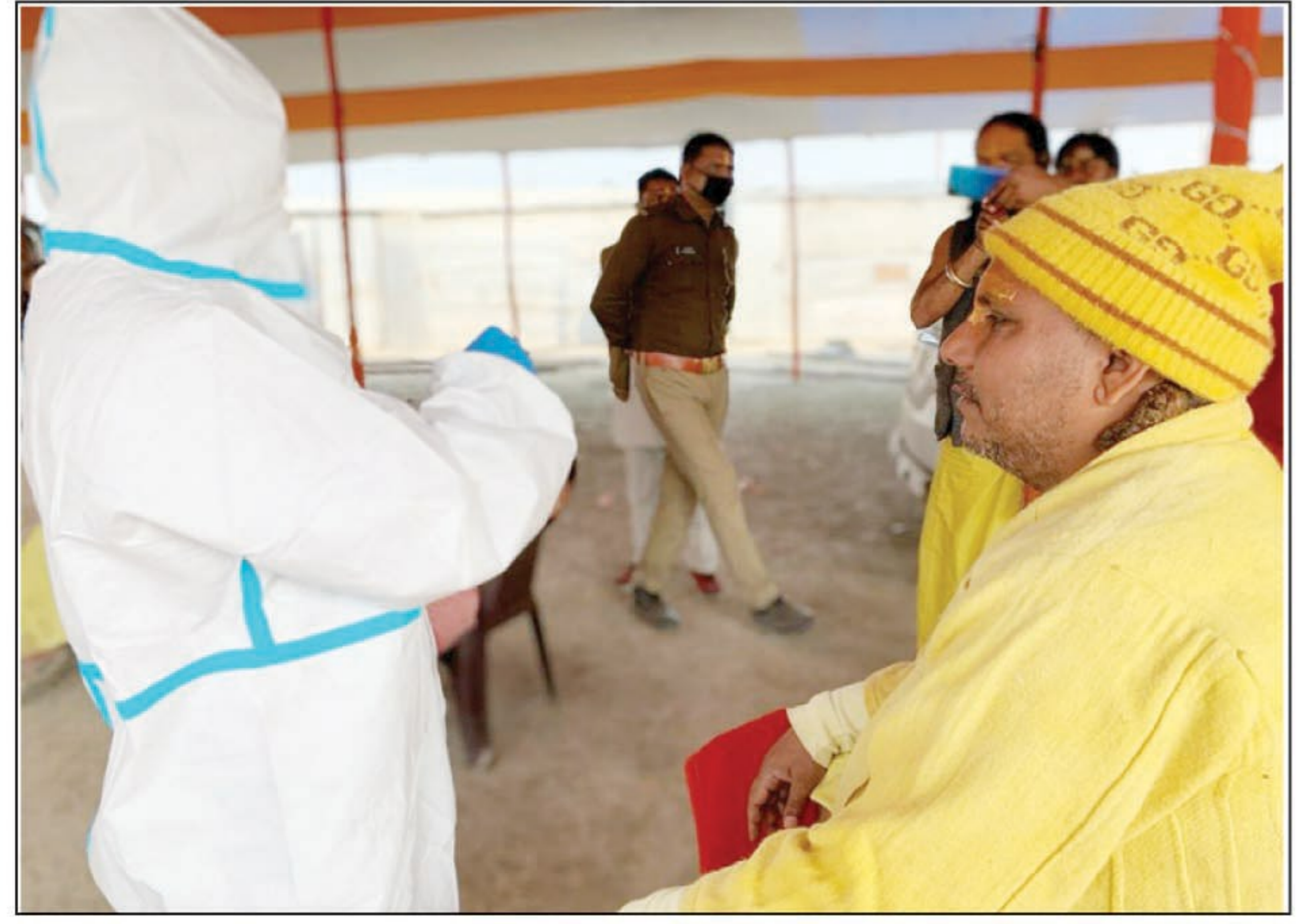
कोविड-19 की जांच करती स्वास्थ्य टीम