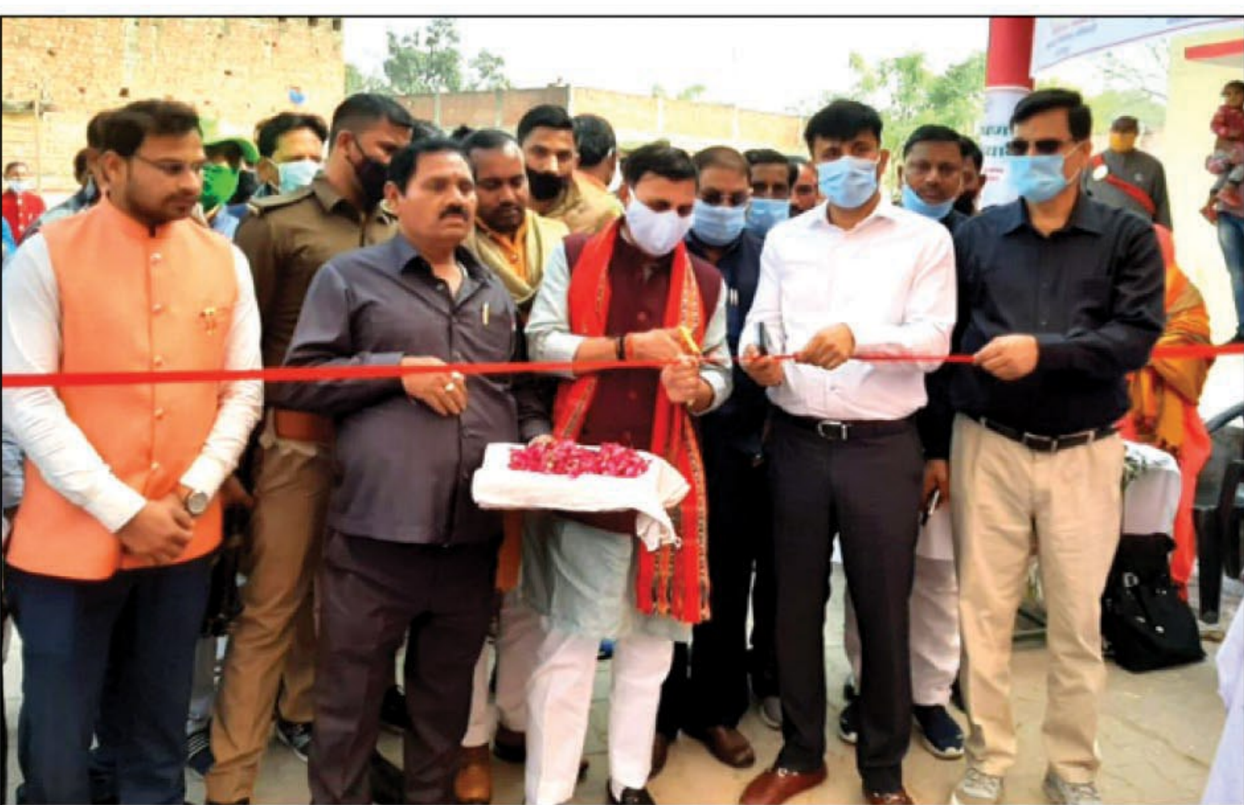
आरोग्य मेले का शुभारंभ करते सांसद विनोद सोनकर

कौशांबी। भारतीय जनता पार्टी की केंद्र व राज्य की योगी सरकार जनता के स्वास्थ्य व देखभाल की पूरी जिम्मेदारी संभालने के लिए अब गाँव-गाँव घर-घर ब्लॉक स्तर पर स्वास्थ्य कैंप लगाकर ओपीडी के माध्यम से लोगों के रोगों की जांच करके उनको घर में ही दवा मुहैया कराने की योजना साकार कर रही है। भारतीय जनता पार्टी के राष्ट्रीय मंत्री व सांसद विनोद सोनकर ने रविवार को करारी स्थित मुख्यमंत्री जन आरोग्य मेला का शुभारंभ करते हुए कहा कि प्रदेश सरकार द्वारा गरीब असहाय लोगों के साथ साथ जनपद के सभी लोगों के स्वास्थ्य की जिम्मेदारी प्रदेश सरकार ले रही है इसके लिए ब्लॉक व ग्राम पंचायत स्तर पर मुख्यमंत्री जन आरोग्य मेला का आयोजन किया जाएगा जिससे लोगों को अपने स्वास्थ्य की जांच करके रोगों के लिए बाहर नहीं जाना पड़ेगा। उन्होंने कहा कि यह मेला प्रत्येक रविवार को लगेगा जिसमें श्वेय रोग मलेरिया डेंगू, वायरल, कालाजार कैसर टीकाकरण