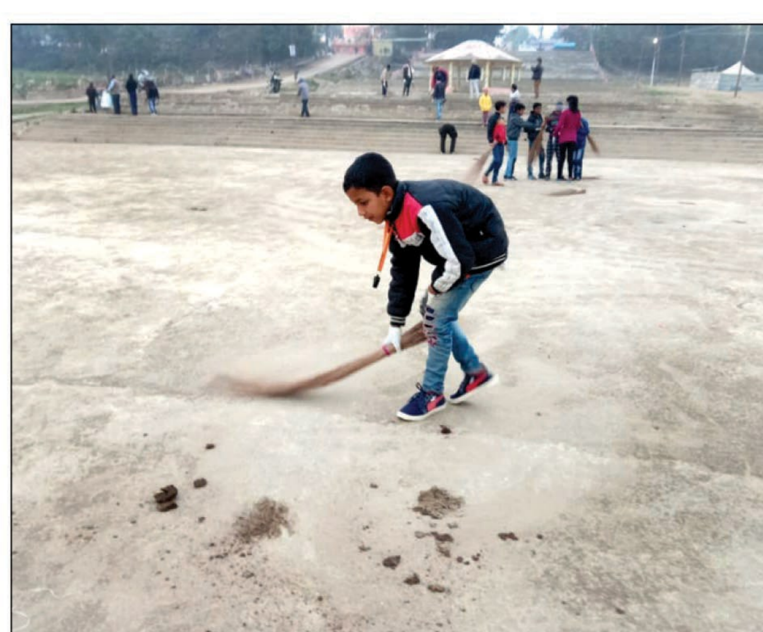
अरैल स्थित पुराने घाट पर साफ सफाई करते बच्चे