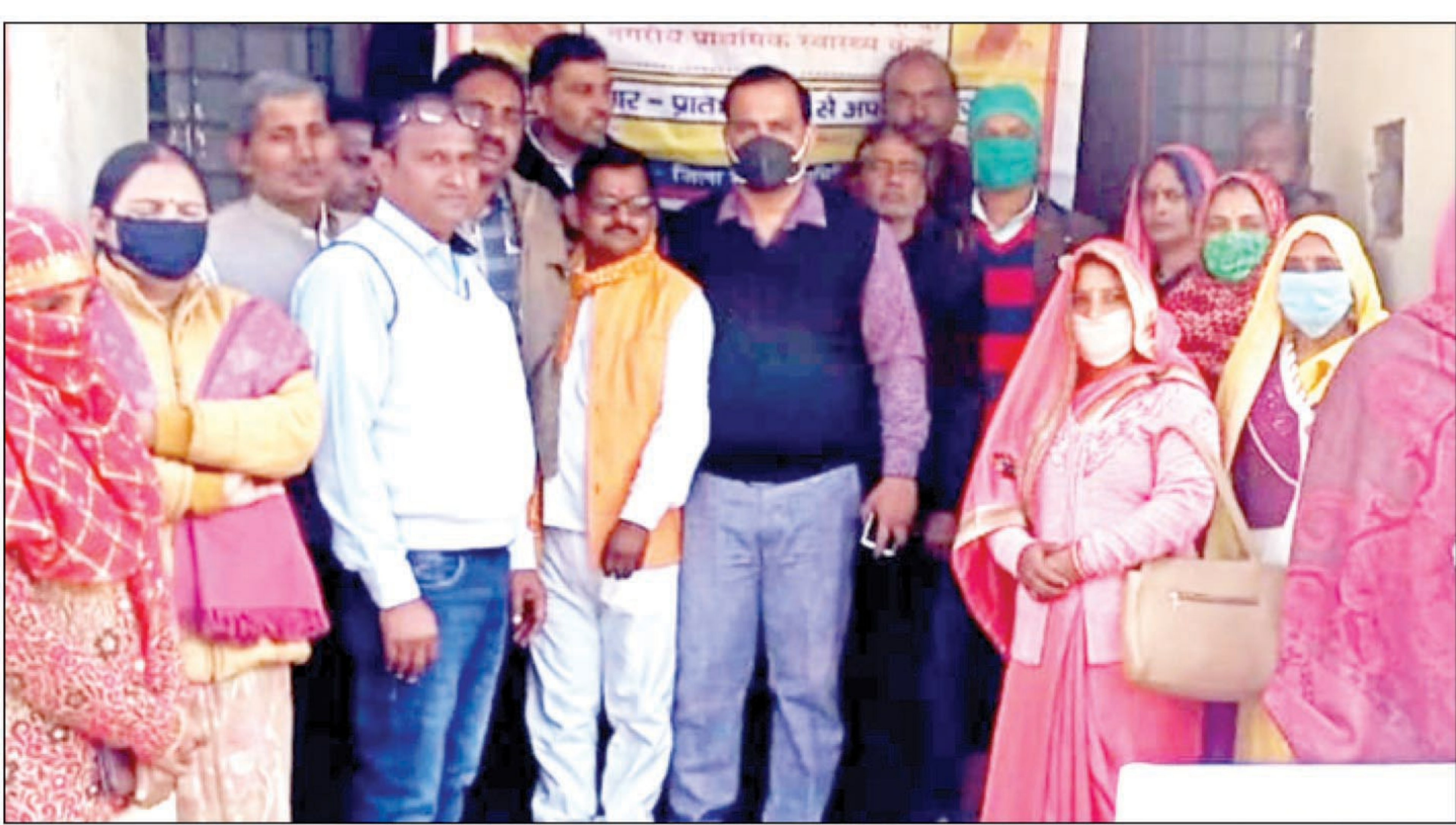
कार्यक्रम में उपस्थित डॉक्टर व अन्य

मऊआइमा। विश्व स्वास्थ्य संगठन डब्ल्यूएचओ प्रतिष्ठित मैगजीन टाइम समेत दुनिया ने यूपी व भारत के कोरोना प्रबंधन की सराहना की है। चाहे प्रवासी मजदूरों का विषय हो या स्वरोजगार का हर जगह योगी सरकार ने उत्तर प्रदेश का झंडा बुलंद किया। उत्तर प्रदेश की योगी सरकार भ्रष्टाचार पर जीरो टॉलरेंस के तहत कार्य कर रही है। आज उत्तर प्रदेश में पुनः मुख्यमंत्री आरोग्य मेले की शुरुआत हो रही है जिसमें आयुष्मान भारत योजना तथा मुख्यमंत्री जन आरोग्य अभियान के सम्बन्ध में लोगों को जानकारी दी जाएगी तथा पात्र लाभार्थियों को इन योजनाओं के गोल्डन कार्ड भी वितरित किए जाएंगे आम जनमानस को उन्नत चिकित्सकीय सेवाएं सुगमता से उपलब्ध करानी है तो हमारी सरकार प्रतिबद्ध है। प्रदेश के