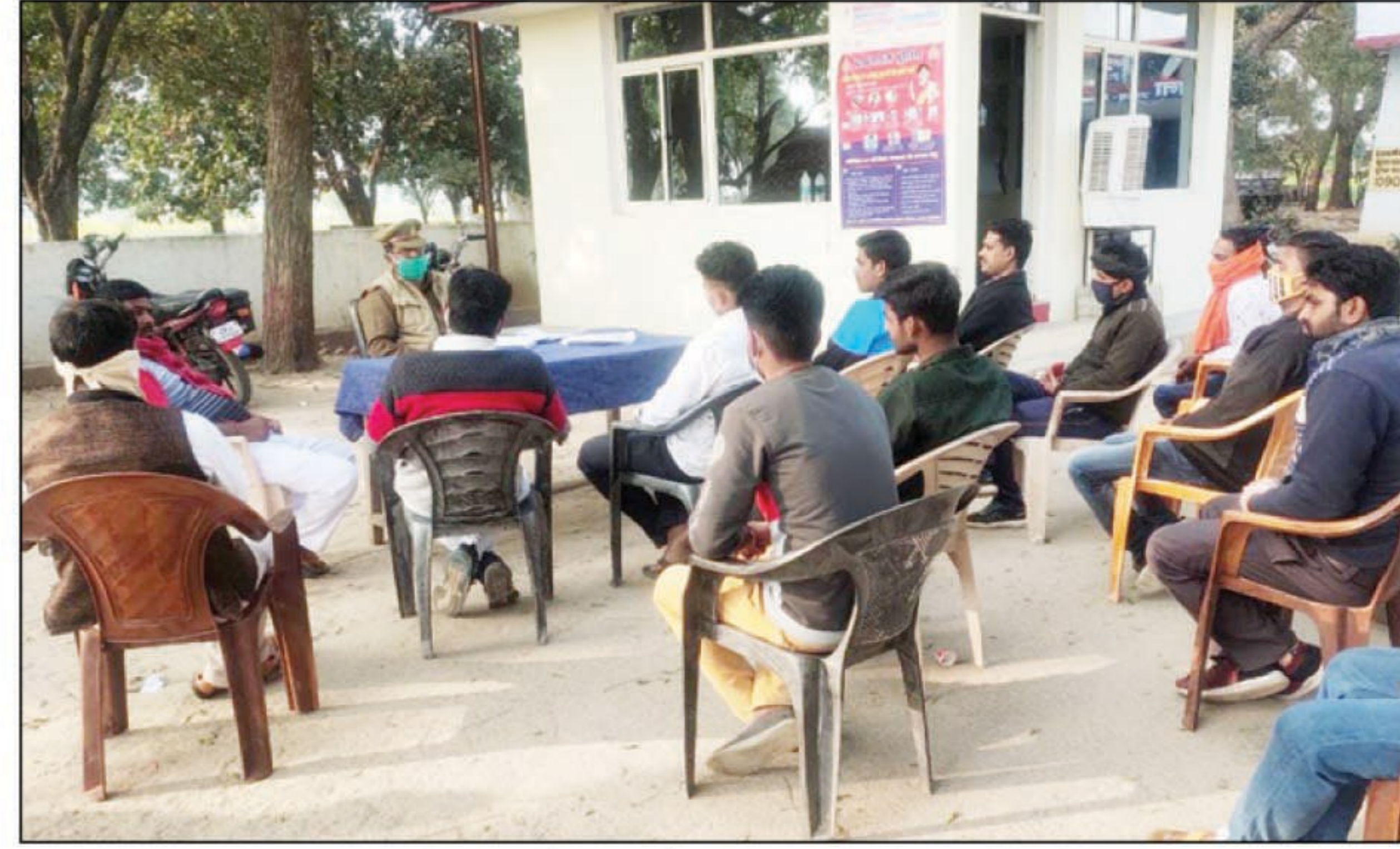
व्यापारियों संग बैठक करते थानाध्यक्ष