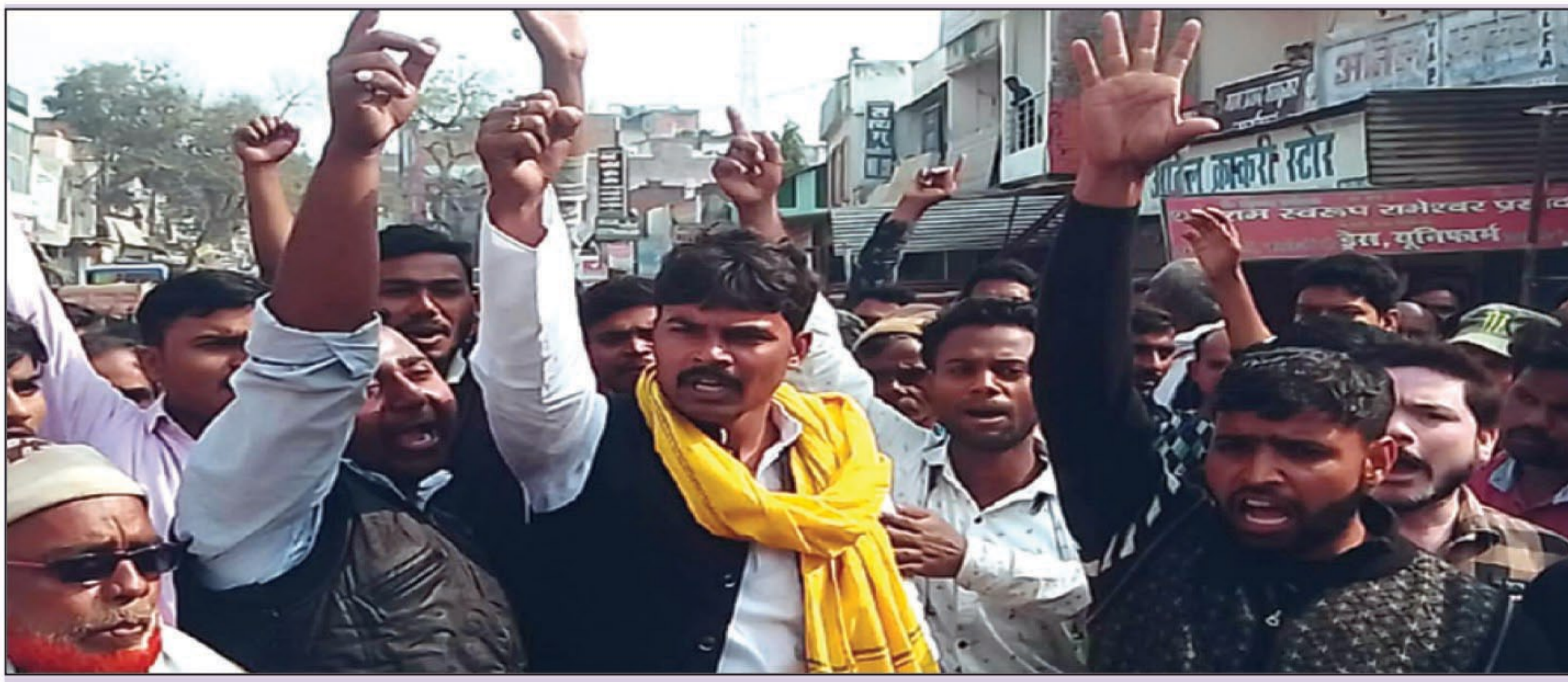
व्यापारियों ने विरोध में पट्टी उड़ैयाडीह मोड़ पर चक्का जाम व नारेबाजी करते