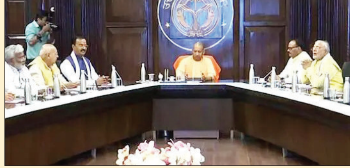
चारा-भूसा व अन्य आवश्यक कार्यों के लिए उपलब्ध कराई जाने वाली धनराशि सीधे गो-आश्रय स्थलों को उपलब्ध कराई जाए। डीबीटी प्रणाली उपयोग में

अभियान के तहत 1.23 लाख गोवंश संरक्षित किए गए। उन्होंने निर्देशित किया कि यह सुनिश्चित किया जाए कि प्रदेश के सभी ग्रामीण और शहरी क्षेत्रों में कोई भी गोवंश निराश्रित न हो। मुख्यमंत्री ने बताया कि जनपद संभल, मथुरा, मीरजापुर, शाहजहांपुर, संतकबीरनगर, अमरोहा, गौतमबुद्ध नगर, गाजियाबाद और फरुखाबाद में सर्वाधिक गोवंश संरक्षित किए गए हैं। गोवंश संरक्षण के लिए जारी नियोजित प्रयासों के अच्छे परिणाम मिल रहे हैं। चरणबद्ध रूप से सभी जिलों में इसी प्रकार निराश्रित गोवंश का बेहतर प्रबंधन किया जाए। उन्होंने कहा कि निराश्रित गोवंश स्थलों को