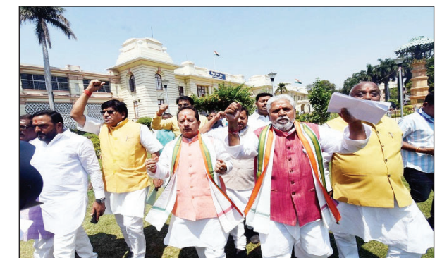
होने के लिए पहुंचे, लेकिन भाजपा का हंगामा देखकर उन्होंने अपना रास्ता बदल लिया और दूसरे रास्ते से परिषद पहुंचे। बिहार में नवरात्र के मौके पर हुए जुलूस में पथराव

पटना: बिहार में रामनवमी जुलूस के दौरान हुई हिंसा को लेकर बिहार विधानमंडल के दोनों सदन में सोमवार को विपक्षी भाजपा ने जोरदार हंगामा किया। इस वजह से आज मुख्यमंत्री नीतीश कुमार को विधान परिषद की कार्यवाही में शामिल होने के लिए अपना रास्ता बदलना पड़ा। विधानसभा के बाद जैसे ही विधान परिषद की कार्यवाही शुरू हुई तो विरोधी दल के सदस्यों ने हिंसा को लेकर भारी हंगामा शुरू कर दिया। विधान परिषद के बाहर भी भाजपा के सदस्यों ने जोरदार हंगामा किया। हंगामे के बीच सीएम नीतीश परिषद की कार्यवाही में शामिल