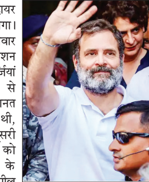
हलफनामा दायर करना होगा। राहुल ने सोमवार को सूट सेशन कोर्ट में दो अर्जियां लगाईं। इनमें से एक में जमानत मांगी गई थी, जबकि दूसरी अर्जी सजा को खत्म करने के लिए थी। अपील करने के लिए राहुल गांधी के साथ राजस्थान के सीएम अशोक गहलोत ने राहुल के आने से पहले प्रेस कॉन्फ्रेंस की। 23 मार्च को

सूत: मानहानि केस में सूट के सेशन कोर्ट ने राहुल गांधी को सोमवार को 15 हजार के मुचलके पर जमानत दे दी। यह तब तक रहेगी, जब तक कि राहुल की अर्जी पर फैसला नहीं हो जाता। अब इस मामले में अगली सुनवाई 13 अप्रैल को होगी। अगली सुनवाई में राहुल का मौजूद रहना जरूरी नहीं है। निचली अदालत से दी गई सजा पर रोक की अर्जी पर अभी कोई फैसला नहीं हुआ है। इस अर्जी पर कोर्ट ने याचिकाकर्ता पूर्णेश मोदी को नोटिस जारी किया है। जिस पर 10 अप्रैल तक उन्हें