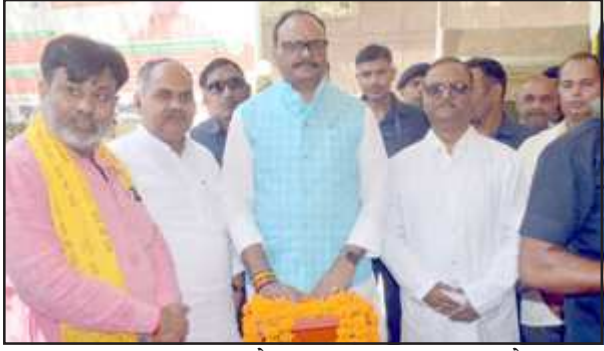
प्रताप बहादुर अस्पताल के नए भवन का उद्घाटन करते हुए उप मुख्यमंत्री ब्रजेश पाठक।