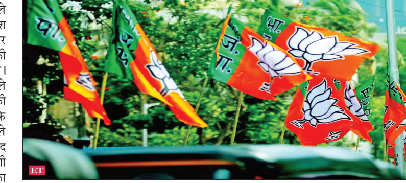
शहरों में पहले ही प्रबुद्धजनों से संवाद स्थापित कर चुके हैं। उन्हें विकास की सौगात भी दे चुके हैं। प्रबुद्धजन सम्मेलन के जरिए योगी आदित्यनाथ बरेली में 1459 करोड़, प्रयागराज में 1295 करोड़, अयोध्या में 1057 करोड़, गोरखपुर में 950 करोड़,

लखनऊ: 2024 लोकसभा चुनाव से पहले शहर की सरकार बनाने के लिए उत्तर प्रदेश की 17 नगर निगमों पर भाजपा की नजर है। मुख्यमंत्री योगी आदित्यनाथ के कार्यों की बदौलत भाजपा ने तैयारी भी शुरू कर दी है। वहीं सबे के मुखिया योगी आदित्यनाथ पहले ही सभी नगर निगम क्षेत्रों में विकास की सौगात देकर प्रबुद्धजनों से संवाद साध चुके हैं। पहली बार महापौर चुनने वाले शाहजहांपुर के लोगों से भी योगी का संवाद हो चुका है। यहां भी लोगों ने योगी आदित्यनाथ को पहला महापौर व भाजपा का बोर्ड बनाने का आश्वासन दिया। प्रबुद्धजनों से संवाद, विकास की सौगात भी दे चुके हैं योगी: मुख्यमंत्री योगी 17