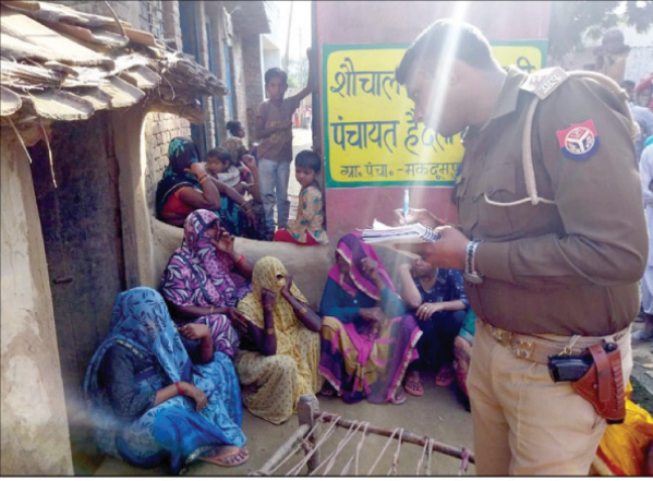
बालिका की मौत के बाद घटनास्थल पर मौजूद पुलिस और परिजन