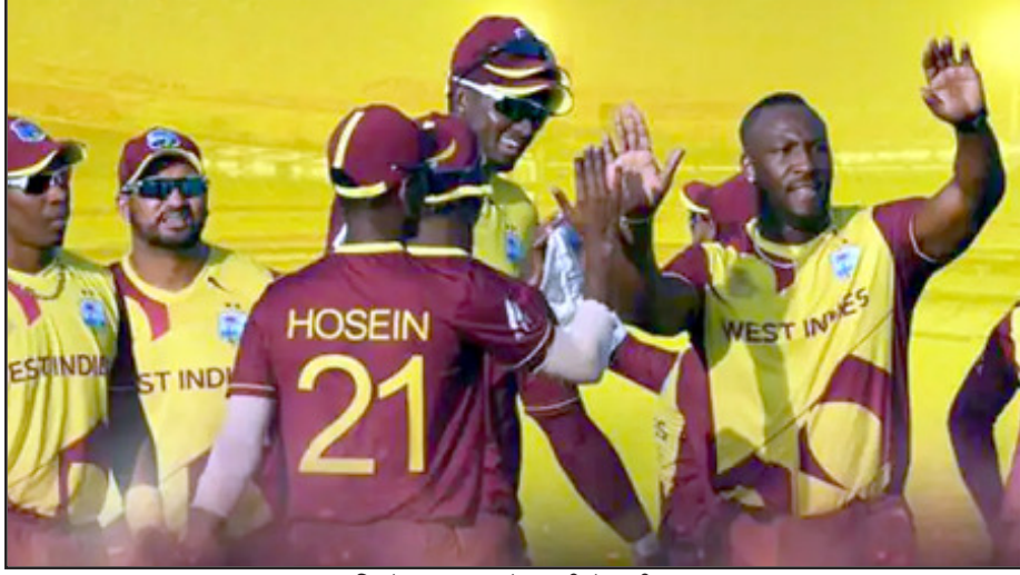
लिए चौका चाहिए था, लेकिन रसेल ने बेहतरीन बॉल डालकर जीत विंडीज की झोली में डाल दी।

नई दिल्ली (एजेंसी)। मैन आफ द मैच निकोलस पूरन (40) और ऑलराउंडर जेसन होल्डर (15) की तूफानी पारियों के बाद आंद्रे रसेल के बेहतरीन आखिरी ओवर की बदौलत वेस्टइंडीज ने शुक्रवार को शारजाह क्रिकेट स्टेडियम में बांग्लादेश के खिलाफ आईसीसी टी-20 विश्व कप 2021 में सुपर 12 स्टेज के ग्रुप-1 में मुकाबले में तीन रन से जीत हासिल कर सेमीफाइनल में पहुंचने की अपनी उम्मीदों को कायम रखा। विंडीज ने टॉस हारकर पहले बल्लेबाजी करते हुए 7 विकेट पर 142 रन का स्कोर बनाया और फिर बांग्लादेश को निर्धारित 20 ओवर में 5 विकेट पर 139 रनों पर रोक दिया। बांग्लादेश को पारी के आखिरी ओवर की अंतिम गेंद पर जीत के