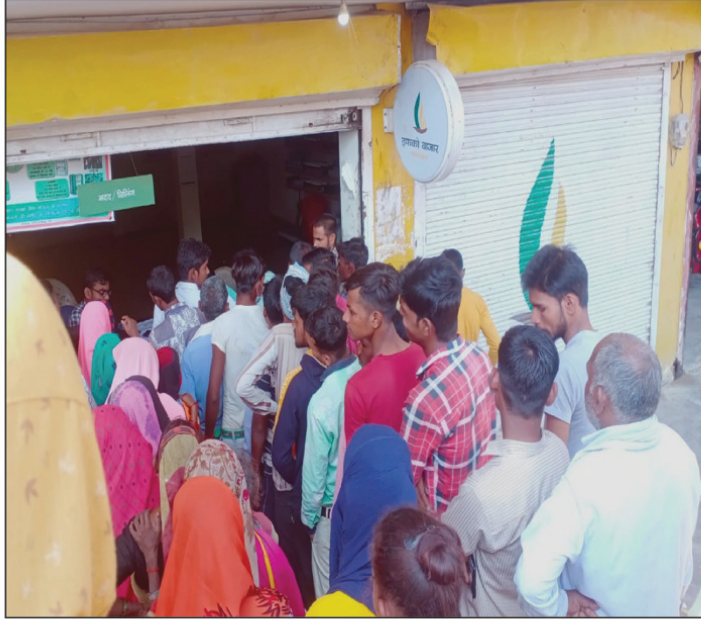
समितियों में उर्वरक के लिए लगी किसानों की भीड़

कालाबाजारी में लिप्त व्यापारियों को गिरफ्तार कर अधिकारियों ने अभी तक नहीं भेजा है जेल