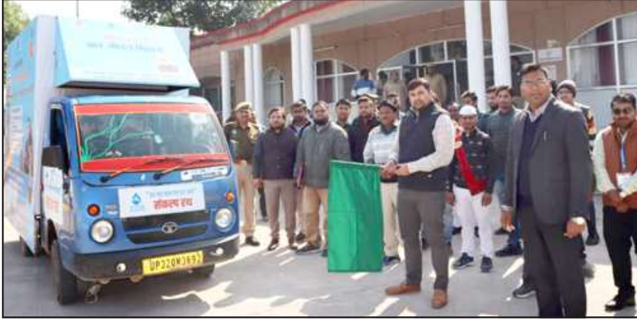
जल जीवन रथ को हरी झंडी दिखाते डीएम।

शुक्रवार को जिलाधिकारी ने कहा कि जिले में पानी की समस्या को काफी दिक्कतें होती थीं। केंद्र व राज्य सरकार ने जिले में पानी की समस्या दूर करने को कार्य योजना समेत पानी देने का कार्य किया है। उन्होंने कहा कि जल जीवन मिशन के तहत जिले के 562 गांवों में पाइप लाइन से