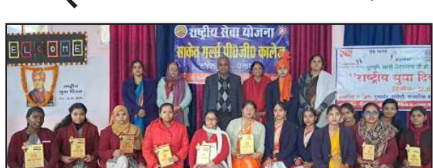
स्वामी विवेकानंद की जयंती पर मौजूद प्रबंधक व छात्रांगण।

प्रतापगढ़। साकेत गर्ल्स पी०जी० कॉलेज के सभागार में नेहरू युवा केन्द्र एवं राष्ट्रीय सेवा योजना के स्वयंसेवियों द्वारा स्वामी विवेकानंद की जयंती धूम-धाम से मनायी गई। इस अवसर पर छात्राओं ने स्वामी विवेकानंद की आराधना एवं मेरे राम शीर्षक पर नृत्य नाटिका का मंचन किया गया। छात्राओं में भाषण प्रतियोगिता, पेनिंटिंग प्रतियोगिता, रंगोली प्रतियोगिता, लोक गायन एवं नृत्य