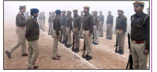
परेड में सुधार के निर्देश देते एसपी।

शुक्रवार को पुलिस अधीक्षक ने पुलिस लाइन की परिवहन शाखा, पुलिस लाइन मेस, सीपीसी कैंटीन, आरओ प्लांट, ऑफिसर्स क्लब, आरक्षी बैरिक, डायल 112 कार्यालय, आरओआईपी कार्यालय, जिला नियंत्रण कक्ष, साइबर थाना, फील्ड यूनिट, मंदिर, पुलिस लाइन आवासीय परिसर,