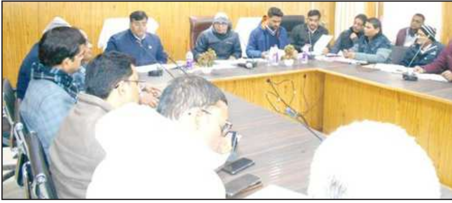
बैठक में बोलते विशेष सचिव राम केवल।

गो आश्रय स्थलों के सम्बन्ध में मुख्य पशु चिकित्साधिकारी से जानकारी ली तो बताया गया कि 64 गौशालाओं में संचालित है तथा 18 अस्थायी गौशालाओं का निर्माण कार्य चल रहा