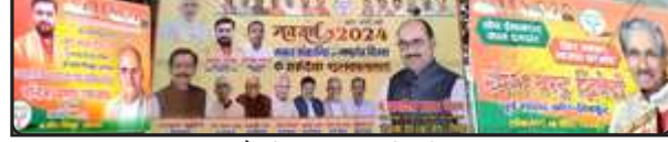
चौराहे पर लगी होडिंगें।

चित्रकूट। जिला मुख्यालय के चैराहा समेत विभिन्न क्षेत्रों में लोकसभा चुनाव के मद्देनजर नये वर्ष व मकर संक्रान्ति पर्वों पर नेताओं के बधाई देने की होडिंगें टंग गई हैं। ये होडिंगें तो महज बानगी हैं, होडिंगें तो तमाम ऐसे लोगों की भी लगी है जो बसपा सरकार में कद्दावर मंत्री रहे बाबू सिंह कुशवाहा की काली कमाई से