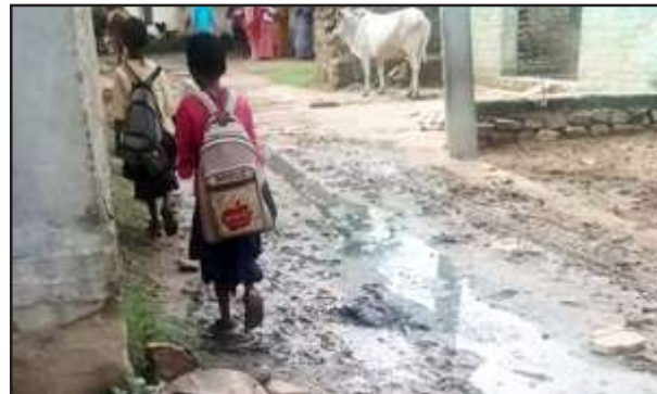
खपटिहा गांव की दलदल भरी सड़क।