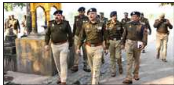
मार्गों का निरीक्षण करते आईजी-डीआईजी।

शुक्रवार को उच्चाधिकारियों ने भरतकूप मंदिर से रामसड़वा से खोही तिराहा से निर्मांही अखाड़ा से रामायण मेला परिसर होते हुये बेड़ीपुलिया के सड़क मार्ग का निरीक्षण किया। सम्बन्धित को यात्रा दौरान सुरक्षा व्यवस्था एवं यातायात